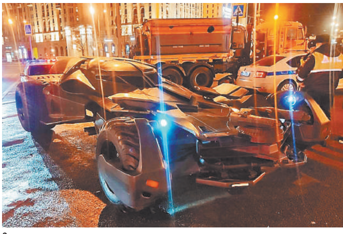
Эвакуаторщикам пришлось поговорить, прежде чем им удалось погрузить на платформу машину в 4 метра шириной и с огромными колесами.

В итоге «бэтмобилю» был доведен на штрафстоянку. Кстати, с этим возникли непредвиденные трудности. Оказалось, что эвакуаторы просто не при-