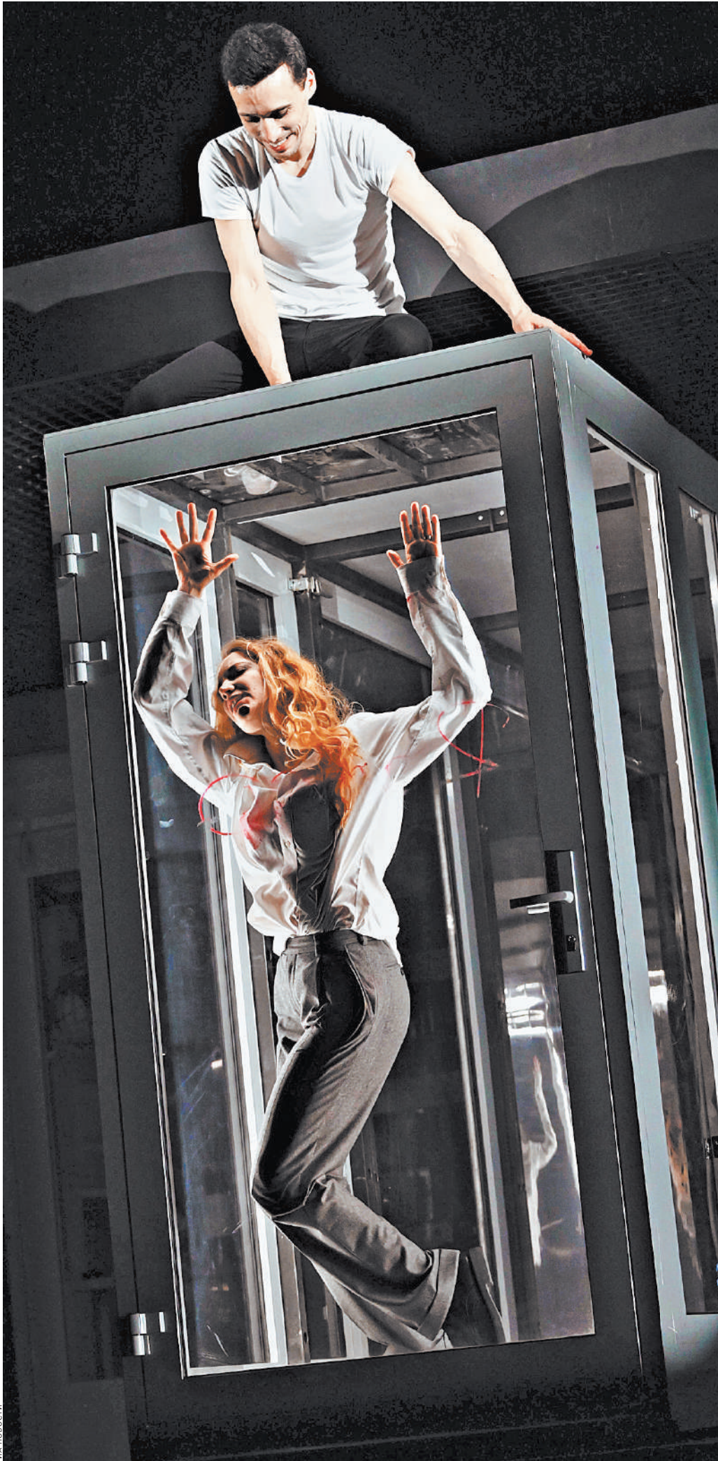
В спектакле Молодежного театра сцена ночного свидания в спальне Джульетты — все в том же стеклянном ларьке в переходе — резкие движения, росчерк кровавой помады на стекле. Обыденный трагизм.