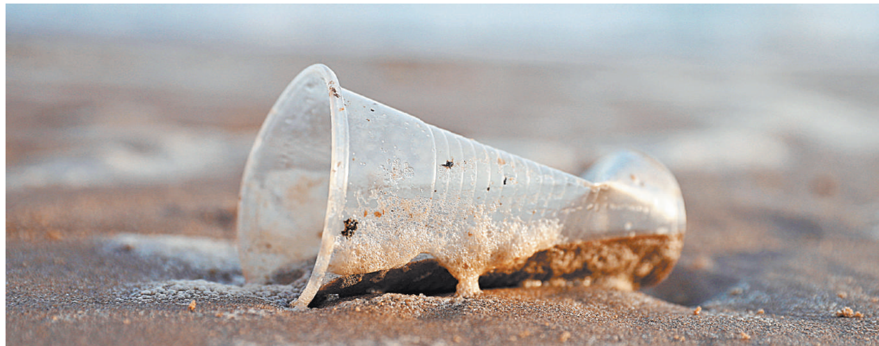
Пластиковый стаканчик люди используют пару минут, а он потом будет загрязнять природу долгие годы.

По его словам, запуск механизма раздельного сбора ТКО в два раза сократит объемы захоронения мусора, а также существенно поменяет его структуру. Сейчас в России более 50% от общего объема ТКО (и около 17% от общей массы) приходится на упаковку различных товаров.