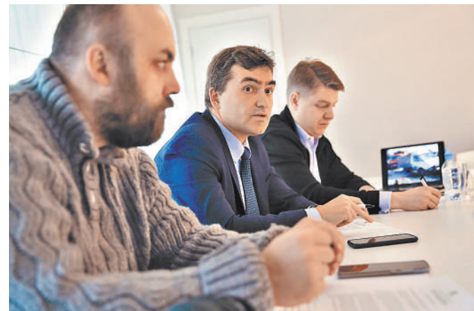
Эксперты наглядно показали, чем может закончиться остановка на МКАД.