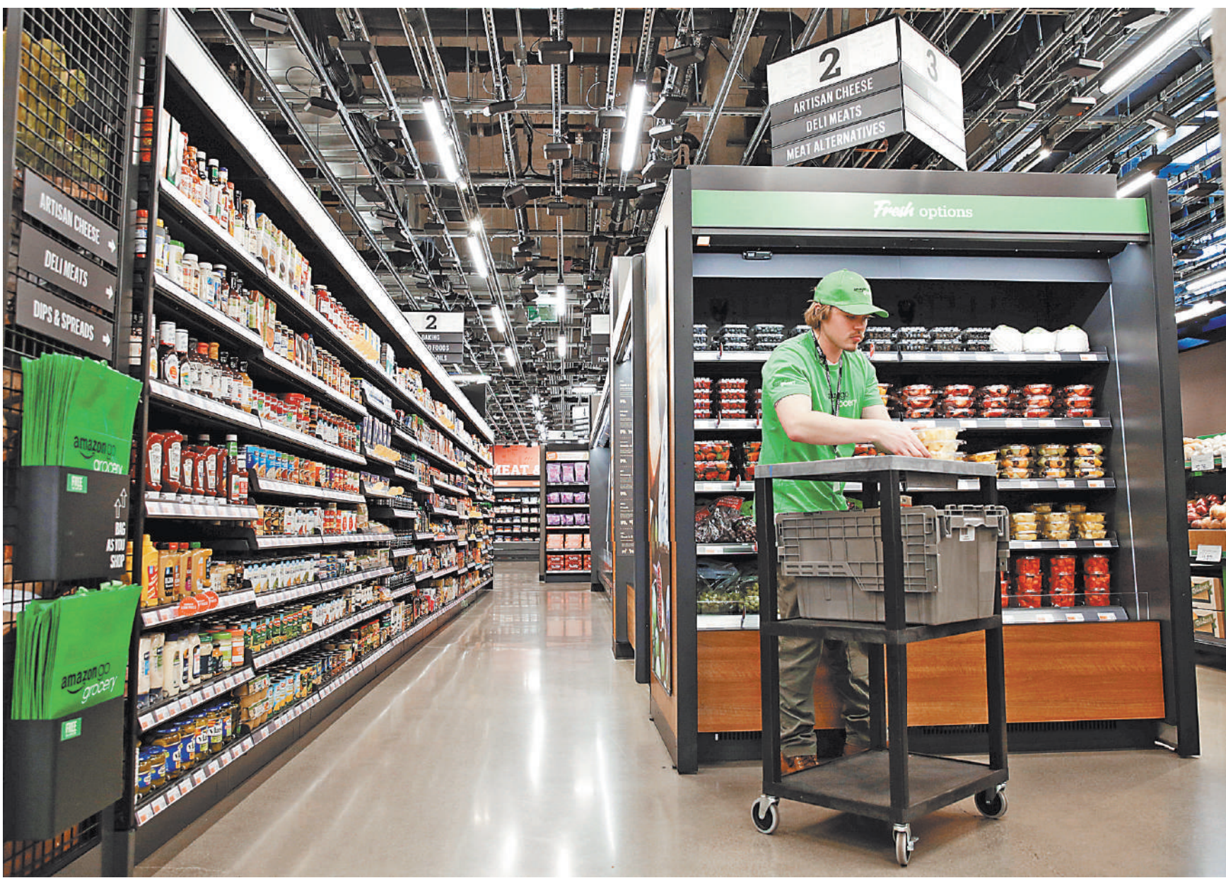
В ближайшее десятилетие магазины научатся обслуживать покупателей без продавцов.