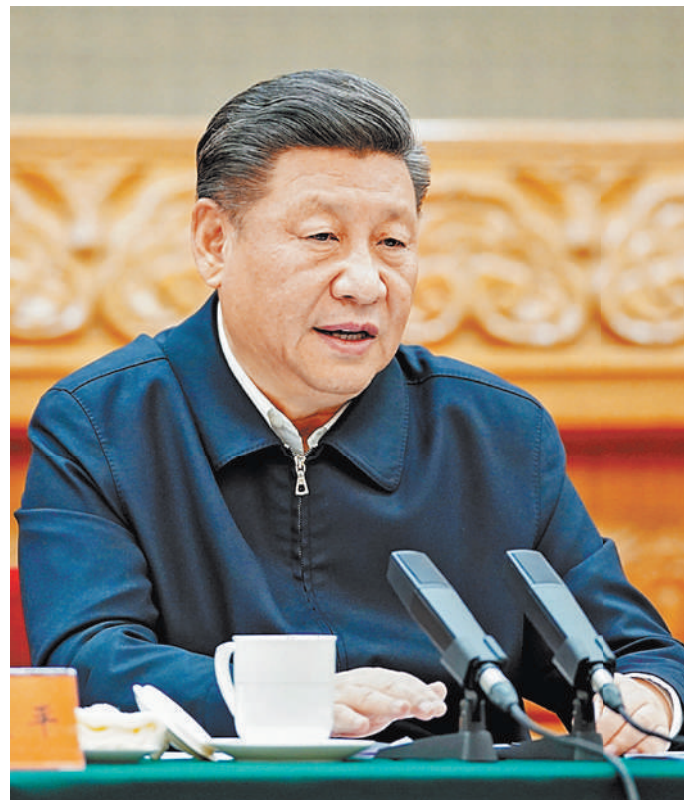
23 февраля председатель КНР Си Цзиньпин подчеркнул необходимость приложения неустанных усилий для профилактики и контроля за эпидемией COVID-19, а также для ускорения социально-экономического развития страны.