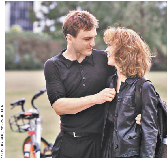
Героиня фильма «Ундина» вышла из легенды о подобии Русалки, любить которую опасно для жизни.

Болезнь изобретений художественный этюд представил в конкурсе Кристиан Петцольт — классик «берлинской школы». Его «Ундина» основана на легенде о морском создании, подобии Русалки, которая мечтает выбраться из морских пучин на земную твердь, но для этого ее должен полюбить юноша, а если ей изменит — пусть покарает его суровая рука суженой. История эта дана в образах современных берлинцев, где Ундина (Паула Бер) — экскурсовод в музее, рассказывает о прошлом, настоящем и будущем Берлина так подробно, что эти эпизоды становятся фильмом в фильме и