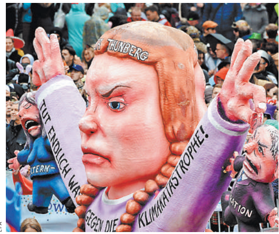
Образ Греты Тунберг на карнавале в Кельне оказался довольно серьезным: шутить над шведкой в Германии не принято.