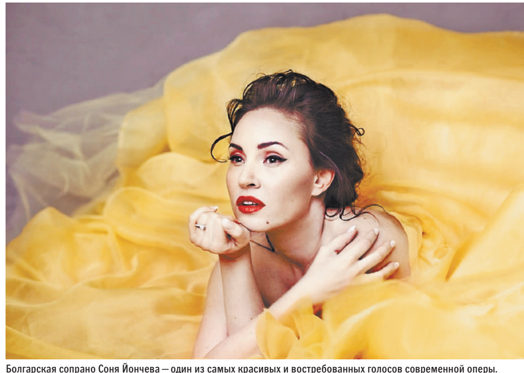
Болгарская сопрано Соня Йончева — один из самых красивых и востребованных голосов современной оперы.

СОНЯ ЙОНЧЕВА: Я просто могу и хочу быть разной. В хоре я вообще пела как контрольно. Голос меняется, меняются мои певческие желания. И сейчас есть много нового, что мне хотелось бы спеть, а к чему-то, быть может, вернуться. Например, спеть Татьяну в «Евгении Онегине» и Иоланту Чайковского в Большом театре. Я обожаю Татьяну, а «Иоланта» — моя любимая опера. Она очень эмоциональна. Я всегда плакала, когда ее пела. А потом, может, меня пригласит исполнить что-нибудь из Пуччини, например, «Манон Леско»... Сегодня в мире сцена — единственное место свободы, где ты можешь делать все. ●