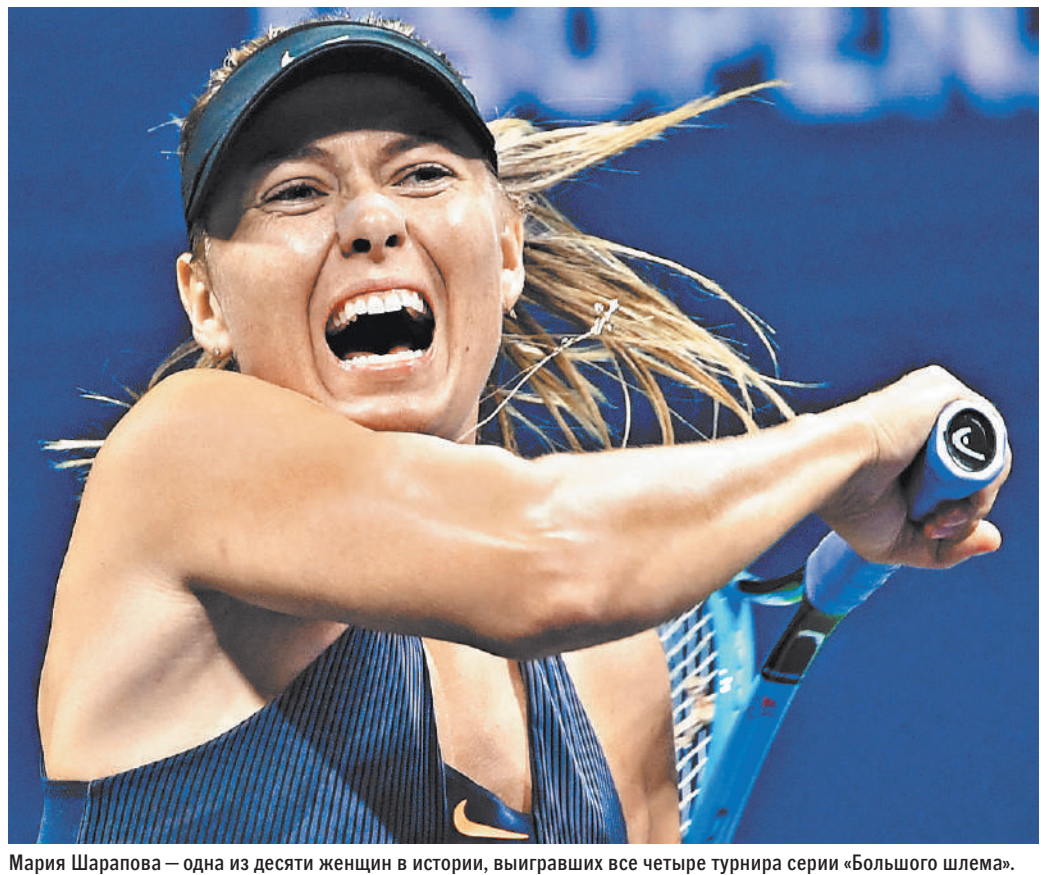
Мария Шарипова — одна из десяти женщин в истории, выигравших все четыре турнира серии «Большого шлема».

— Мария настоящая чемпионка, а за пределами корта — бизнес-леди. Она много достигла в жизни.