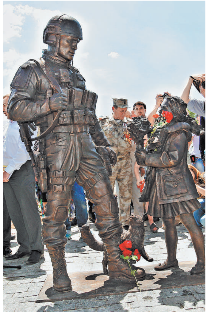
Памятник вежливым людям, открытый 11 июня 2016 года в центре Симферополя, быстро стал одной из достопримечательностей всего Крыма.

Особый интерес в издании представляют материалы о том, как строится работа сил специальных операций в армии шестнадцати стран. Многие из которых также активно участвуют в международных антитеррористических операциях, в том числе на Ближнем Востоке. Аннотацию к изданию напи-