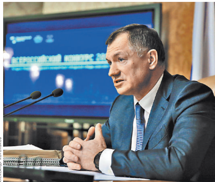
Марат Хуснуллин: Растет интерес регионов к конкурсу, чувствуется, что они готовы бороться за победу.

Важное новшество для победителей состоит в том, что вопрос финансирования проектов будет вынесен на заседание правительства России по поручению Марата Хуснуллина уже на следующей неделе и деньги они получат быстро. «Это значит, что уже весной они смогут начать работу над своими проектами», — сказал вице-премьер. Значит, от прежних проблем, когда деньги поступали лишь к концу года, нынешние победители будут избавлены. А чтобы такого не повторилось и в принципе, решено итоги конкурса подводить теперь к 1 сентября, а к 1 января уже обеспечивать финансирование проектов победителей.