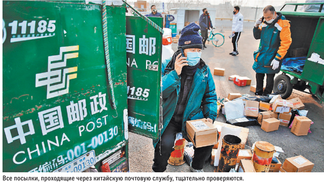
Все посылки, проходящие через китайскую почтовую службу, тщательно проверяются.

Главное таможенное управление Китая (ГТУ) заявило, что