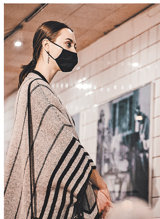
Многие произведения на выставке представлены впервые — огромный слой неисследованного.