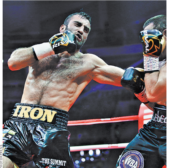
После перехода в другую весовую категорию Мурат Гассиев мог потерпеть в скорости, но зато удар стал еще мощнее.