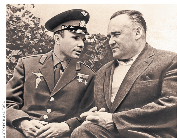
Главный конструктор Сергей Королев имел диплом Бауманки по специальности «Инженер-аэромеханик».