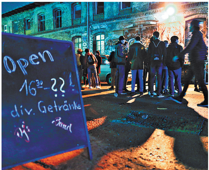
Посетители стоят в очереди, чтобы войти в берлинский бар Der Weisse Hase, который все еще открыт после 11 вечера, несмотря на ограничения.

Когда почти три недели назад в Берлине ввели комендантский час — предвестник карантина, засветгаતા столичных баров и клубов стремились до последнего погулять и танцевать.