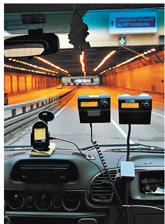
Тахографы следят за скоростью, режимом труда и отдыха водителей.