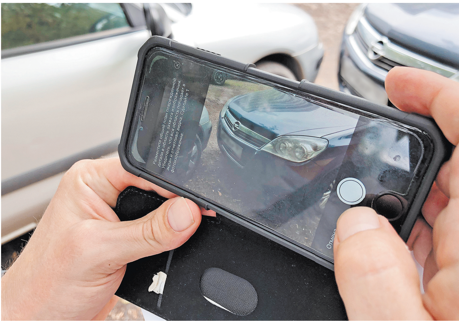
1 ноября электронное извещение о ДТП можно оформить в любом регионе, где бы ни произошла авария. Для этого необходимо, чтобы оба участника были зарегистрированы на портале госуслуг и хотя бы у одного из них было установлено на смартфоне приложение «Помощник ОСАГО». При этом при заказе от фотофиксации автовладелец может рассчитывать на возмещение только в пределах 100 тысяч рублей.

В минтрансе пояснили, что процесс разбили на этапы, чтобы перевозчики успели закупить оборудование и не сталкивались с очередями в мастерских. Например, до 1 марта 2020 года физлица должны были установить тахографы на грузовики массой более 12 тонн, экологический класс которых не определен.