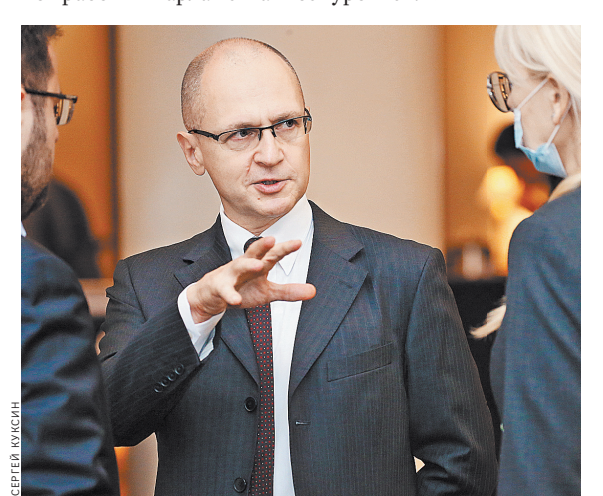
Сергей Кириенко: 2021 год будет исключительно интересным для желающих попробовать свои силы в политике.

Теперь все победители с декабря по июнь примут участие в специальной образовательной программе, которую разработали Мастерская управления «Сенеж» совместно с Высшей школой госуправления РАНХиГС. Конкурс проводился по поручению президента России, цель — поиск перспективных кадров для законодательной работы в парламентах всех уровней. ●