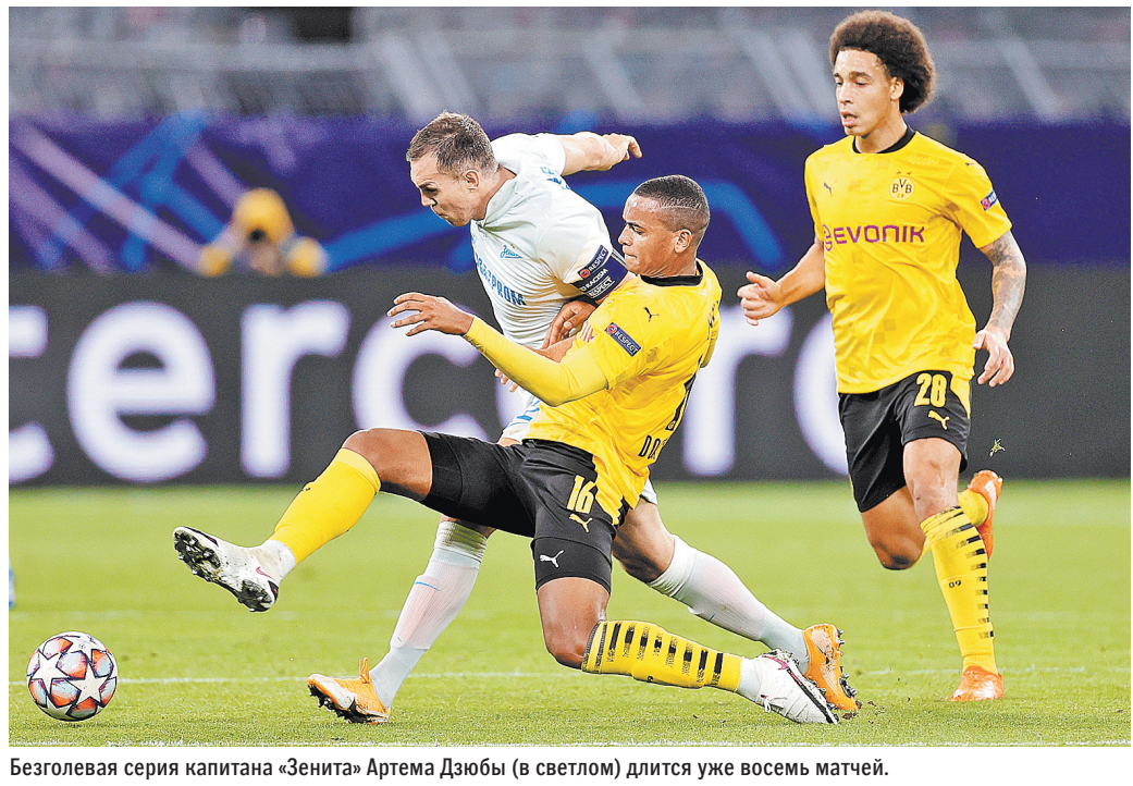
Безоголевая серия капитана «Зенита» Артема Дзюбы (в светлом) длится уже восемь матчей.