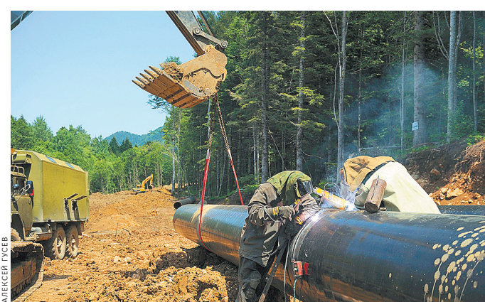
В крае активно строят новые сети водоснабжения.

В целом в Краснодарском крае питьевой водой из централизованных систем коммунального водоснабжения обеспечиваются около четырех миллионов человек. Действуют 950 систем централизованного водоснабжения. Производственные мощности коммунальных водопроводов составляют 2651 тысячу кубических метров в сутки. Общая протяженность водопроводных сетей в крае достигает 28,8 тысячи километров. Однако при этом протяженность аварийных и нуждающихся в замене водопроводных сетей достигает 14,7 тысячи километров. В связи с этим остаются высокими потери воды при ее транс-