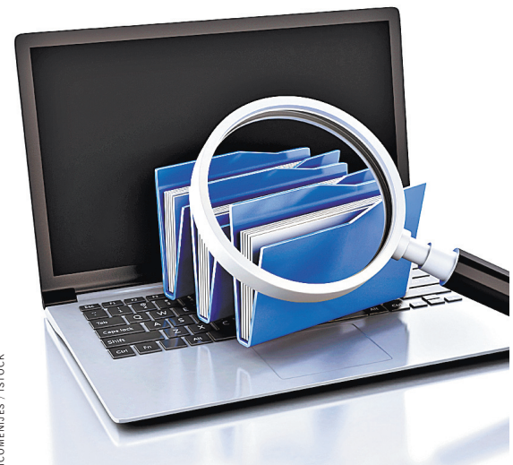
Пока 155 компаний решили принять участие в эксперименте по переходу на электронный кадровый документооборот.