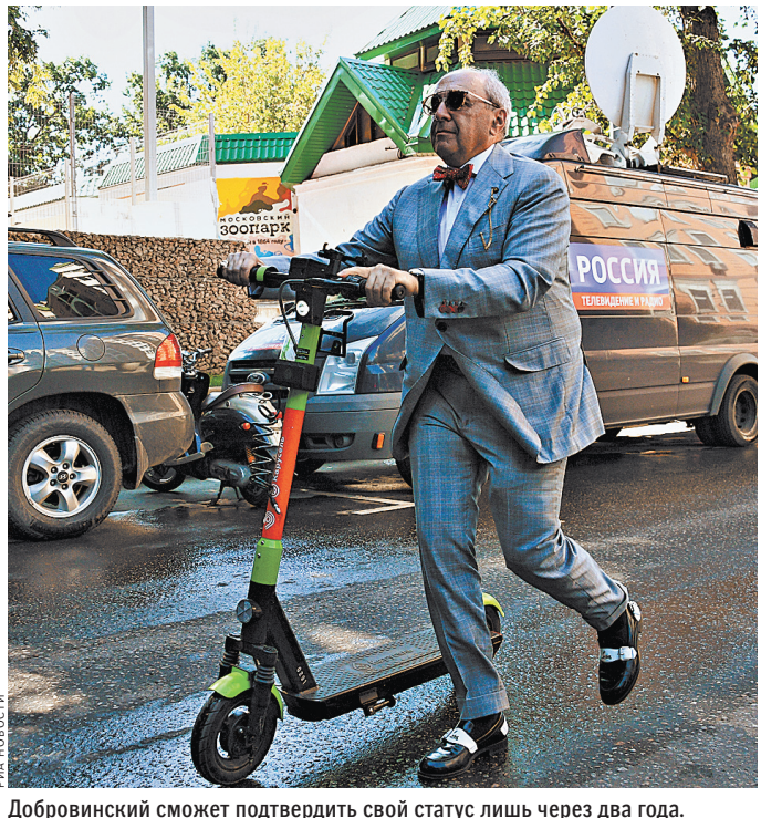
Добровинский сможет подтвердить свой статус лишь через два года.

Министерство юстиции пояснило, что по делу Ефремова адвокат допускал высказывания, которые «содержат признаки нарушений законодательства об адвокатской деятельности и адвокатуре и Кодекса профессиональной этики адвокатов, демонстрируют пренебрежительное отношение к правилам адвокатской профессии и указывают на игнорирование корпоративной дисциплины, этики и нравственности». ●