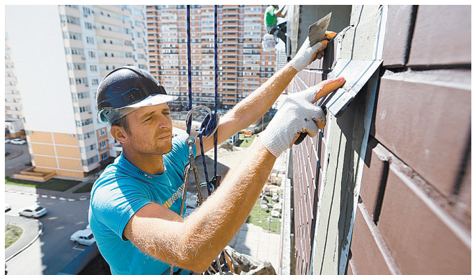
За три года заветные ключи от квартир получат 30 тысяч дольщиков.