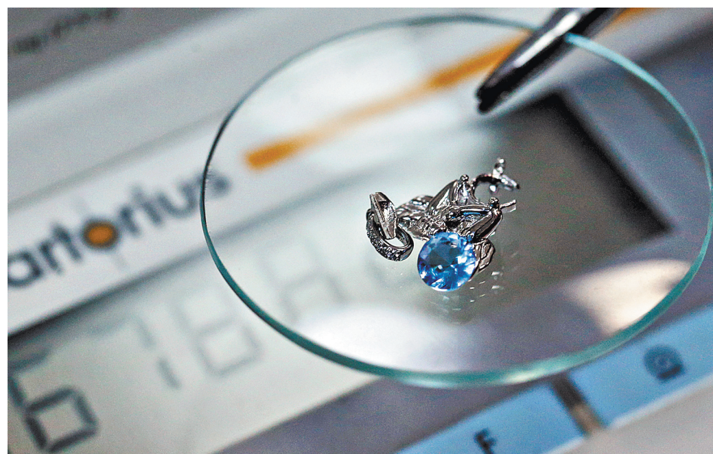
Традиция опробования и клеймения ювелирных изделий идет со времен Петра I.

В России отмена опробования и клеймения могла бы привести к ухудшению качества изделий — уменьшению процентного содержания золота в них, считает Эдуард Уткин.