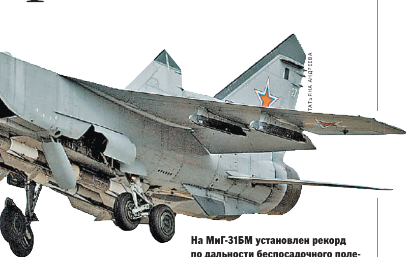
На МиГ-31БМ установлен рекорд по дальности беспосадочного полета — более 8 тысяч километров.

А еще МиГ-31 фактически не имеет ограничений по дальности полета. Многочасовое барражирование в небе ему гарантирует