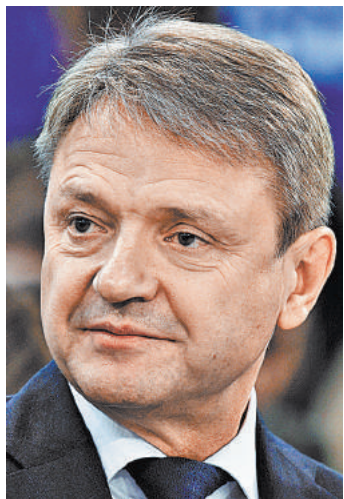
Глава миссельхоза рассчитывает, что цены на топливо к посевной стабилизируются.

В ходе «правительственного часа» Ткачев сообщил, что в прошлом году в России было собрано 134 миллиона тонн зерна. «Рекордный урожай зерновых в объеме 134 миллиона тонн, полученный в прошлом году, позволит нам экспортировать в этом сезоне до 45–47 миллионов тонн зерна», — считает министр. С начала сезона уже отправлено на экспорт 28 миллионов тонн зерна, что на 35% больше, чем в прошлом году (21 миллион тонн). Главное, чтобы не возникло проблем с транспортировкой. «Рекордный урожай выявил инфраструктурные ограничения — неготовность железнодорожных операторов работать с возросшими объемами зерна», — отметил Ткачев. Если раньше при экспорте 35 миллионов тонн вагонов было достаточно, то при потенциальном экспорте 45 миллионов вагонов нужно увеличить на 20–25 процентов, полагают в миссельхозе. Работа с минтрансом уже идет.