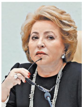
Валентина Матвиенко: Важно исключить любые попытки внешнего вмешательства в процесс выборов.

Предстоящая сессия «пойдет в особые условия», поскольку в России стартовала кампания по выборам президента, сразу предупредила спикер СФ Валентина Матвиенко. «Наша обязанность как законодателей, представителей субъектов Федерации — приложить все усилия для того, чтобы как можно больше граждан пришли на президентские выборы», — сказала она. По ее словам, выборы должны пройти в строгом соответствии с законодательством на открытой конкурентной основе. «Важно исключить любые попытки внешнего вмешательства в процесс выборов», — сказала она и дала поручение членам временной комиссии по защите государственного суверенитета «внимательно отслеживать ситуацию». Глава Совфеда напомнила, что в декабре прошлого года Владимир Путин обозначил ряд важных инициатив, над частью которых сенаторы уже работают. «Среди них демографический пакет, реализация новых мер, направленных на возвращение в Россию капиталов, вопросы предотвращения внешнего влияния на внутриполитические процессы и многое другое», — рассказала Матвиенко. В ходе заседания с отчетом о работе выступил Андрей Климов, глава временной комиссии СФ по защите суверенитета, сформированной в июне прошлого года. За это время члены комис-