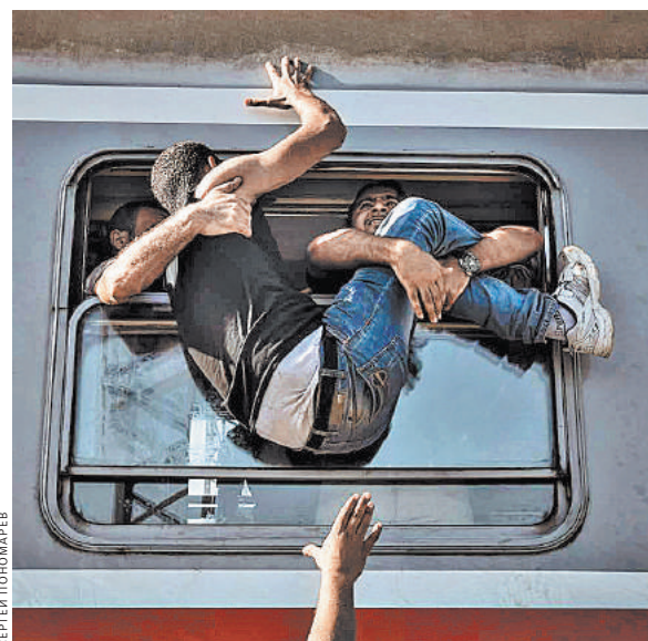
Сергей Пономарев. Отчаявшиеся беженцы пытаются сесть в поезд, идущий в Загреб, на станции Товарник на сербской границе.

В сходном жанре работает и Менди Баркер в серии «За пределами дрейфа»: совершенно неизвестные животные. Ее фото отсылают к микроскопии. Она снимает пространство океанов: остатки пластикового мусора, которые предстают в «образах» неизвестных микроорганизмов. Пластиковым «организмам» фотограф придумывает латинские названия. Жанр макьюментари в этом случае оказывается прологом к реальной экологической драме, разыгрывающейся «за пределами дрейфа».