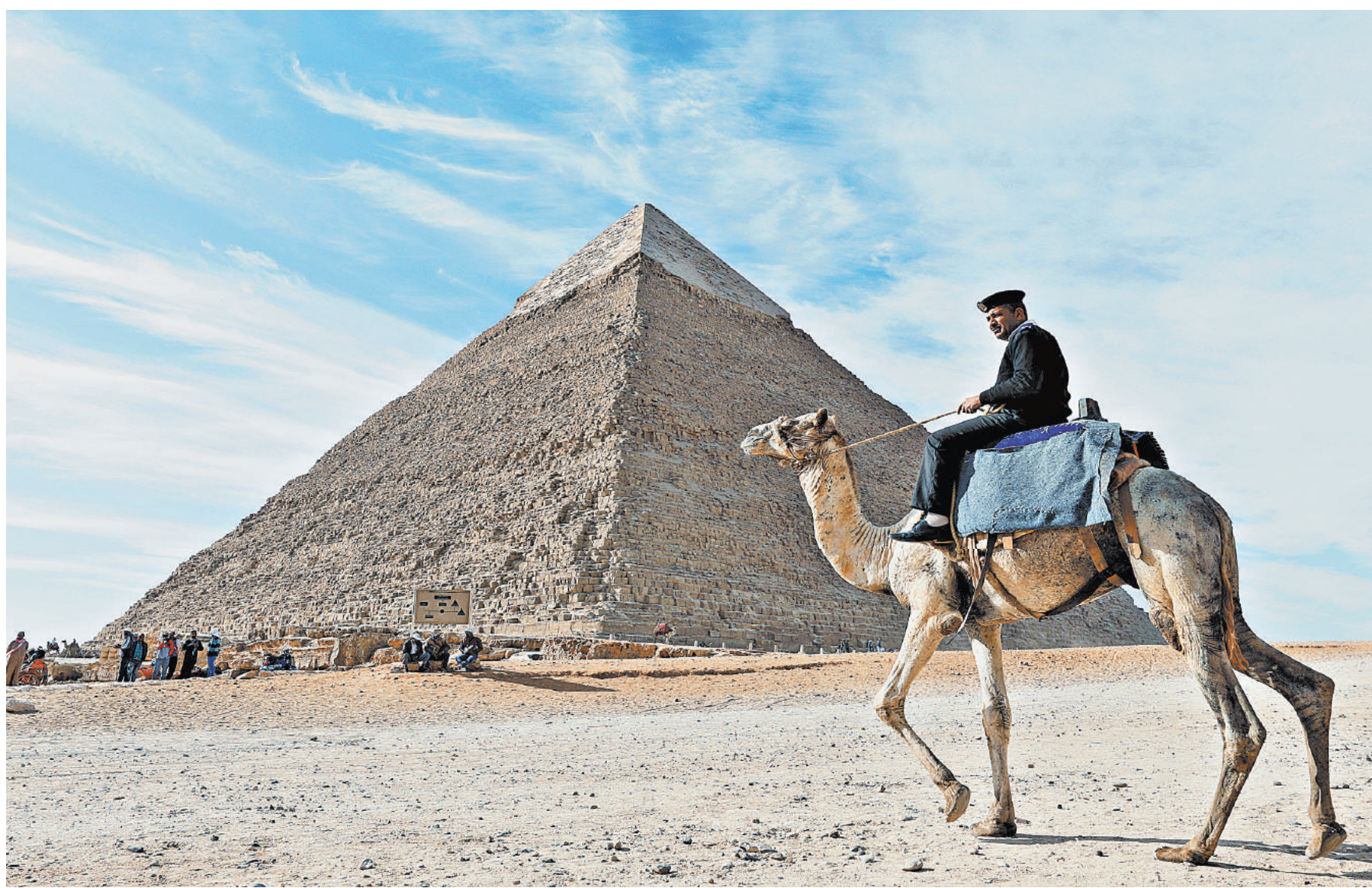
Туристы хотят море, но им пока предлагают пирамиды в пустыне.