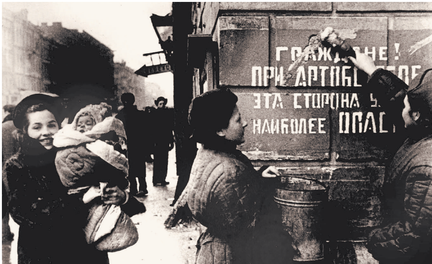
Пережитые испытания отразились не только на ленинградцах, но и на их потомках.