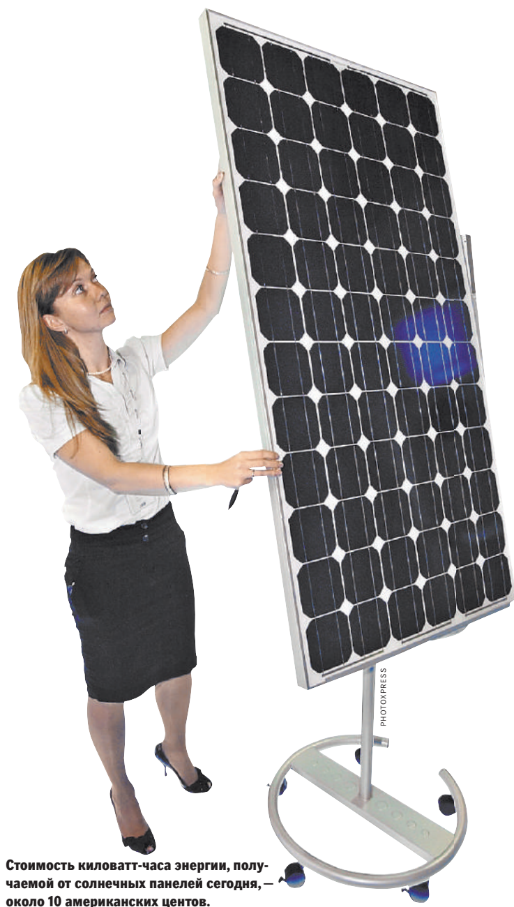
Стоимость киловатт-часа энергии, получаемой от солнечных панелей сегодня, — около 10 американских центов.