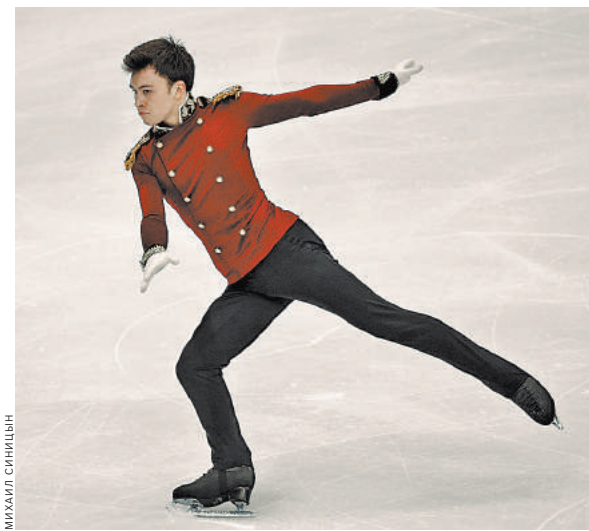
В короткой программе Дмитрий Алиев проиграл только действующему чемпиону Европы Хавьеру Фернандесу.