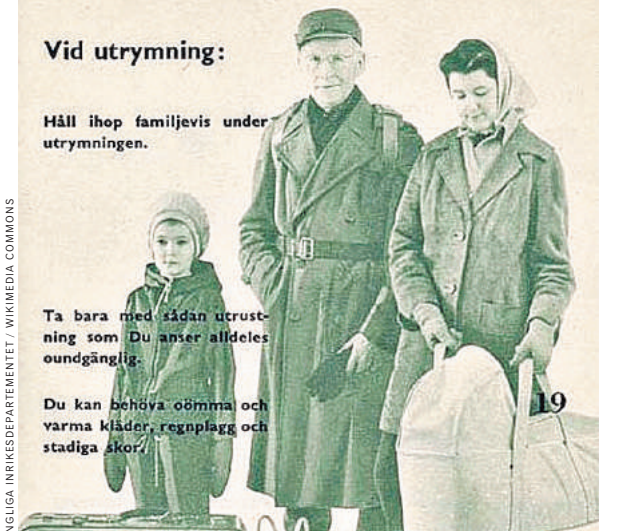
С 1943 года рекомендации шведам на случай войны не сильно изменились. Надпись на размеченной в брошюре фотографии советует семьям при эвакуации держаться вместе.

В марте 2017 года в соседствующей с Швецией Норвегии открылось второе высокотехнологичное хранилище для спасения знаний человечества на случай Апокалипсиса. Это хранилище назвали «Арктической всемирной архив». В отличие от шведских властей, рассматривающих, что изданные брошюры в условиях военного времени помогут спасти жителей королевства, в Норвегии, напротив, готовятся к наихудшему сценарию событий.