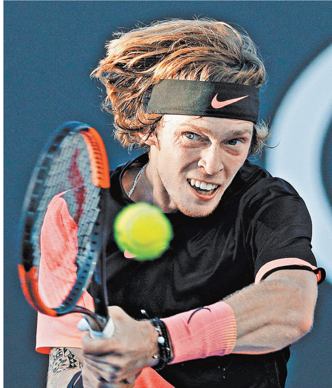
Андрей Рублев в пятый раз в карьере участвует в турнире «Большого шлема».

Две россиянки за свое место на Australian Open боролись не так отчаянно. Анастасия Павлюченкова всего за 1 час 14 минут проиграла украинке Катерине Дондаренко — 2:6, 3:6. Матч Дарьи Касаткиной получился бо-