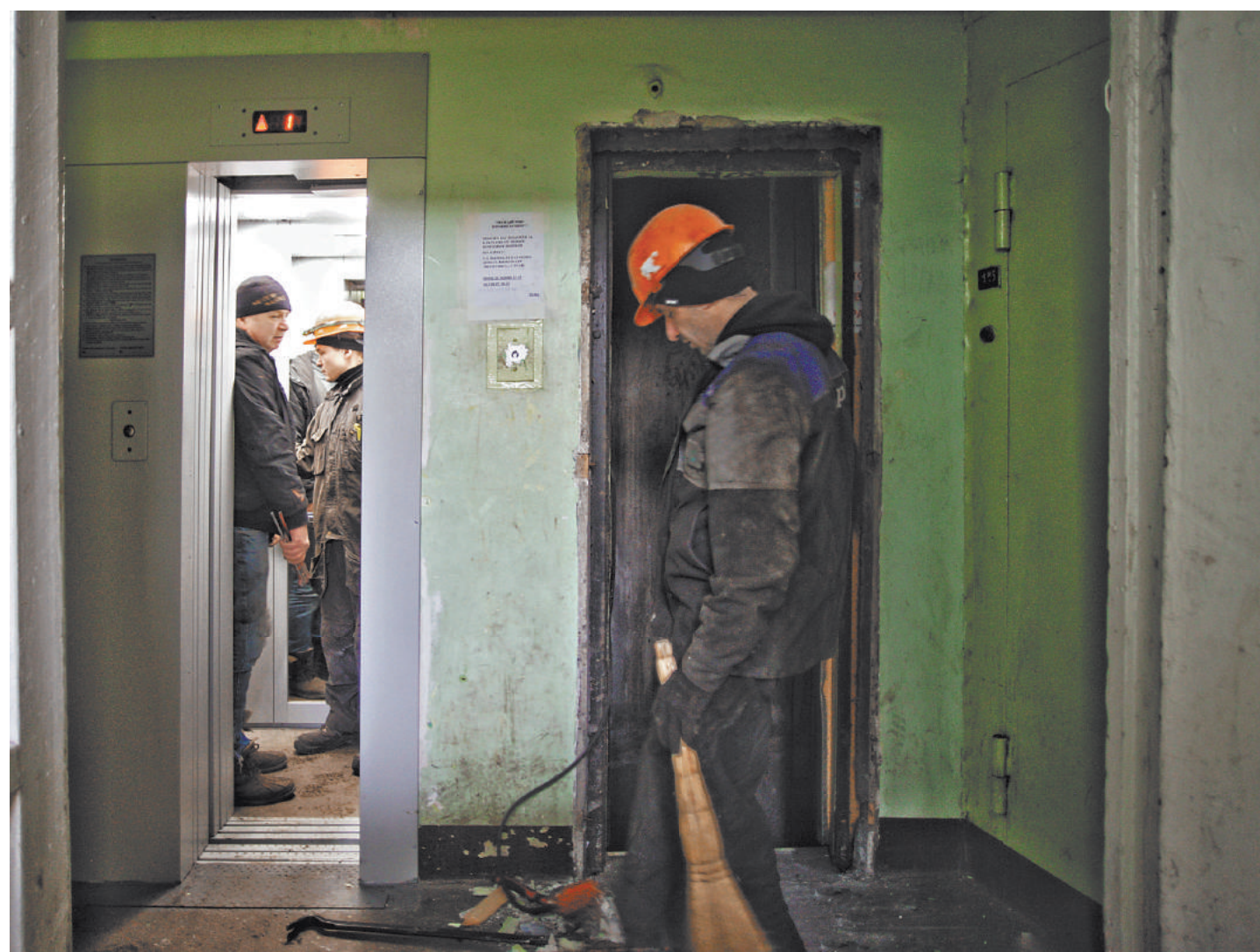
Мария Голубкова, «Российская газета», Санкт-Петербург

Выражение «застрял в лифте» обретает новый смысл. Такими комментариями в социальных сетях петербуржцы встретили информацию о новых лифтах, которые устанавливаются в многоквартирных домах по программе капремонта. Жители возмущены слишком узкими, по их мнению, кабинками подъемников и дверями, а чиновники разводят руками — «нормальные» у бюджета устанавливаются нет возможности.