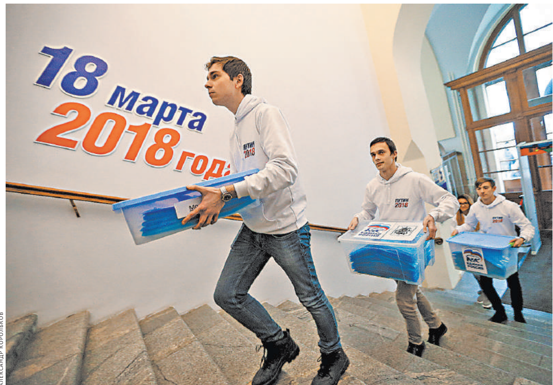
Молодые волонтеры несут в штаб подписные листы.

Подписные листы поступают в штаб в папках, на которых обозначены и регионы. Начали доставляться и те 200 тыс. подписей, которые граждане оставили в приемных «Единой России» 14 января. Напомним, что партийцы предоставили волонтерам площадку для удобства людей, желающих расписаться в пользу кандидата. В целом же на сегодня собрано 1 млн 139 тысяч во всех регионах, огласил статистику сопредседатель штаба, гендиректор «КамАЗа» Сергей Когогин. В центральный штаб поступили 472 тыс. «Полностью проверены 16 регионов. Отобраны 143 тысячи 81 лист и приготовлены для сдачи в Центризбирком», — доложил Когогин, отвечающий в