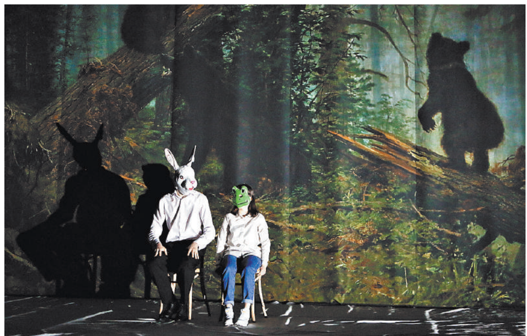
Утро в Вероне, как «Утро в сосновом бору»?