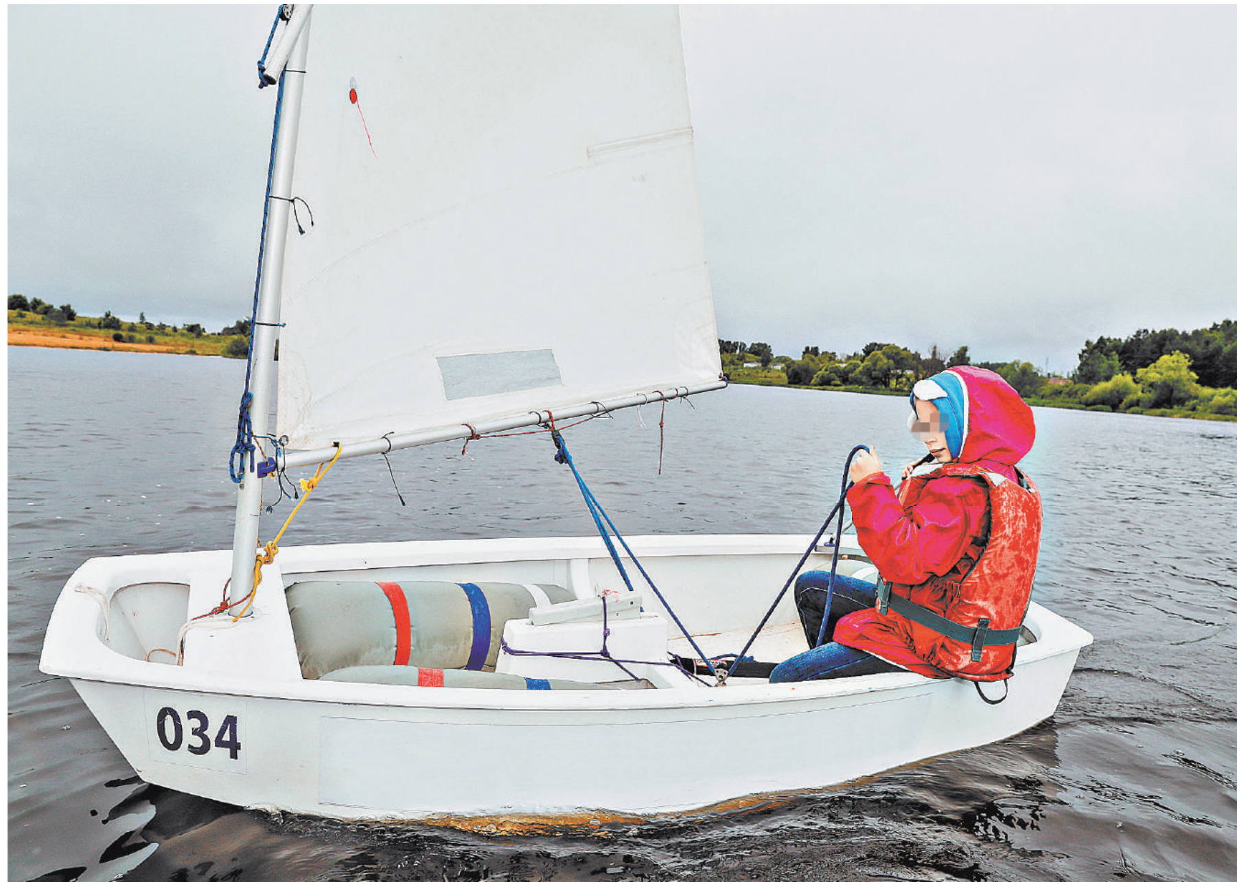
Руководители лагерей должны информировать МЧС о перемещениях детей, в том числе — по воде. Но часто не делают этого.

Пятая преступная халатность — во всех регионах исполняется поручение президента страны об информировании терорганов МЧС о маршрутах передвижения, проходящих по труднодоступной местности, водным, гор-