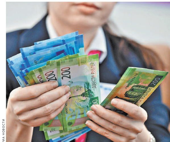
К новым деньгам в России еще не все привыкли. Но принимать их должны везде, предупреждает Роспотребнадзор.

А вот ветхими купюрами расплатиться не получится. ЦБ в свое время ввел единые правила для выбраковки купюр. По этим правилам ветхие купюры можно сдать в любой банк и получить в обмен новую купюру аналогичного номинала. Так, например, «вышедшими из строя» купюрами признаны те, на которых есть загрязнения, или те, что утратили красочный слой. При этом снижение яркости должно составлять 8 процентов и более. Также ветхими считаются деньги с разрывами по краям длиной в 7 миллиметров. Сдать в банк можно и дырявые купюры — с одним и более проколами в 4–5 миллиметров. Сотрудники ЦБ расписали даже площадь углов, при потере которых купюру можно менять, — 32 и более квадратных миллиметров. В утиль списываются и банкноты с надписями. Но слово должно содержать более 2 символов. Также ветхими считаются купюры с рисунками, штампами и контрастными пятнами. Кстати, те деньги, которые склеены скотчем, можно тоже сдать в банк и получить новые. Возможно заменить даже обожженные, обмученные, истлевшие и купюры, подвергшиеся действию различных химикатов. Главное — они должны сохранить не менее 55 процентов своей площади.