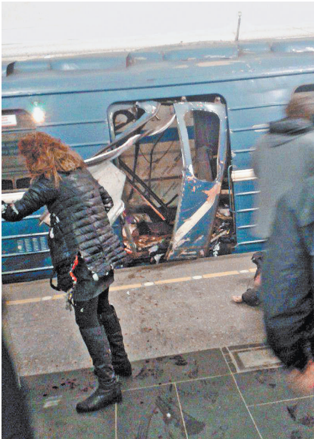
Взрыв прогремел в 14.40 на перегоне между станциями «Сенная площадь» и «Технологический институт».

Обнаруженная бомба была вмонтирована в корпус огнетушителя, лежащий в черной сумке, и также была начинена поражающими элементами.