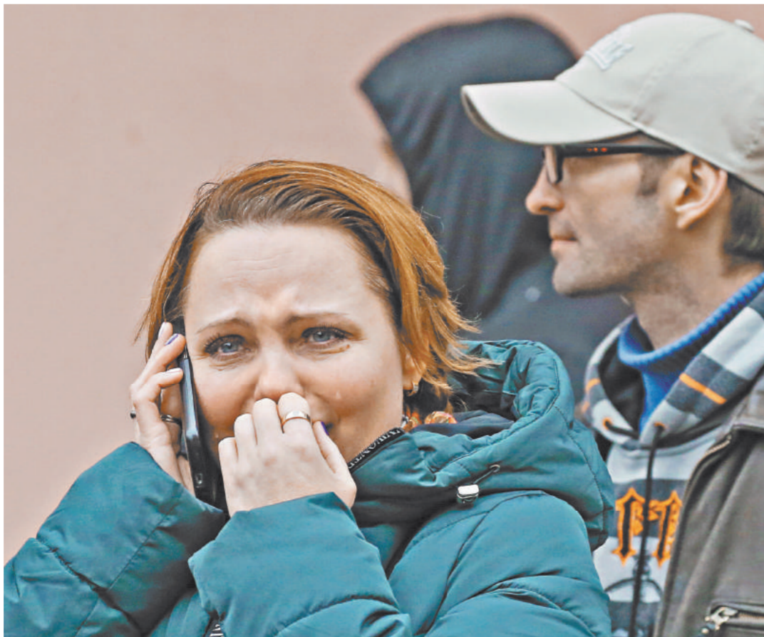
Очевидцы страшной трагедии не могли сдержать слез.

5 За кражу электричества предлагают сажать на 6 лет