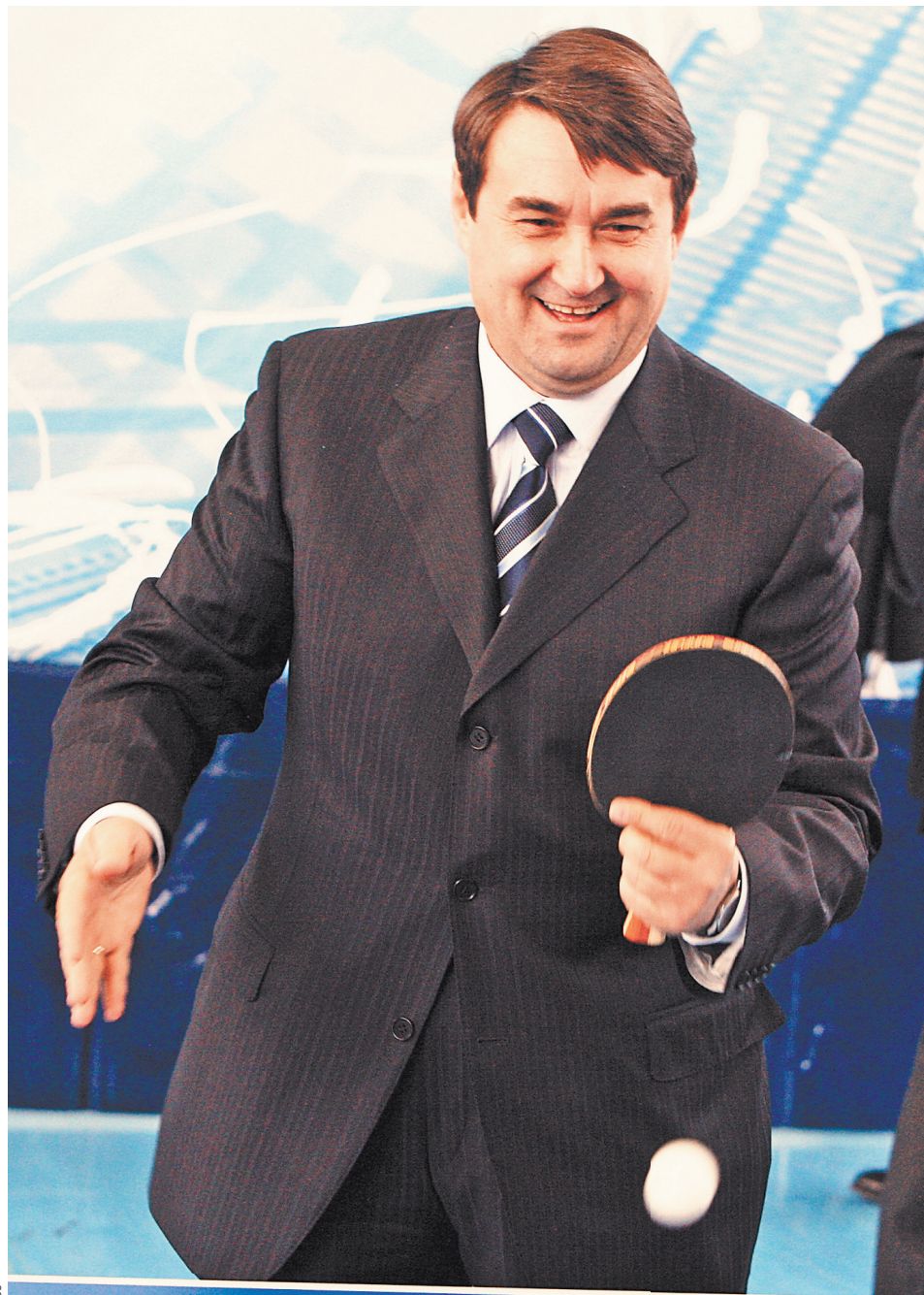
Игорь Левитин: Нужно менять правила в настольном теннисе, чтобы сделать его более зрелищным.

Но с развитием технологий, банковской системы возникают новые услуги. К примеру, перенос номера от одного оператора сотовой связи к другому (отмена «мобильного рабства»). Услуги по кредитам связаны с созданием института банкротства физлиц.