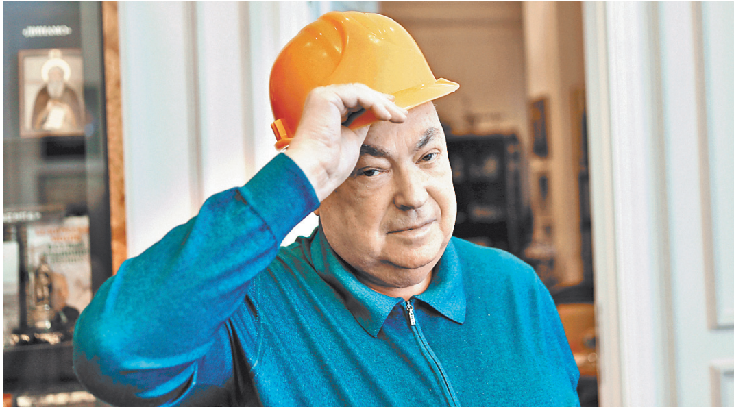
Владимир Ресин: Смелое решение: снос существующих станций метро. Настоящее очищение города.

Владимир Ресин: Мы проделали большую работу по подготовке территорий под строительство.