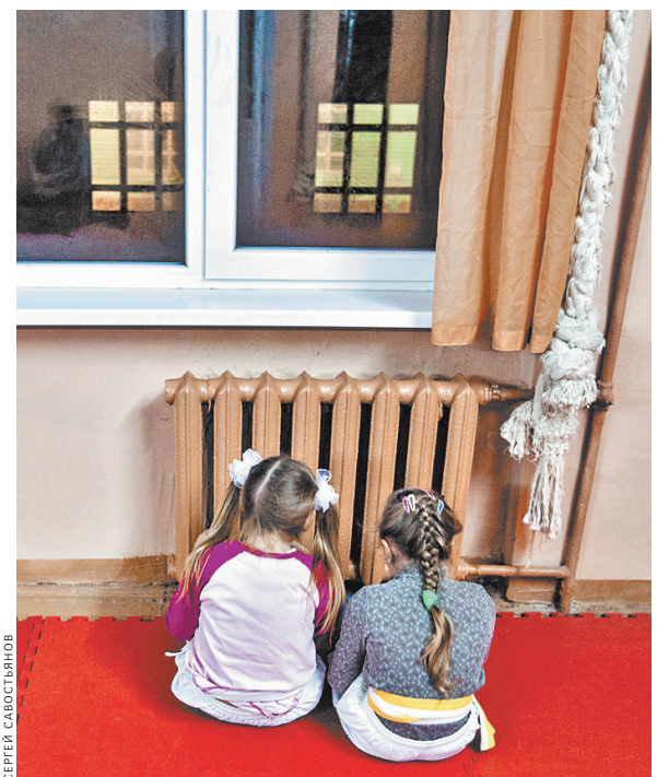
Предсказать ежемесячные траты на отопление невозможно — никто не знает, насколько холодной будет зима.

Как сэкономить на услугах ЖКХ rg.ru/sujet/1580