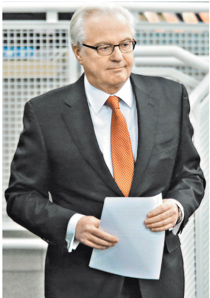
Виталий Иванович Чуркин был настоящим государственным и патриотом.