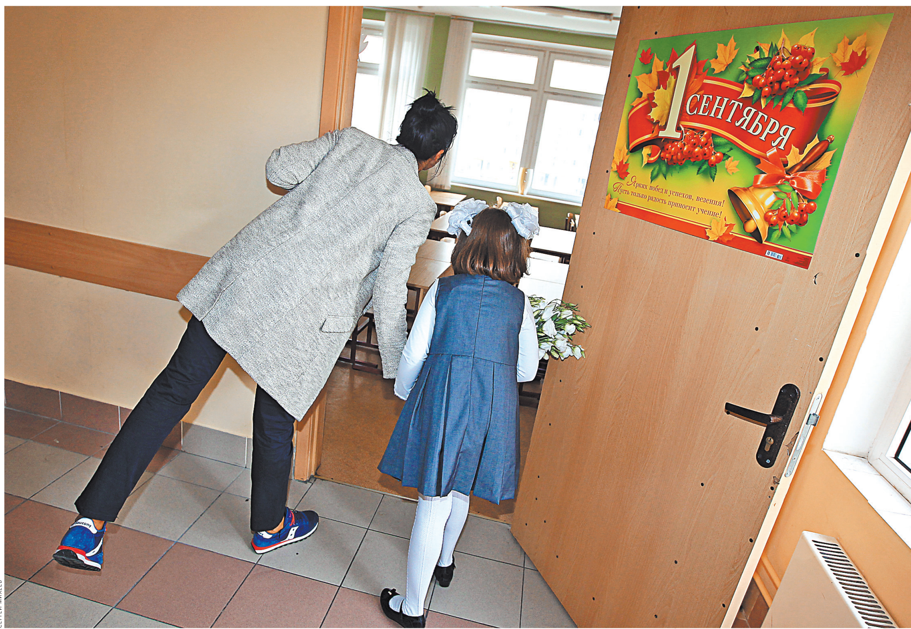
«Входной билет» в хорошую школу — от 3 тысяч рублей. Именно столько может стоить временная регистрация в нужном месте.

1 Родители имеют материальные возможности для дообразования и готовы платить за услуги.