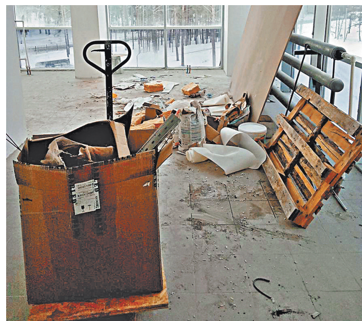
Объект сдан, но стройка продолжается.

Между тем заместитель председателя правительства Алтайского края Надежда Капура сообщила, что операционный блок и реанимационное отделение для женщин открылось 28 февраля, палаты интенсивной терапии и три