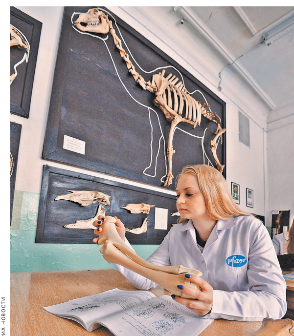
Хватит ли 70 тысяч рублей в год, чтобы стать хорошим врачом?

У вузов культуры другая специфика, там на одного преподавателя приходится очень мало студентов. Норматив рассчитывается 1 к 4 или к 6. В итоге студент московского театрального училища или консерватории может «стоять» и 300, и 400 тысяч рублей в год. Кажется много? Но это индивидуальная, штучная работа с каждым студентом в отдельности и ненормированный рабочий день для преподавателя. К слову, мало кто из педагогов вузов культуры работает на полную ставку — слишком сложно. По данным Комитета Госдумы по культуре, вузам не хватает около 1,7 млрд рублей на содержание помещений и коммунальные платежи.