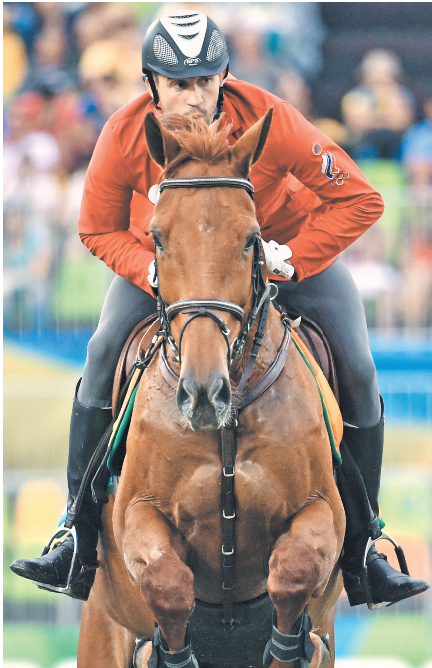
Александр Лесун: Скромно скажу: так и есть.

Александр Лесун родился 1 июля 1988 года в белорусском городе Бресте. За сборную Белоруссии выступал до 2008 года, после чего переехал в Россию. В 2010 году выиграл серебряную медаль на чемпионате мира. В следующем году российский пятиборец повторил этот результат, а в мае 2012-го впервые стал чемпионом мира. Второй титул лучшего пятиборца планеты завоевал в Варшаве через два года. На Олимпиаде в Рио-де-Жанейро Александр установил олимпийский рекорд в фехтовании и занял первое место в общем зачете. По итогам 2016 года был признан лучшим спортсменом года по версии Министерства спорта РФ.