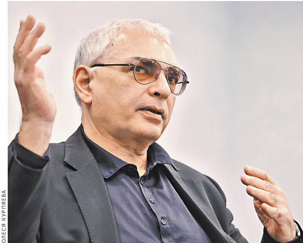
Карен Шахназаров: Появление нового комплекса для реквизита — это вопрос сохранности «мосфильмовских» ценностей.

Все, что произойдет с «Мосфильмом» в ближайшие пять лет, — по сути, крупнейшее расширение киностудии за все постсоветский период. «Мы не скрываем, что с нетерпением ждем начала строительных работ, — резюмирует Карен Шахназаров. — Потому что если все то, что задуmano, будет осуществлено в полной мере, студия ждет качественного рывка вперед. Хочется, конечно, чтобы все осуществилось как можно быстрее, но пока мы ориентируемся на 2020–2021 годы».