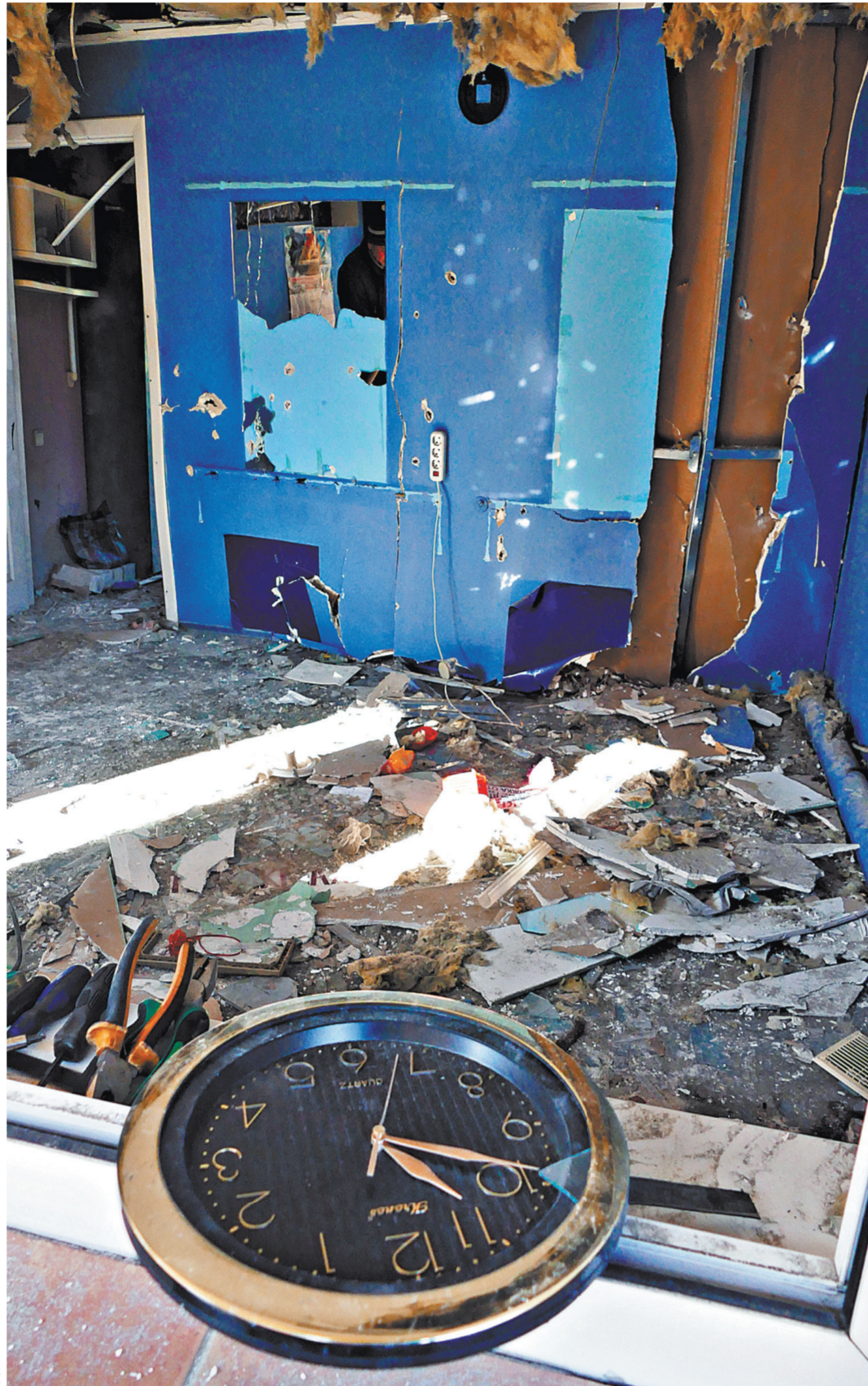
Так выглядит попавшая под обстрел парикмахерская на привокзальном рынке Куйбышевского района Донецка.

Завод принадлежит компании «Метинвест», управляющей металлургическими активами олигарха Рината Ахметова. АКХЗ — крупнейшее в Европе предприятие такого профиля, без продукции которого — кокса невозможна работа металлургических комбинатов в Мариуполе, Запорожье и Енакиеве, также входящих в структуру «Метинвест». Ключом для понимания происходящего следует считать тот факт, что ранее за время «антитеррористической операции» на территории АКХЗ не попали ни один снаряд. Но в минувшее воскресенье именно здесь начались бои не бывалой интенсивности. В результате прицельного огня вооруженных сил Украины (ВСУ) были повреждены идущие с территории Донецкой