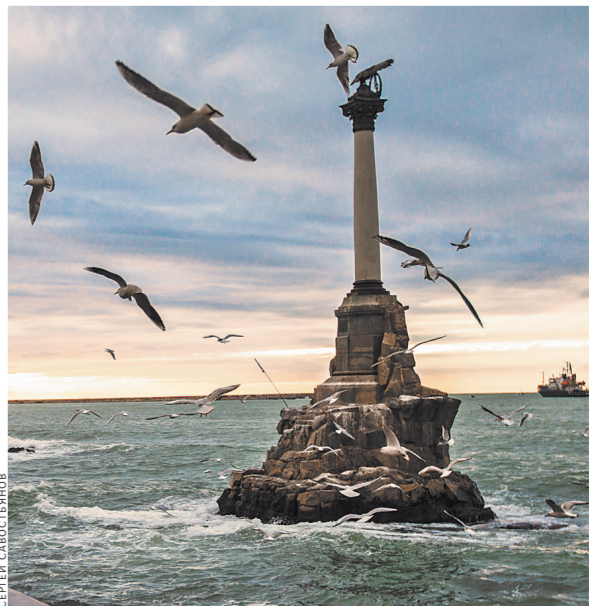
Памятник затопленным кораблям в Севастополе мы увидим на купюре в 2000 рублей.

Теперь специалисты «Гознака» при участии Банка России готовят эскизы купюр. Здесь уже никакой демократии не будет — проекты банкнот будут храниться в тайне вплоть до утверждения советом директоров ЦБ. Дата их презентации пока неизвестна, сообщил «Российской газете» представитель Банка России.