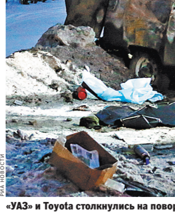
«УАЗ» и Toyota столкнулись на повороте с Варшавского шоссе на деревню Коротыгино.

Спасатели потушили машину, загоревшуюся во время ДТП, сообщили в пресс-службе ГУ МЧС по Москве. Горение было быстро ликвидировано. Спасатели деблокировали одного из пострадавших, поскольку самостоятельно он не