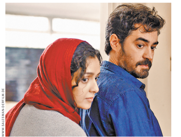
Постоянная тема Фархади — семейный разлад, ржавчина, которая разъедает отношения между людьми.

Итак, в открывающей сцене «Коммивояжера» мы видим как дом, в котором живут главные герои — актриса Рана и режиссер Эмад — из-за строительных работ по соседству покрывается трещинами. Супруги, все время за-