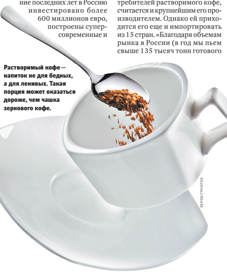
Растворимый кофе — напиток не для бедных, а для ленивых. Такая порция может оказаться дороже, чем чашка зернового кофе.

Узнайте на сайте: Как правильно питаться в течение дня rg.ru/art/1138268