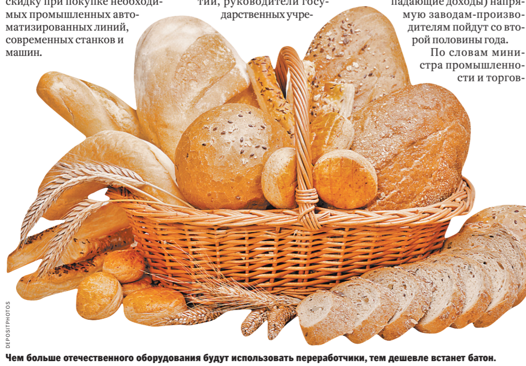
Чем больше отечественного оборудования будут использовать переработчики, тем дешевле станет батон.

Читайте также: Росстат подсчитал стоимость продуктов в регионах РФ rg.ru/art/1360766