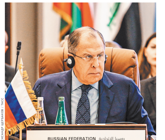
Сергей Лавров поблагодарил арабских коллег за поддержку инициативы Москвы в сфере противодействия терроризму.

Форум показал, что Россия является важным партнером для арабского мира