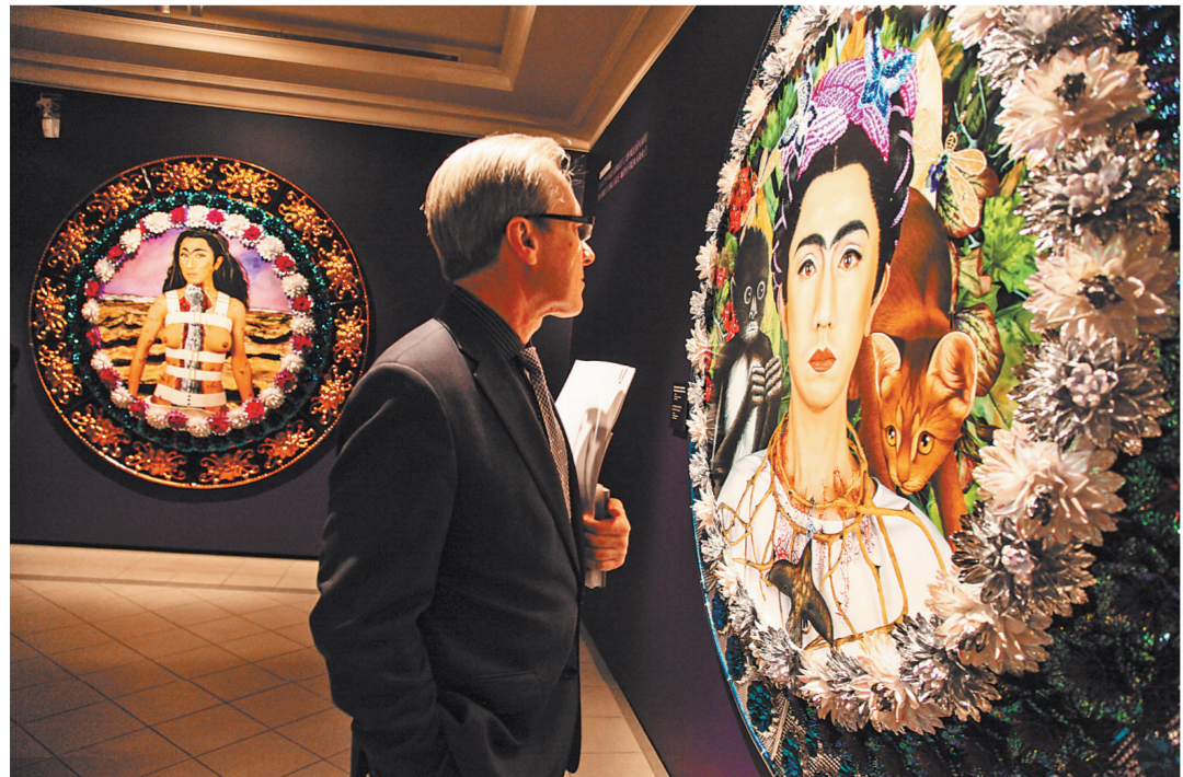
Ясумаса Моримура — эквилибрист, тонко балансирующий на границе между Востоком и Западом.

— Поскольку японцы живут в Японии, естественно японская культура оказывает на меня влияние. Однако из всей японской культуры я ощущаю наиболее сильное влияние на свое творчество со стороны анимизма. Не путайте его с анимацией. Анимизм — это одушевление всего сущего. По моим ощущениям, дух анимизма по-прежнему жив в Японии. В последнее время чувствую, что они мне интересны. Во мне живет множество «Я». Все эти «Я» я хочу вытаскивать из себя и представлять в своих произведениях.