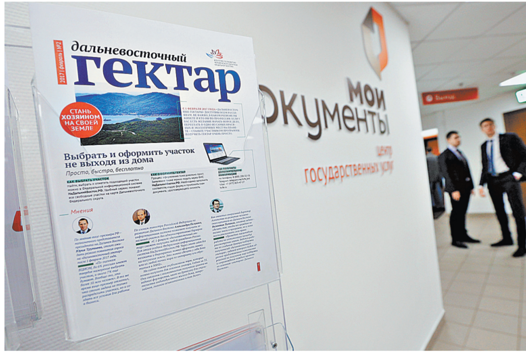
Интересуются гектаром в основном люди 25–40 лет, то есть самая активная часть населения.

Акцент Активнее всего гектарами интересуются сами жители Дальнего Востока и москвичи