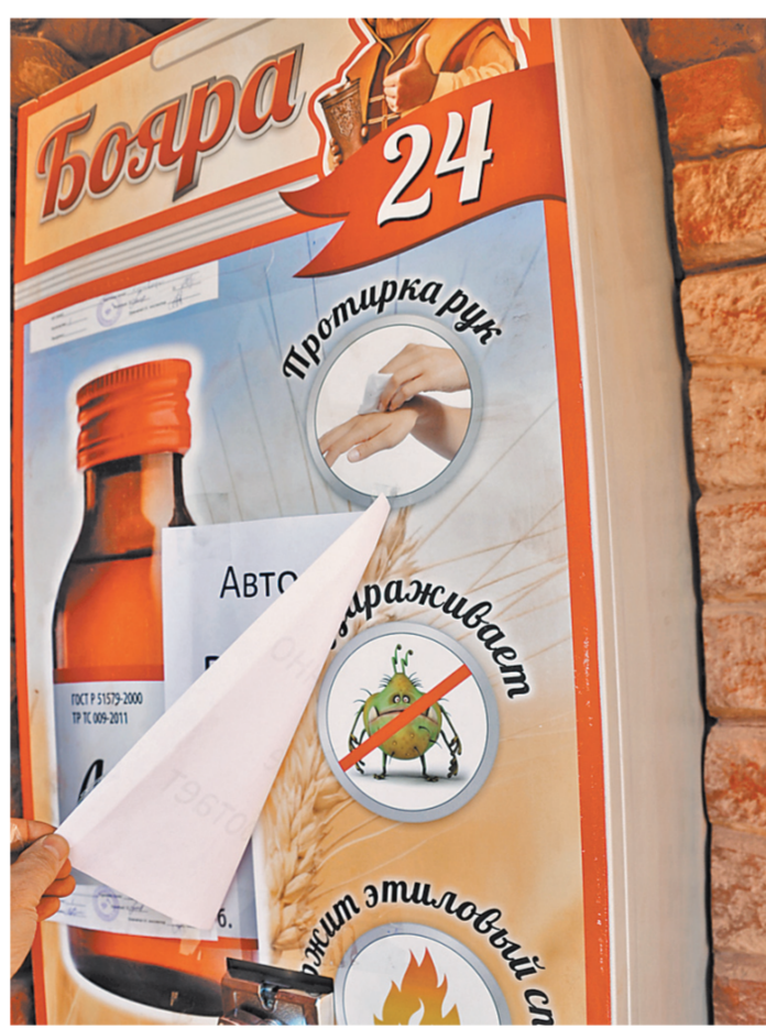
Под видом целебной настойки боярышника бутлегеры продавали концентрат для ванн.

Напомним, в декабре в Иркутске более 200 человек пострадали, из них выше 70 погибли после употребления средства для ванн «Боярышник». Выяснилось, что «Боярышник» производили купстарским способом и вместо этилового спирта в нее добавляли метанол. Было обнаружено несколько подпольных цехов. Расследования дела передано в Центральный аппарат СКР. Продолжается и оперативная работа силами сотрудников полиции.