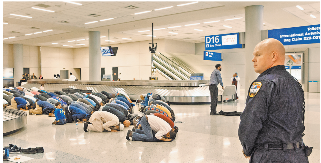
Пассажиры, которым отказали во въезде в США, устроили намаз в знак протеста в аэропорту Далласа.

В среду стало известно, что одна из крупных букмекерских контор Британии стала принимать ставки на отставку Трампа в течение года — в результате импичмента или по собственному желанию. Впрочем, пока неизвестно, что новый президент США предпринимал шаги для снижения градуса противостояния в обществе или шел на уступки. Напротив, Трамп принял вызванный ему оппонентами бой.