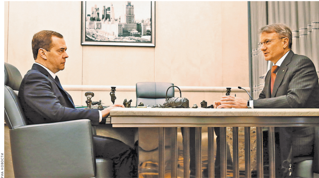
Премьер в беседе с Германом Грефом оценил работу банка с предпринимателями в регионах.

Вчера председатель правительства провел рабочую встречу с главой Сбербанка Германом Грефом, на которой шла речь о том, как кредитная организация работает с предпринимателями в регионах. Так, в прошлом году банк запустил ряд новых продуктов и сервисов для малого бизнеса. Совместно с Google в Татарстане стартовал проект по обучению предпринимателей новым технологиям. Эксперимент был признан очень удачным — в программе приняли участие около 15 тысяч малых предпринимателей. «Мы обкатали эту программу в Татарстане и договорились, что в этом году мы ее распространим», — сообщил Греф. — Мы думали на 11 регионов, но Игорь Иванович Шувалов (первый ви-