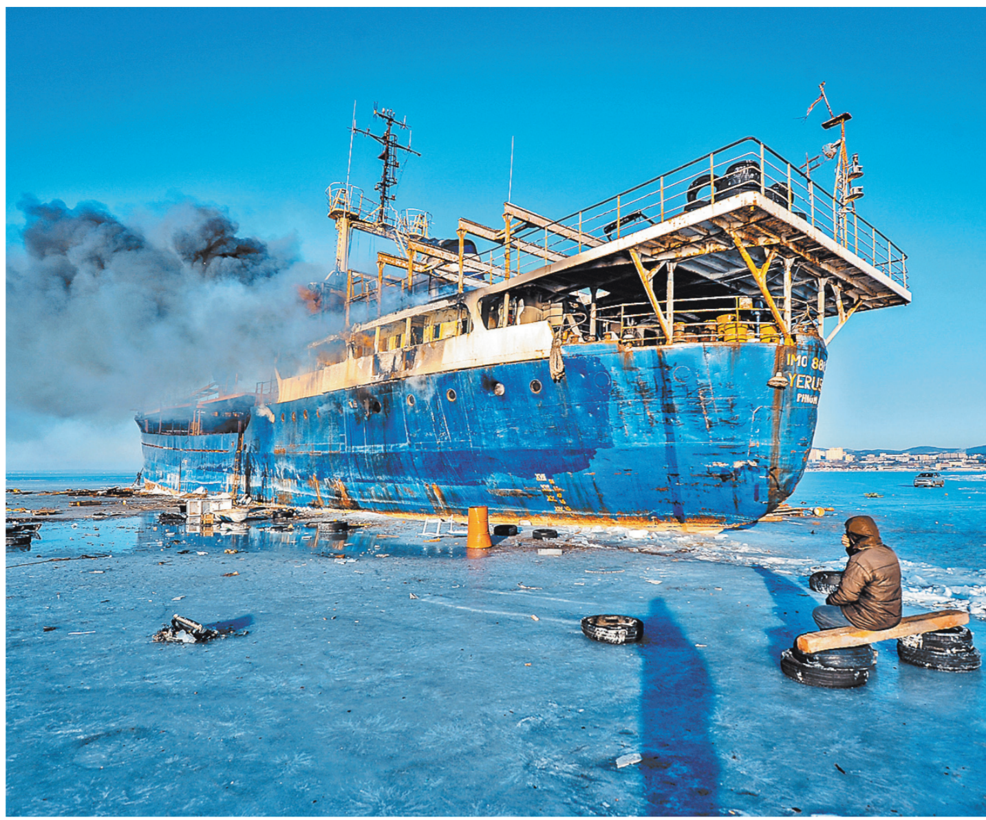
В последний день января в акватории Амурского залива во Владивостоке загорелось затопленное льдами судно Yeruslan. Как выяснилось, ранее оно не раз арестовывалось за долги перед моряками, и в конце концов хозяева его попросту бросили. По сообщениям очевидцев, на корабле выгорела судовая надстройка, а дымится он перестал лишь вчера вечером.

«Встречают нас очень тепло», — рассказали «РГ» в «Мособлкино», организующем эту акцию. — Особенно радуются дети, которые никогда не видели мультфильмов на большом экране — для них это настоящее волшебство. Бывало, после показа дети бежали за нашей машиной и кричали вслед: «Приезжайте еще!». Это очень трогательно и приятно».