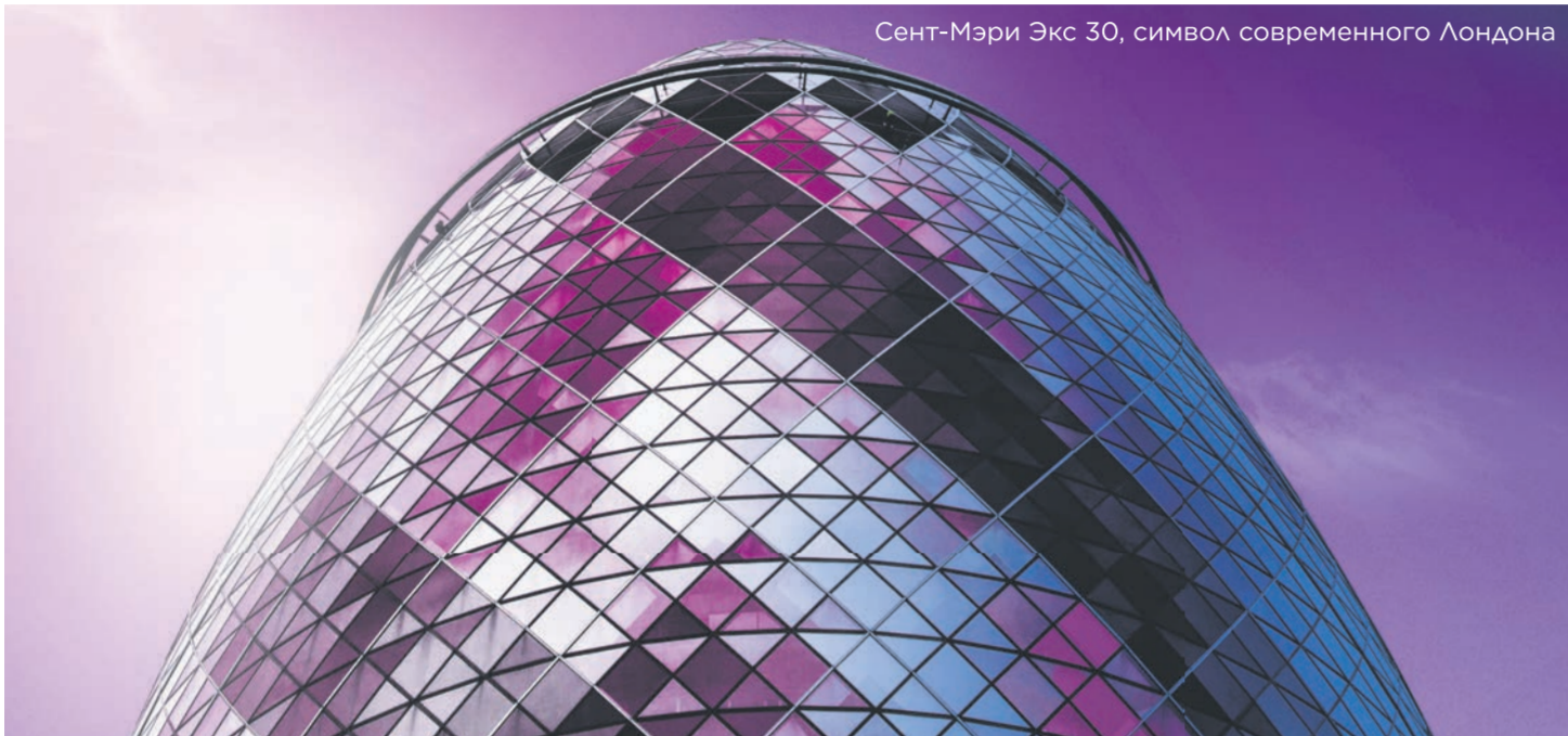
Сент-Мэри Экс 30, символ современного Лондона