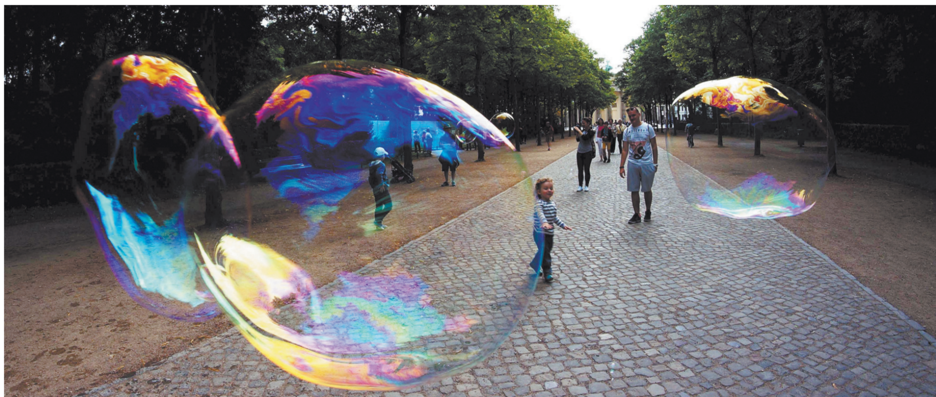
Здесь надувают только пузыри.