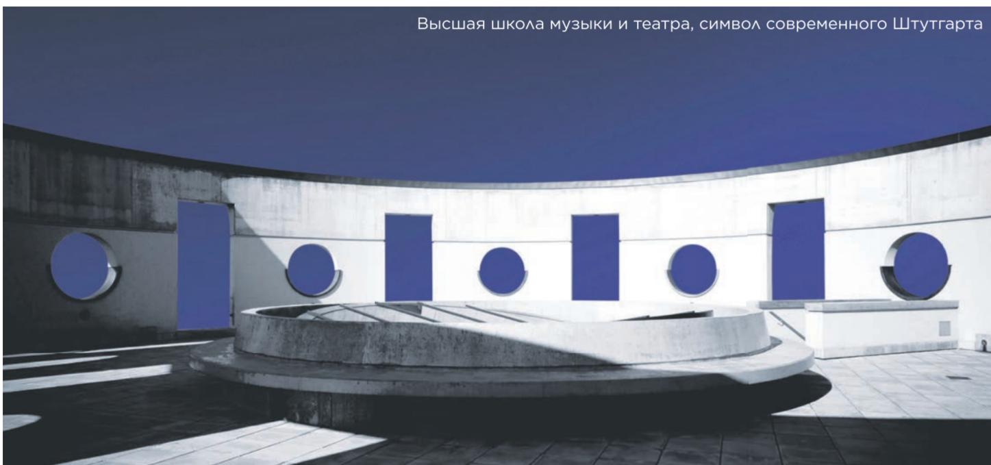
Высшая школа музыки и театра, символ современного Штутгарта