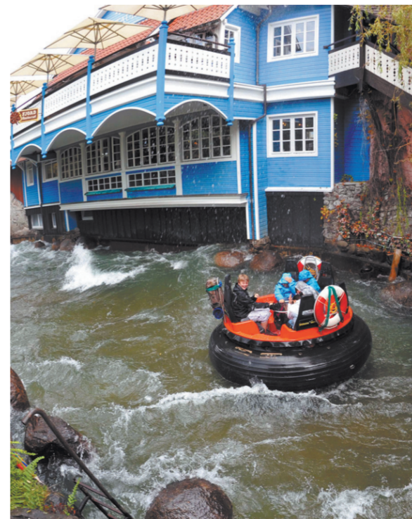
Реальный рафтинг на искусственной реке.