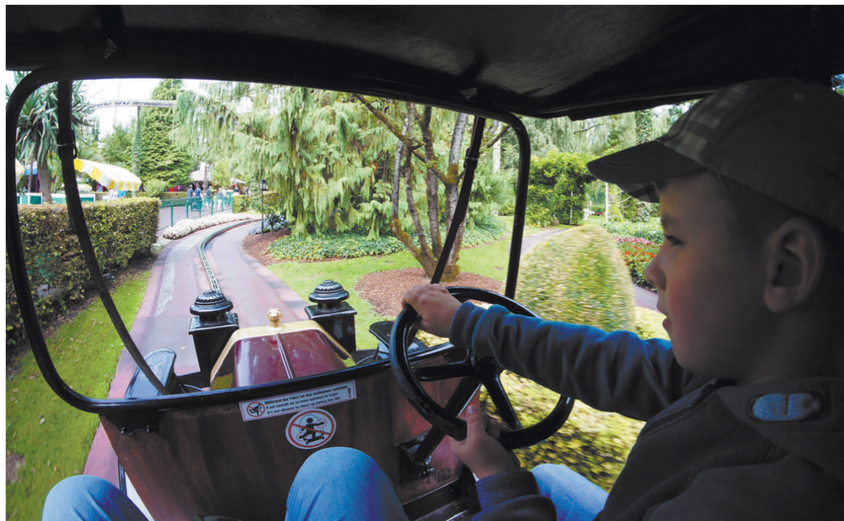
Тут дети возят взрослых.