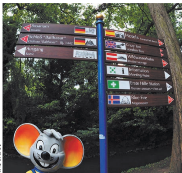
Талисман парка — мышонок Эд.