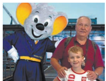
Это были три дяди радости.

Тут мы с ним совпали. И мы с Юркой тоже любим поезда. И не только игрушечные.