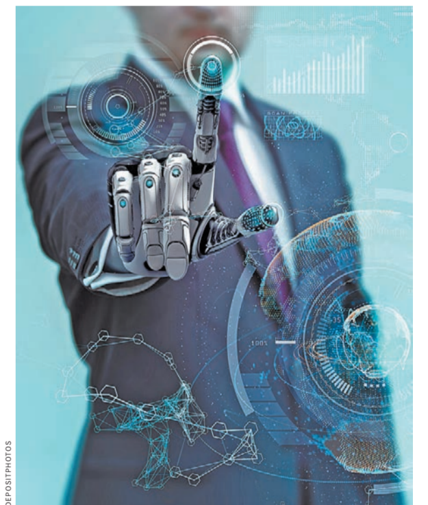
В любой программе исследований все должно быть понятно и прозрачно: и науке, и бизнесу, и обществу.

При проведении конкурсов мы ориентируемся на Стратегию научно-технологического развития России. Там есть семь приоритетных направлений, и все наши конкурсы заточены на эти приоритеты. И в новой госпрограмме записано, что точно по такой же схеме должны осуществляться все исследования и разработки в стране. Они должны вестись по единым универсальным правилам.