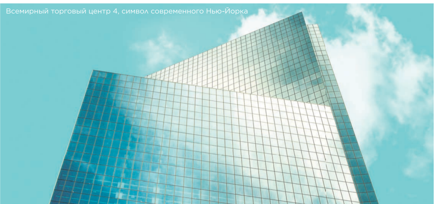
Всемирный торговый центр 4, символ современного Нью-Йорка