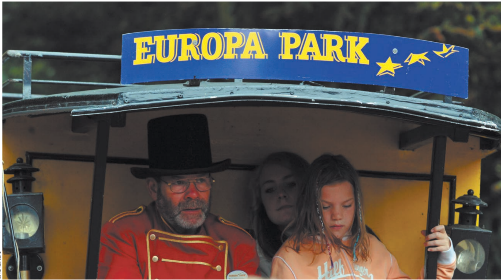
Настоящий парк начинается с конного экипажа.