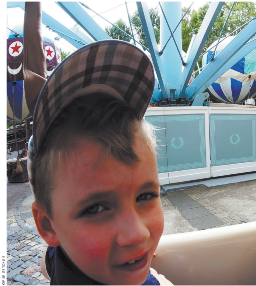
Мальчишке тут есть чем заняться. Впрочем, девчонке — тоже.