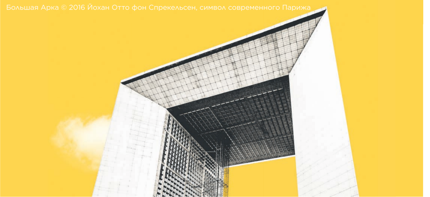
Большая Арка © 2016 Йохан Отто фон Спрекельсен, символ современного Парижа