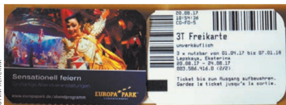
Билет на аттракционы.