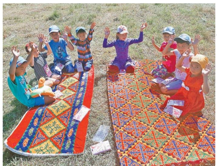
Прямо в юртах и рядом с ними открываются творческие мастерские, где проходят развивающие занятия для малышей.

За что вузы получают корректирующие коэффициенты?