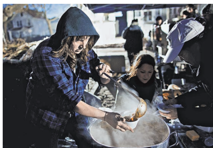
В США сегодня волонтерами трудятся почти 63 миллиона человек, или более четверти населения страны.

Согласно статистике, которую ведет правительственная корпорация национальных и общественных услуг, созданная в начале 1990-х годов для координации волонтерской деятельности в США, женщины чаще идут выполнять социальную значимую работу, чем мужчины.