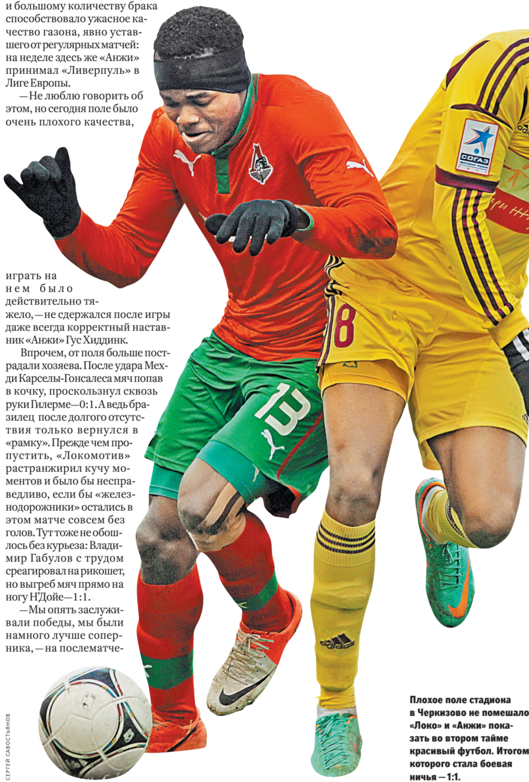
Плохое поле стадиона в Черкизово не помешало «Локо» и «Анжи» показать во втором тайме красивый футбол. Итогом которого стала боевая ничья — 1:1.

«Локомотив» растранижил кучу моментов, а вот «Анжи», чтобы открыть счет, хватило всего одного удара