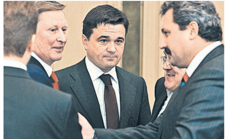
Руководитель администрации президента Сергей Иванов представил нового главу Подмосковья Андрея Воробьева членам регионального правительства.

В первый же день работы и. о. губернатора Московской области Андрей Воробьев (напомню, указ президента РФ о его назначении появился утром 9 ноября) встретился с представителями областного правительства и главами муниципальных образований. Все, что хотел услышать кабинет министров, менее полугода назад сформированный экс-губернатором Сергеем Шойгу, прозвучало в первые минуты встречи: