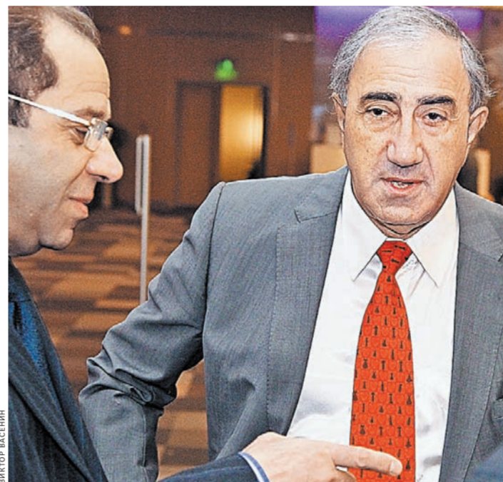
Участники форума и хирурги в операционной сообщают об оптимальном пути спасения пациентов.

Казалось бы, ради форума и большей наглядности можно было чуть смягчить требования и как-то отобрать более простые и, если угодно, более эффективные случаи. Ан нет! Была свидетелем, когда хирурги не смогли осуществить задуманное, и общий консилиум решил отказаться от радикального решения, определил иную тактику спасения больного.