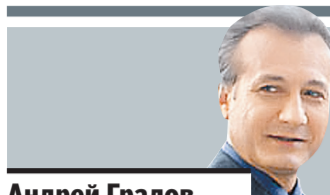
Андрей Градов, заслуженный артист России

АВТОМОБИЛЬ постепенно вытесняет человека из городской среды, поскольку изначально города, особенно старые, не были спланированы на такое количество машин. Во избежание этих проблем надо строить многоуровневые дороги, как во многих мегаполисах мира. Но в целом то, что происходит на российских дорогах сейчас, это отвратительно. Культуру вождения в наших городах я бы оценил на три минуса по пятибалльной системе. Надо сказать, что лично я активно пользуюсь автомобилем. Ездить по нашим дорогам, не нарушая никаких правил, в принципе можно, но любой владелец авто скажет, что это проблематично. Во-первых, движение у нас совершенно не организовано. Во-вторых, дороги оставляют желать лучшего, развязки плохие. Сейчас потихоньку все это приводит в порядок, но пока что очень тяжело.