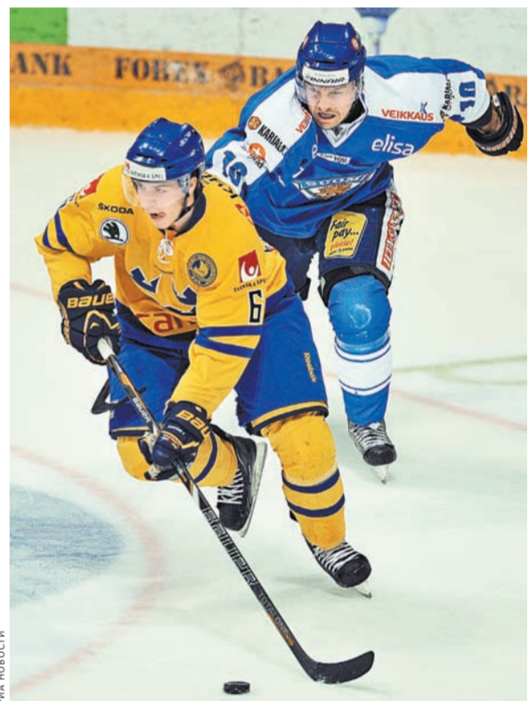
Матчи Евротура уже давно стали для ведущих сборных площадкой для просмотра будущего резерва.

Билялетдинов сказал, что к вратарям Константиному Барулину, отыгравшему с финнами и чехами, и Сергею Бобровскому, дебютировавшему за сборную во встрече со Швецией, у него претензий нет.