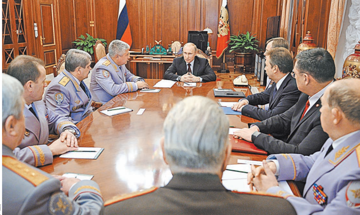
Поздравляя руководство полиции с праздником, президент признал, что без структуры, подобной МВД, ни одно государство существовать не может.

Глава МВД Владимир Колокольцев поблагодарил от имени коллег руководство страны за внимание и поддержку. Создана необходимая нормативно-правовая база, повышена социальная защищенность, улучшено материально-техническое снаб-