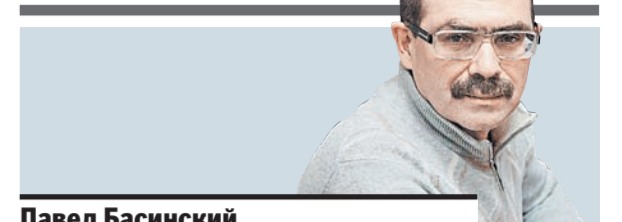
Павел Басинский писатель