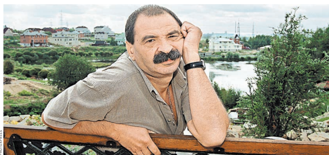
Он был частью чего-то, что без него не может существовать.