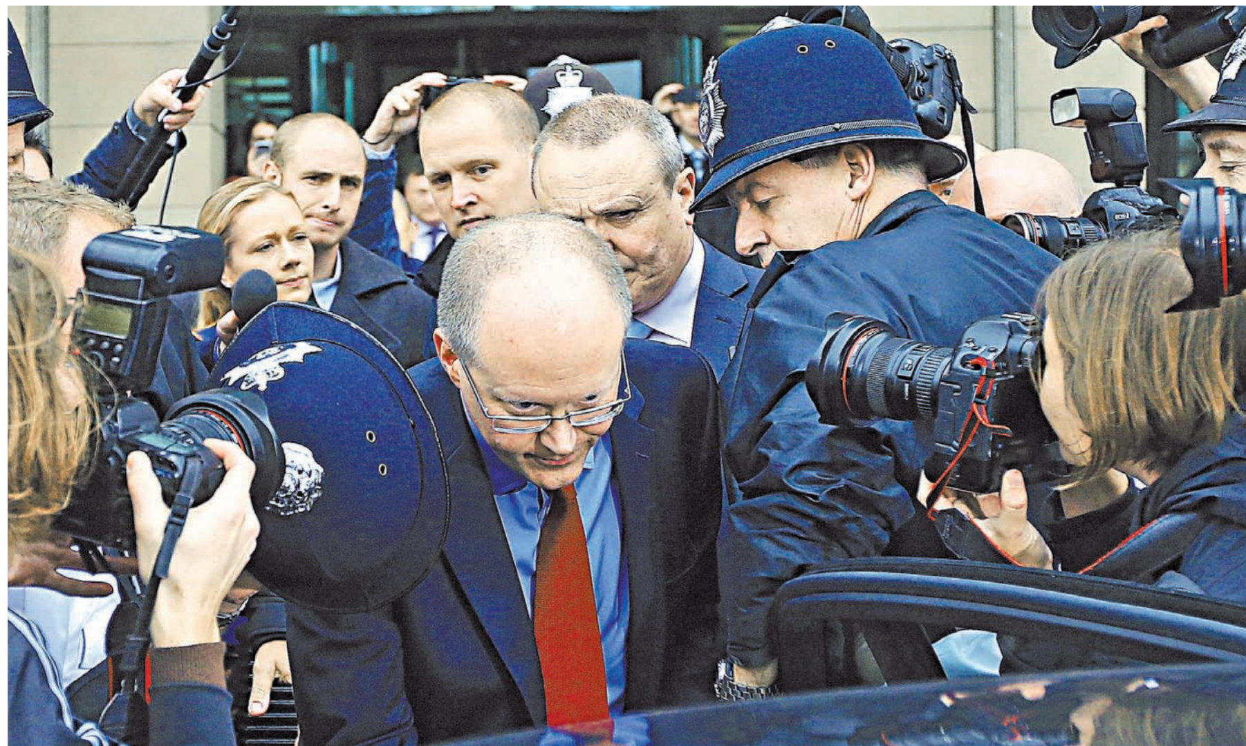
Генеральный директор Би-би-си Джордж Энтвисл уволился из-за непрофессионализма собственных сотрудников.