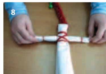
8 Просунуть маленькую скатку в большую и крестообразно перевязать руки и талию.