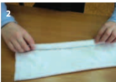
2 Большой прямоугольник белой х/б ткани (30x45) скатать трубочкой по широкой стороне.