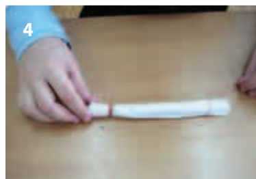
4 Меньший прямоугольник ткани (15x25) тоже скрутить. Это будут руки. Оформить ладошки.