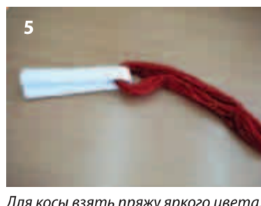
5 Для косы взять пряжу яркого цвета. Внутри большой скрутки просунуть заготовку для косы.