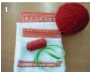
1 Делаем куклу сами.

Выдержки из книги «Уроки народной культуры».