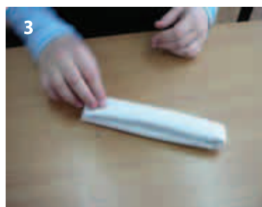
3 Скрутку сложить пополам и пока отложить. Это будет туловище.