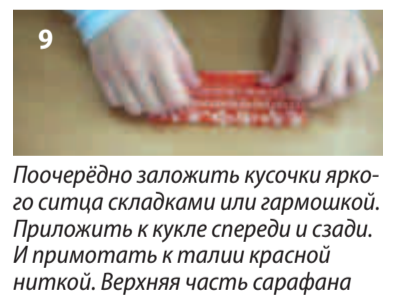
9 Поочерёдно заложить кусочки яркого ситца складками или гармошкой. Приложить к кукле спереди и сзади. И примотать к талии красной ниткой. Верхняя часть сарафана должна веером подниматься вверх и прикрывать грудь.