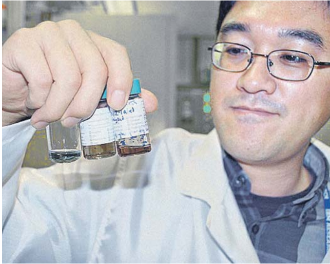
Исследователь IBM рассматривает растворы нанотрубок

Американские ученые создали чип на углеродных нанотрубках