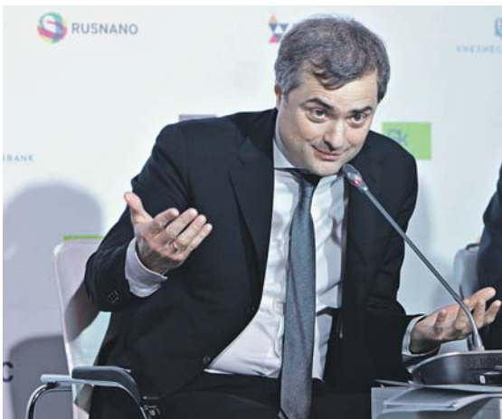
Владислав Сурков считает, что в России еще есть чем поживиться инвесторам

«Наша задача состоит в том, чтобы инноваторы в дальнейшем освоили научно-исследовательский цикл, могли «приземлиться» в Москве и дальше развивать свое реальное производство», — пояснил премьер чиновник. «В какой же части предлагается «приземлиться» инноваторов?» — не удержался от вопроса Дмитрий Медведев. «Мы с «Роснано» работаем в технопарке «Москва», к нам «приземлились» первые компании, которые используются в авиации, автомобильной промышленности