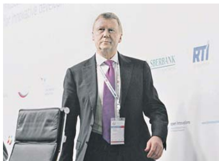
Анатолий Чубайс уверен, что «зеленые» технологии без нанотехнологий не обойдутся

Основатель Virgin Ричард Брэнсон и «Роснано» создали фонд, инвестирующий в экологичные технологии