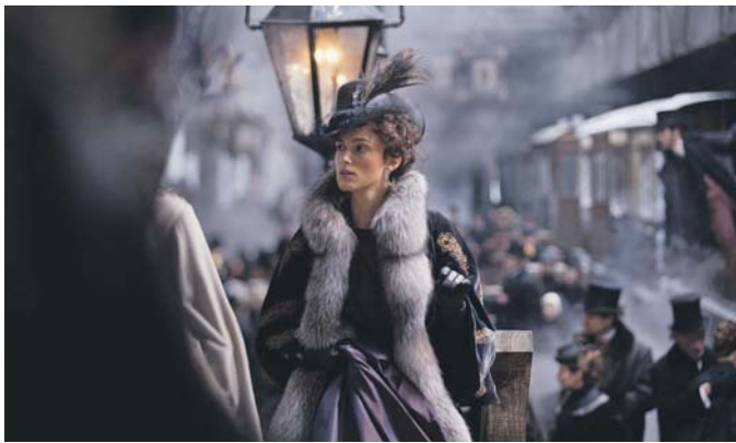
Фестиваль откроет новая экранизация «Анны Карениной» с Кириой Найтли в главной роли