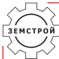
График: 5/2, 2/2 . ЗП: от 60 000 руб. Оформление в соответствии с ТК РФ Телефон для связи: +7 (911) 239 09 79 Адрес: наб. Обводного канала, д. 118 в шаговой доступности от ст. метро «Балтийская» (Балтийский вокзал)