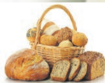
График работы: 5/2, 2/2. Достойная оплата труда, без задержек, 2 раза в месяц, премии по итогам работы. Всеволожский район, п. Щеглово, дом 1а.