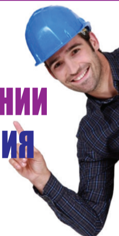
График работы: 2/2