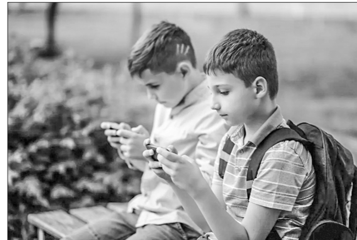
... и детство в гаджете.

Буржуазные СМИ продолжают писать о «дефиците» детских игрушек в СССР. Но каждый советский ребёнок мог бы рассказать трогательную историю о любимой игрушке. На