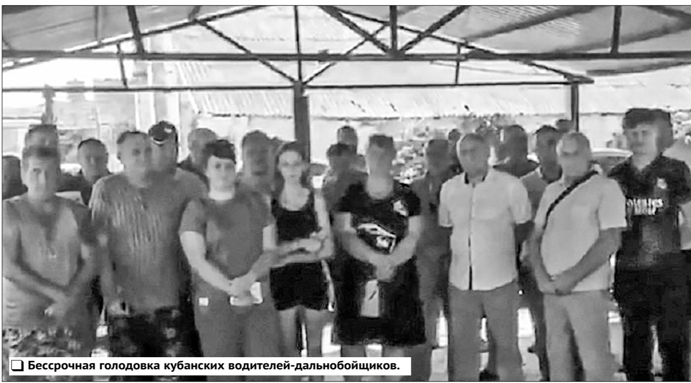
Бессрочная голодовка кубанских водителей-дальнобойщиков.

Пока нам не выплатят зарплату за июнь, июль и август, мы отсюда не уйдём, — твёрдо заявили они. — Требуем, чтобы к нам приехали сотрудники ОБЭП, прокуратуры и, желателно, кто-нибудь из мэрии.