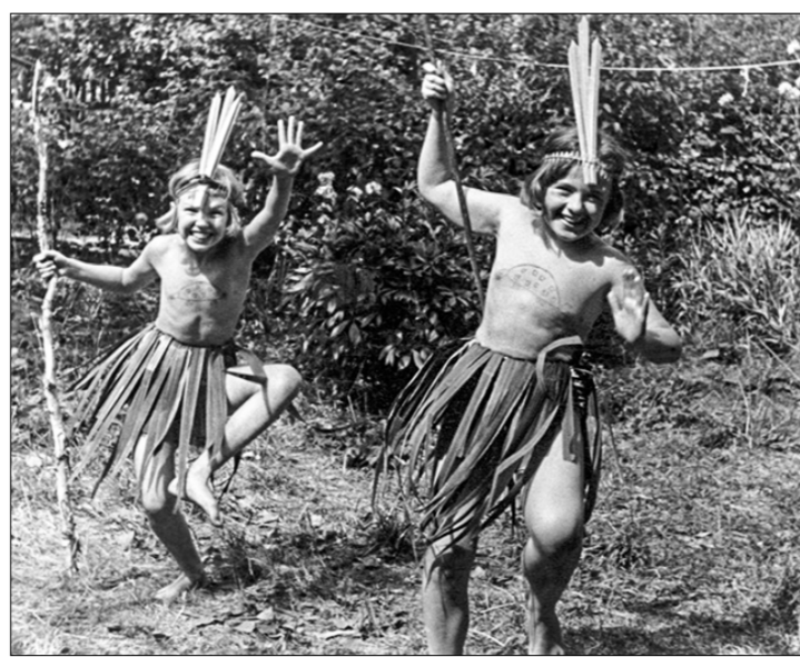
Детство в СССР...