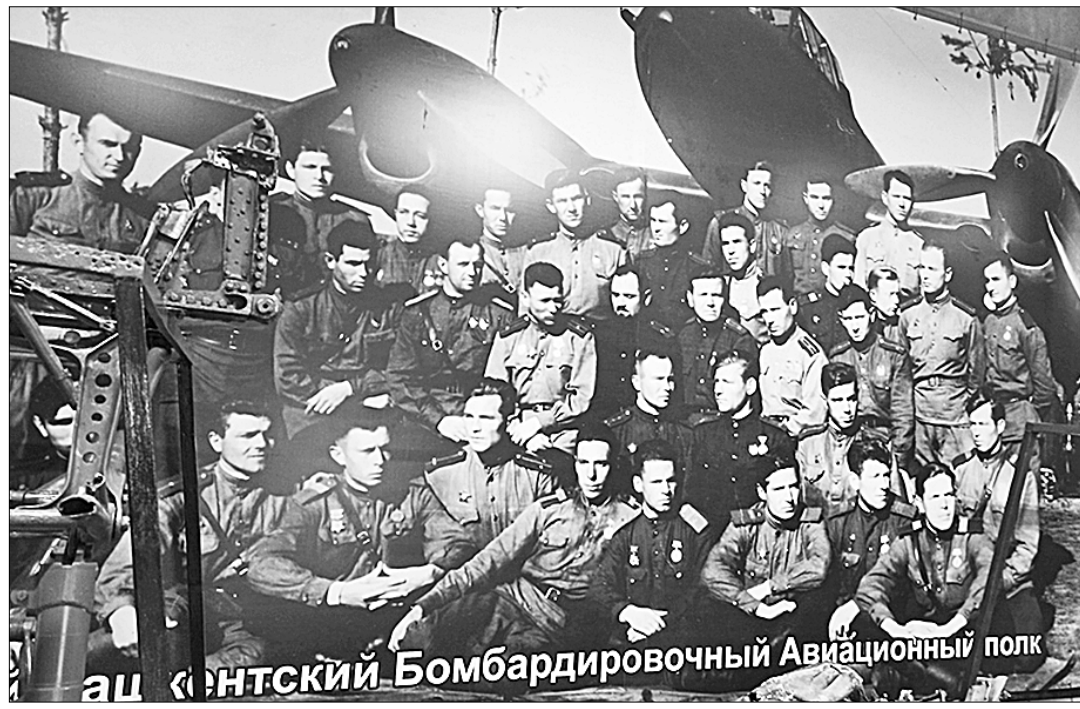
аи «Курганский Бомбардировочный Авиационный полк»