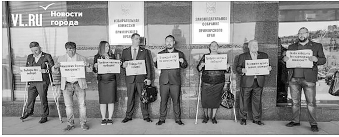
Во Владивостоке члены фракции КПРФ в Законодательном собрании Приморья провели акцию протеста, сообщают городской новостной сайт VL.ru.

Плакаты пикетчиков гласят: «Кожеема (губернатор Приморья. — Ред.) боится контроля?», «Выборы без выбора», «Не смогли купить — значит симнем?», «Слабо победить без карманных комиссий?»