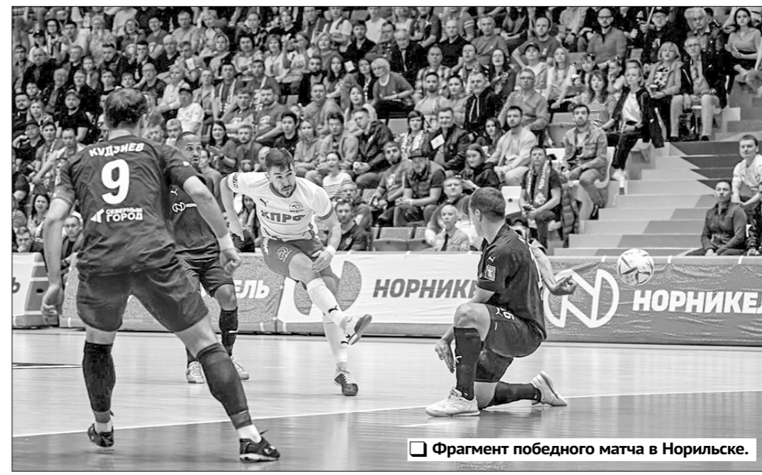
Фрагмент победного матча в Норильске.

Это нашло своё подтверждение на всех стадиях плей-офф. Нашей командой были последовательно повержены сильные соперники: в четвертьфинале — «Новая генерация» из Сыктывкара, в полуфинале — «Синара» из Екатеринбург и, наконец, в финале — «Норильский никель». Причём на всех стадиях борьбы навывел «коммунисты» победы безоговорочно, не потерпев ни одного поражения! Им потребовалось для этого всего девять игр, соответственно каждый из соперников был последовательно обыгран в серии со счётом 3:0. И это при том, что в лице «Синары» и «Норильского никеля» нашей команде противостояли ведущие мини-футбольные клубы страны! Но после каждой из этих серии специалисты отмечали, что такой успех отнюдь не стечение обстоятельств. Несмотря на наличие в составе соперников большого числа ярких исполнителей, «сумма объективного мастерства», выражаясь футбольным языком, у МФК КПРФ была немного выше, чем у каждого из них. Этого «немного» и хватало в каждой