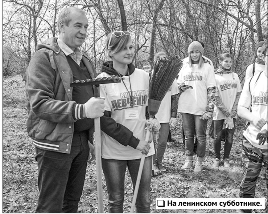
На ленинском субботнике.

— Но милиция же, новая власть... — А я заметил, что и милиция не очень старалась. Знали ведь они меня не один год. Знали и других в горкоме. Тоже уважали, наверное.