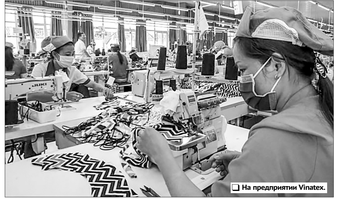
На предприятии Vinatex.

Вьетнамская ассоциация текстиля и одежды (VITAS) поставила цель заработать 44 млрд долларов на экспорте текстиля и одежды в 2024 году, поскольку начиная с последнего квартала уходящего года в отрасли наблюдаются положительные изменения, сообщает интернет-портал VnExpress.