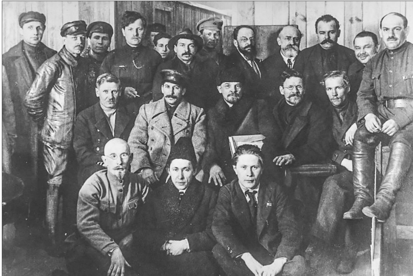
□ И.В. Сталин, В.И. Ленин и М.И. Калинин (в центре) — делегатами VIII съезда Коммунистической партии в Москве. 23 марта 1919 года.

Сталин занялся делами по восстановлению разрушенного Гражданской войной народно-хозяйства. Опыт его государственной работы в первые годы Советской власти и его участия в руководстве боевыми действиями Красной Армии на всём протяжении огненного кольца фронтов вокруг Советской республики стал для него важным уроком в его дальнейшей деятельности.