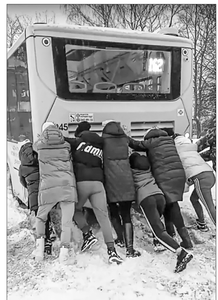
Автобус застрял в снегу.

«Рейсовый автобус Ярославль — Ильинское-Урусово,