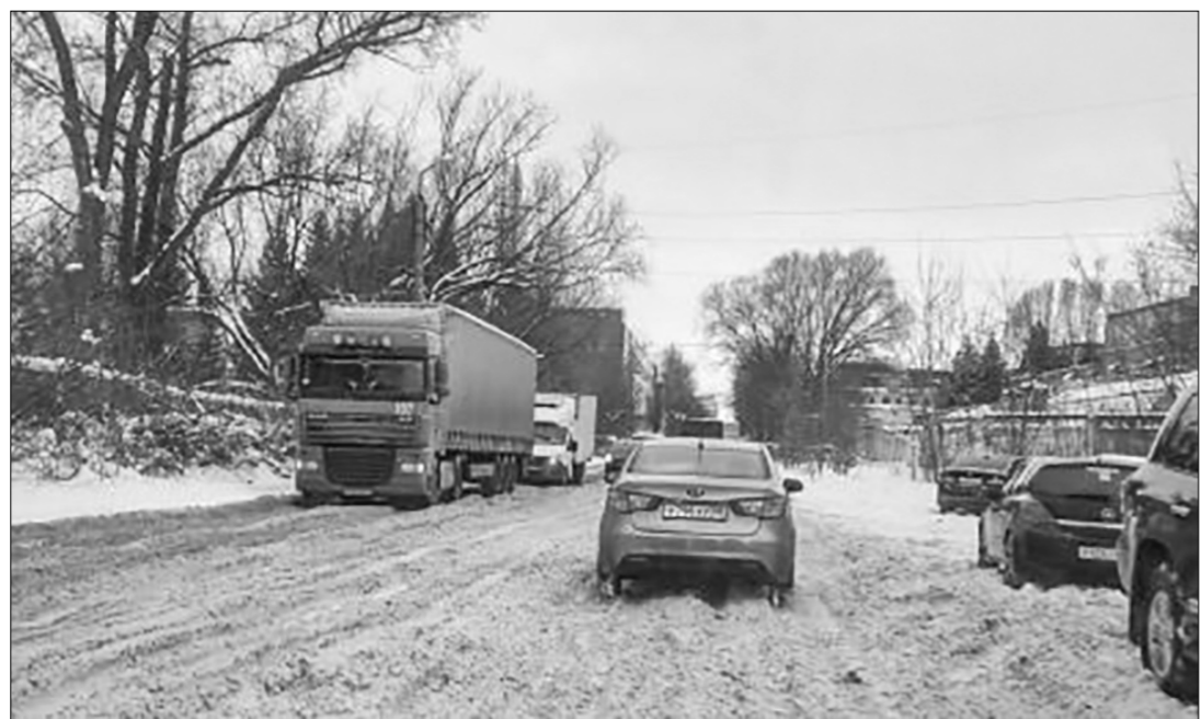
Снежный каток на улицах Пензы.

— 95 лет со дня рождения Татьяны Шмыги (1928—2011) — народной артистки СССР. Солистка Московского театра оперетты (1953—2011). Снималась в фильмах.