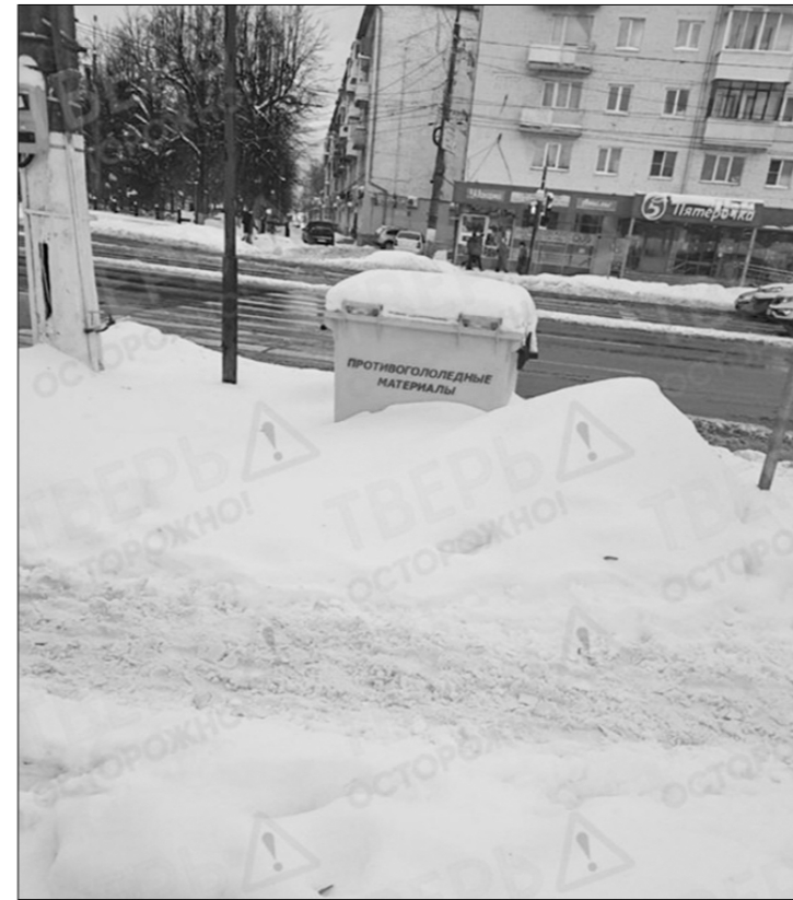
В Твери дороги не чистят.

В Ярославской области пассажиры двух рейсов на село Ильинское-Урусово добирались домой с неприятными приключениями. Причиной стала занесённая снегом дорога, которую, как говорят жители, не чистили ни разу за последние дни. При этом по ней четыре раза в день ходит рейсовый автобус №162 — новый, низкопольный.