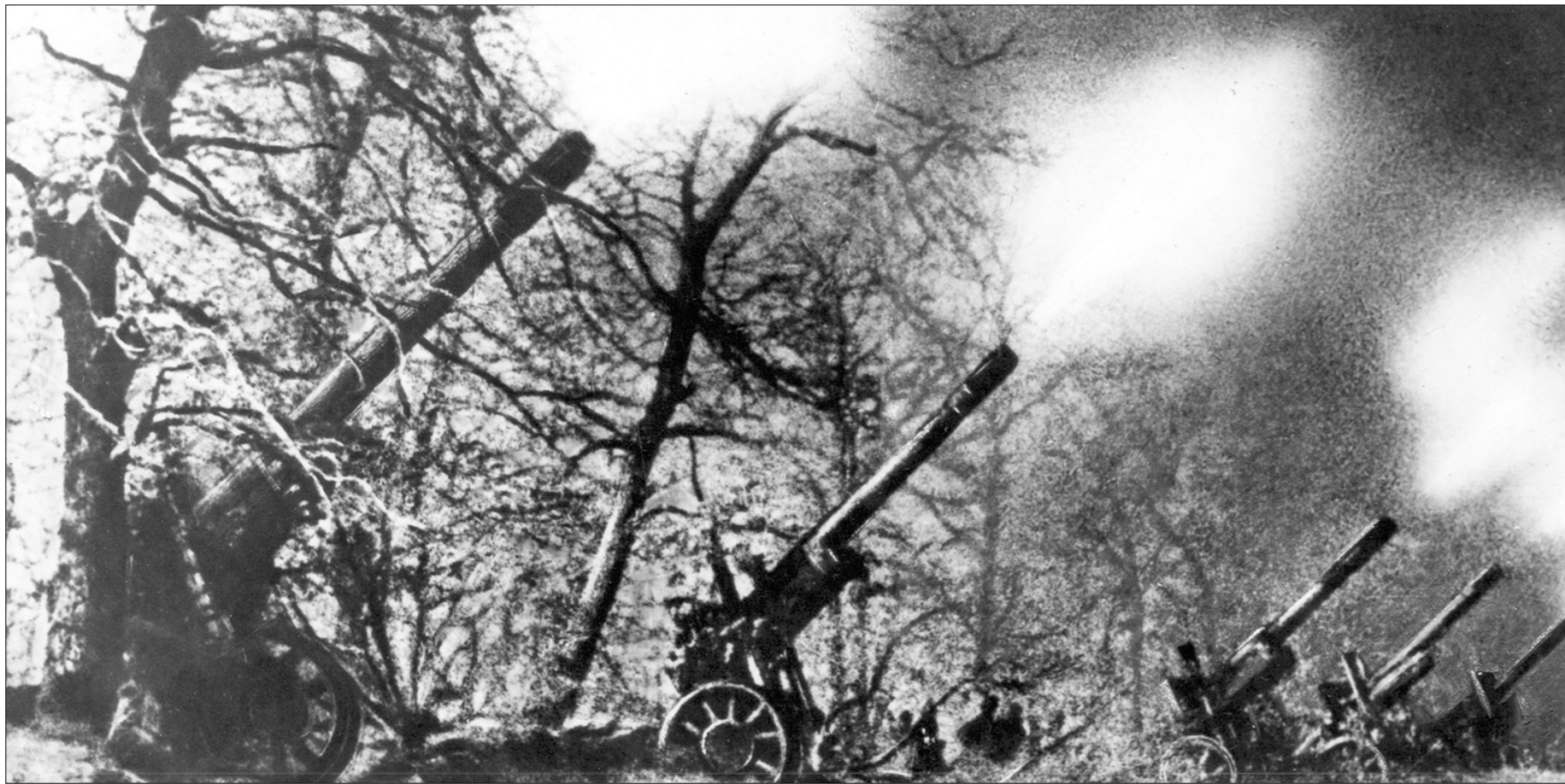
Продолжаем тему Сталинградской битвы на 4-й странице.