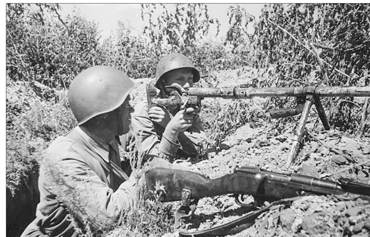
Горюховцы часто явственно слышали в сентябре с севера гром нашей каноноады. Но соединиться со своими не довелось до середины ноября. Драться с врагом приходилось своими силами. На фото: расчёт бронебойщиков на позиции.

Маршал Крылов в своих мемуарах с точки зрения командования 62-й армии, осаждённой в городе, отмечал: «Предположение, что действия советских войск севернее города вынудят противника оттянуть какие-то силы из-под Сталинграда, в тот раз, к сожалению, не оправдалось... Наша армия получила лишь небольшое передышку на несколько часов от бомбёжек с воздуха, да и то непол-