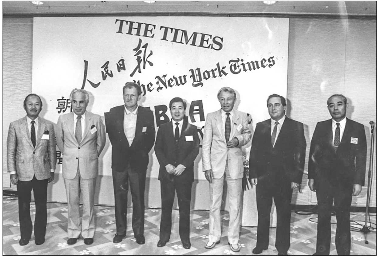
□ На встрече главных редакторов самых влиятельных газет мира. Япония, 1987 г.