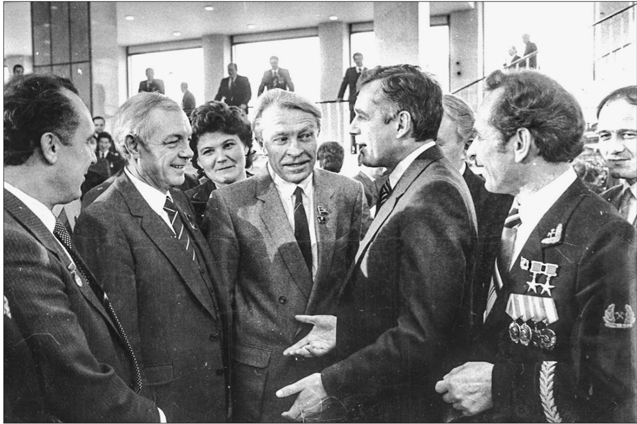
□ На XXVII съезде КПСС. 1986 г.