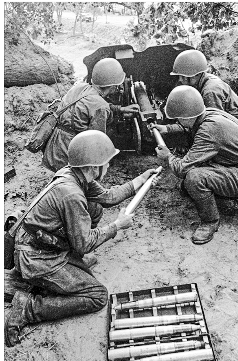
Натиск врага на Сталинград не ослабевал. Бои разворачивались с новой, до этого невиданной силой. На фото: Расчёт 45-мм орудия ведёт огонь по врагу.

ную: фашистские самолёты не исцезли совсем, их только поубавилось. А натиск наземных сил не ослабевал. Скоро стало ясно, что он нигде не перебрисил ни единого действовавшего перед фронтом 62-й армии пехотной или танковой части».