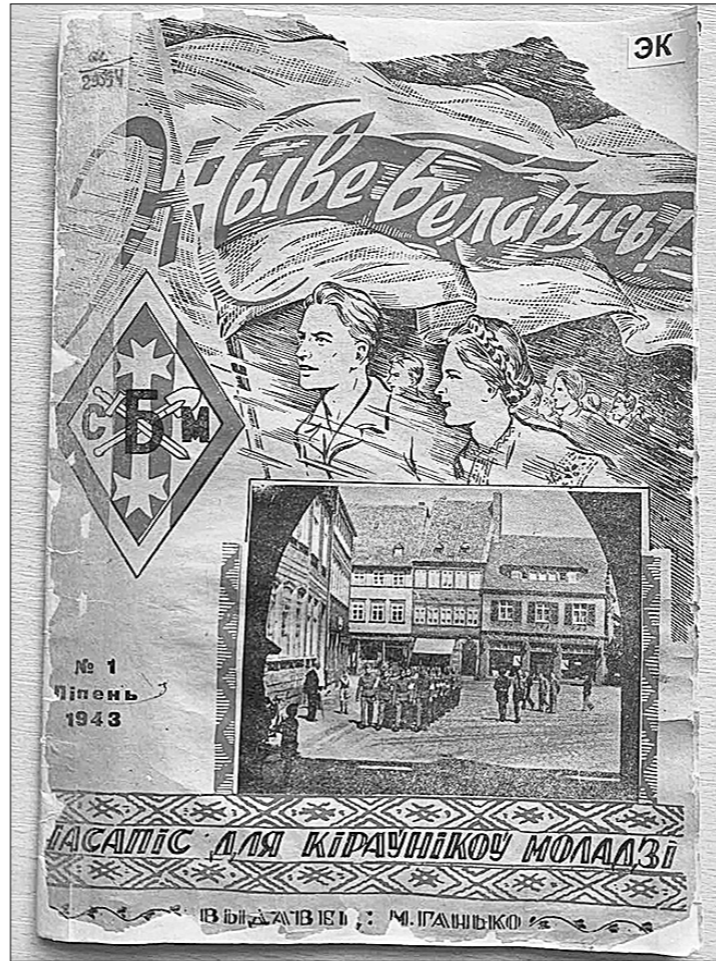
Журнал белорусского гитлерюгенда, зовущего под бело-красно-белые знамёна.

В №7 журнала «Беларус на варце» («Белорус на страже»), выходящего на оккупированной территории в 1943–1944 годах, можно прочитать о чествовании участников первой школы офицеров и подполковников Белорусской краевой обороны и узнать, что генеральный комиссар Белоруссии, группенфюрер СС Курт фон Готберг (сменивший на этом посту взорванного подполковника М. Кубе) приветствует выпускников школы по-белорусски «Жыёе Беларусь!», получая в ответ тройное громогласное «Жыёе!».