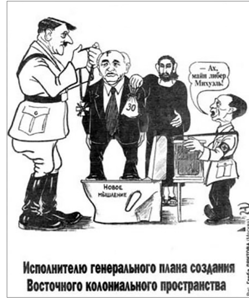
Исполнителю генерального плана создания Восточного колониального пространства

Горбачёву нет прощения за многое, в том числе, конечно, за предательство ГДР. На одной из встреч с