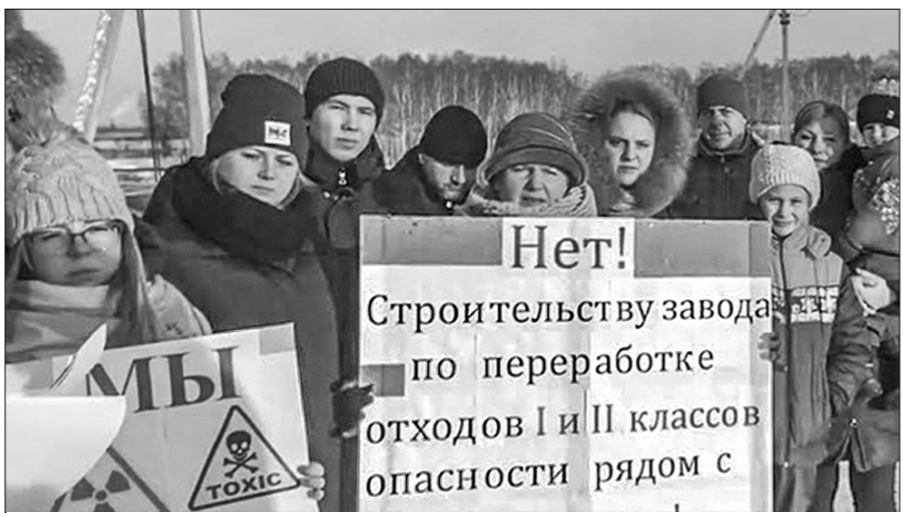
□ Протестный митинг калужан.

тельства завода, который, по их мнению, будет не только загрязнять окружающую среду, но и окажет негативное воздействие на здоровье людей. Ведь завод хотят построить неподалё-