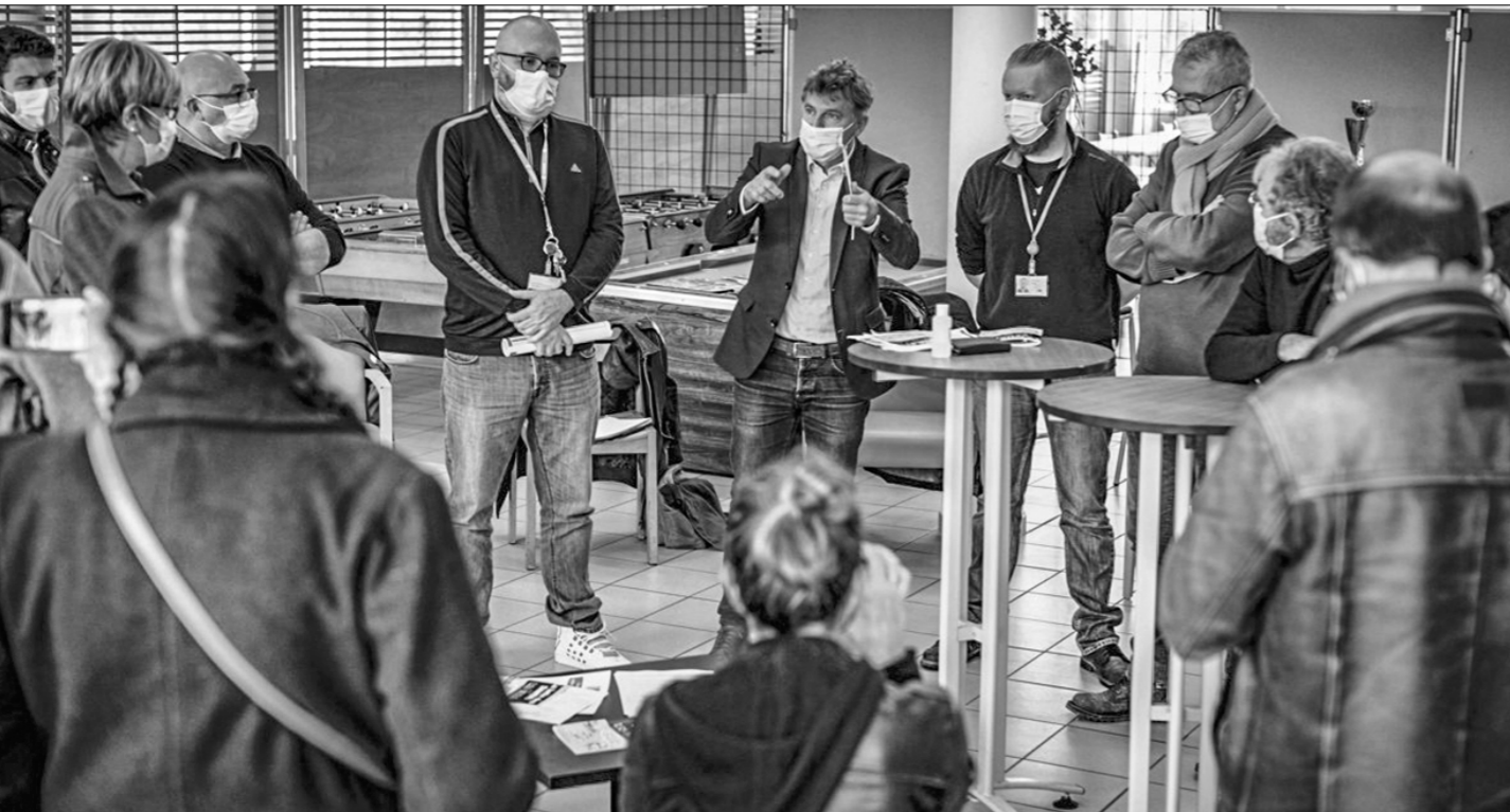
Национальный секретарь ФКП Фабьен Руссель выступает на встрече с рабочими.

вами за возрождение экономической мощи нашей страны», — заверил национальный секретарь ФКП. В разгар кризиса в области здравоохранения и на фоне нехватки вакцины против COVID-19 коммунисты во время поездки по промышленному району посетили объект «Санofi» в Сен-Обен-ле-Эльбефе. Медицинская корпорация намерена передать субподрядчикам шесть заводов, в том числе предприятие в Эльбефе, и установить между предприятиями конкуренцию за прибыльность. В ответ на такое решение руководства компании сотрудники «Санofi» 19 января объявили забастовку. «Наш завод специализируется на выпуске антибиотиков», — объявило профессиональное объединение. Но руководству «Санofi» не хочет инвестировать в наше предприятие, потому что продажа антибиотиков не приносит большой прибыли. «Санofi» предпочитает разрабатывать новые дорогие лекарства. Профсоюз предприятия заявил, что за последние десять лет фармацевтическая группа получила миллиард евро в виде кредитов на исследования, но одновременно с этим сократила рабочие места. Фабьен Руссель отметил, что политика кор-