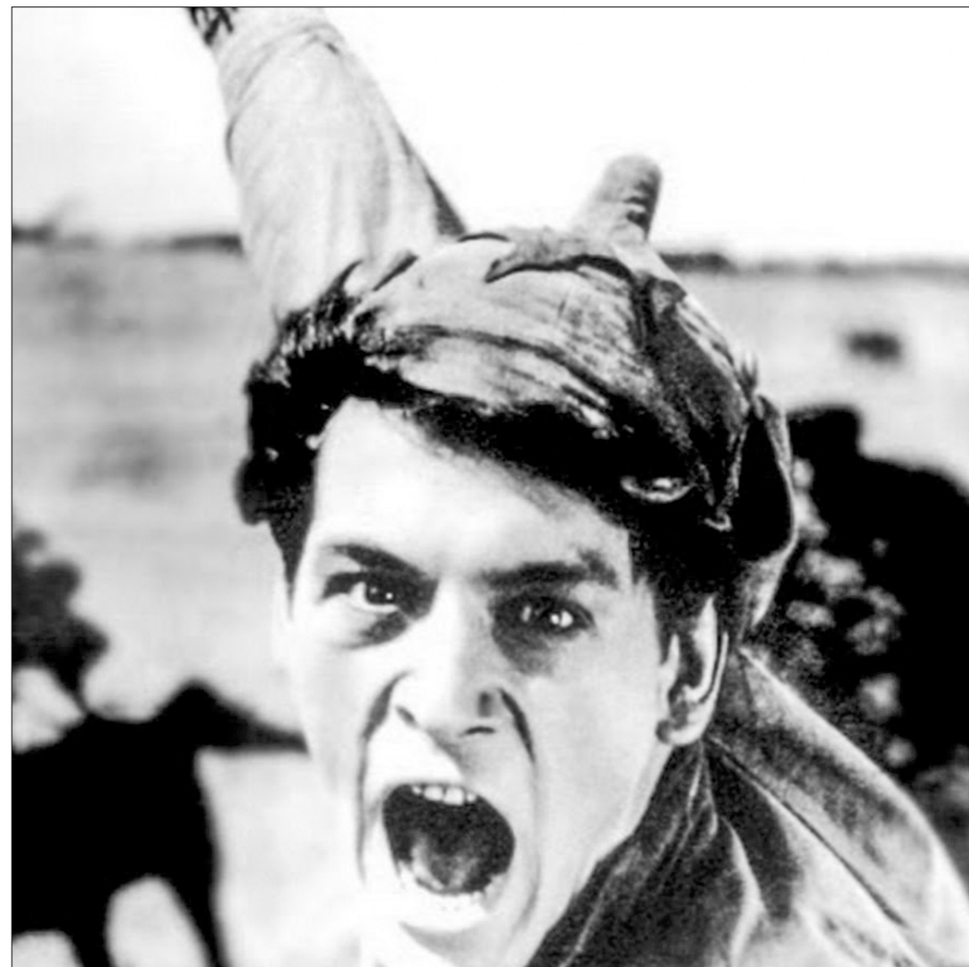
□ Василий Лановой в роли Павки Корчагина.