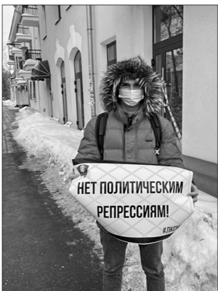
Пресс-служба Самарского обкома ЛКСМ РФ.

На волне информационных сообщений, крутящихся вокруг одного человека, не стоит забывать о том, что политические репрессии — это ежедневная боль нашей страны и количество сфабрикованных здесь дел только растёт. Власть капитала «душит» всех неугодных и с каждым разом придумывает всё более изощрённые законы, вгоняющие граждан во всё более жёсткие рамки.