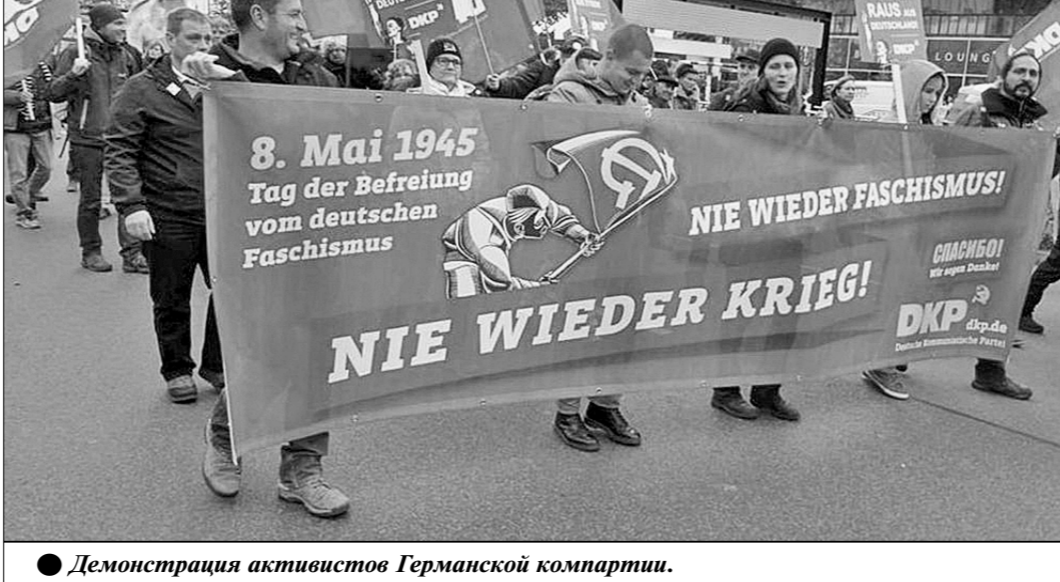
Демонстрация активистов Германской компартии.

тически отмена права на политическое убежище, участие в военной агрессии против Югославии, антинародные законы канцлера Шрёдера... Всё это заставило рабочее класс ФРГ, привыкшего к интеллигентному стилю общения с германскими капиталистами в послевоенный период.