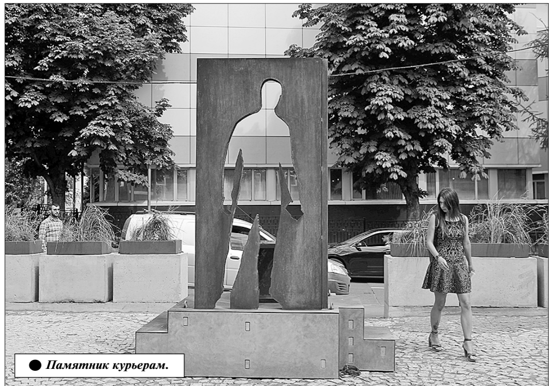
● Памятник курьерам.

ЭТИХ ЛЮДЕЙ мы почти не замечаем в повседневности, но именно они во время пандемии коронавируса во многом облегчили жизнь россиян, долгое время находившихся в самоизоляции. Речь идёт о курьерах, почти круглосуточно доставлявших всем, кто сидел дома, продукты, лекарства, одежду, книги, бытовую технику и другие товары. Трудовой подвиг посланцев гипермаркетов и интернет-магазинов решили увековечить в Москве, воздвигнув им памятник. Наверное, курьерам это