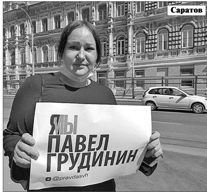
В течение последних двух лет продолжается травля директора подмосковного совхоза имени Ленина, кандидата на пост президента Российской Федерации на выборах 2018 года Павла Николаевича Грудинина.

Б УРЖУАЗНАЯ ВЛАСТЬ стремится с помощью подконтрольных ей правоохранительных и судебных органов свести счёты с человеком, не просто доказавшим передовой характер социалистических форм хозяйствования, но и убедительно представившим альтернативную действующей системе. Именно на это направлены попытки предъявления ему безосновательных обвинений в мнимом обмане акционеров народного предприятия.