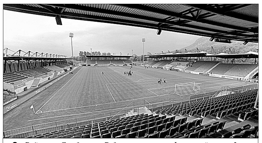
«Райнпарк Стадион» в Вадуце.

У дотошного читателя может возникнуть вопрос: а что будет, если, например, тот же «Вадуц», выиграв в очередной раз Кубок своей страны, одновременно каким-то чудом выиграет и чемпионат Швейцарии? Однако тут всё заранее предусмотрено: все лихтенштейнские клубы имеют статус приглашённых и не могут представлять Швейцарию в еврокубках.