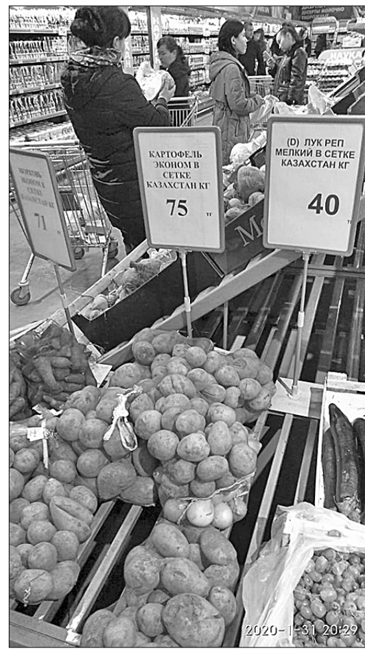
Капитализм в сетке.

Чиновники, правда, предпочитают говорить о других отраслях, где ситуация выглядит лучше. Например, за последний год в Казахстане существенно увеличился выпуск автомобилей — как грузовых, так и легковых. Однако речь в данном случае идёт лишь о сборочном производстве продукции зарубежных компаний, таких как «Шевроле», «Шкода», «Хёндай», KIA и т.д. Далеко не лучшим образом обстоят дела в социальной сфере. Безработица среди молодёжи за прошлый год выросла, по официальной статистике, на 3,4 процента. При этом доля граждан с выс-