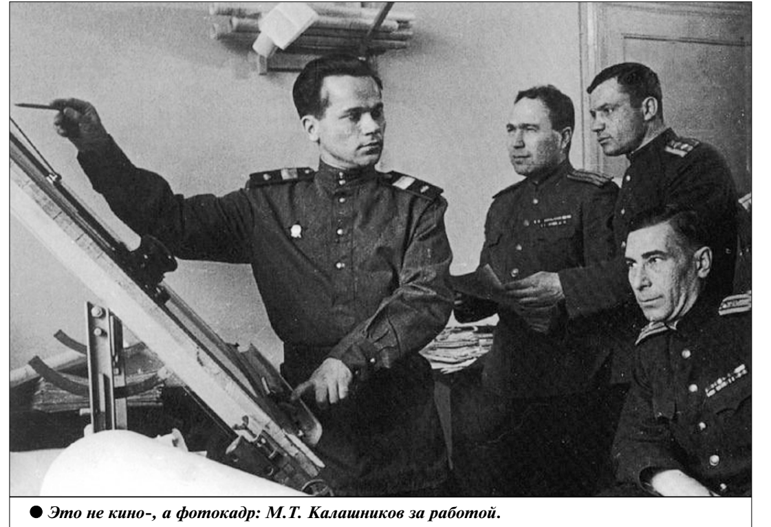
Это не кино-, а фотокор: М.Т. Калашников за работой.