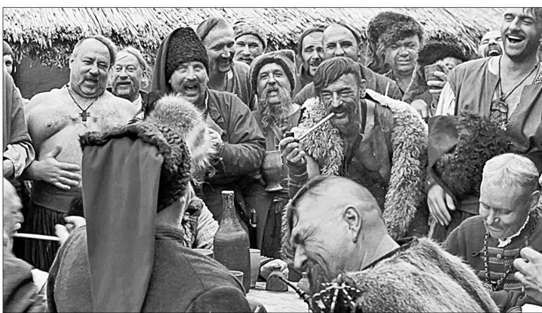
Кадры из фильма «Тарас Бульба». Режиссёр В. Бортко, 2009 г.