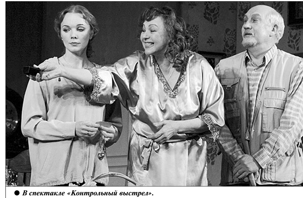
● В спектакле «Контрольный выстрел».