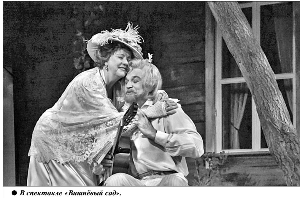
● В спектакле «Вишнёвый сад».

— МХАТ всегда был театром современной пьесы. А кому из современных драматургов лично вы сегодня отдаёте предпочтение? — Назову Юрия Полюкова. Я играю в его пьесах и должна признаться, что очень люблю его тексты — искромётность языка, редчайшее чувство юмора, очень тонкого и тёплого. Одна из последних моих работ — спектакль «Лютти»