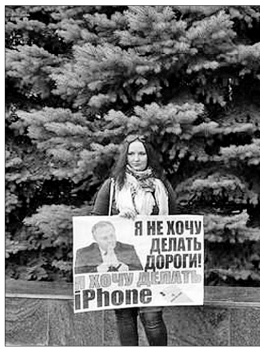
По сообщениям информгентств.

римов. — С тех пор оно не ремонтировалось. В школе нарушена техника пожарной безопасности. Нет ни материально-технической базы, ни нормального санузла. Я обращался в разные инстанции в республике, но почти все мои 60 писем остались без ответа. Писал и на имя главы республики, и в министерство экономики и т.д. Получаю отписки и ответы, что в республиканском бюджете денег нет. У меня в той школе двое детей учатся. Старший в третьем классе, младший — в первом. Я беспокоюсь за их здоровье. А вот властям, похоже, нет дела до наших детей. Если меня и в Пятигорске не услышат, поеду в Москву.