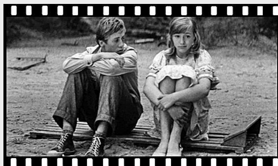
● Кадр из фильма «Сто дней после детства».

Первое июня в Советском Союзе было особым днём. Из всех динамиков неслаб неся «Пусть всегда будет солнце!». Проходило огромное количество мероприятий на государственном уровне. С первых лет Советской власти подрастающему поколению уделялось особое внимание. Уже в октябре 1918 года был принят декрет о создании единой трудовой школы в РСФСР. Обучение во всех школах стало бесплатным. Советская школа всегда была больше, чем просто место, где дети получают знания. Это и учёба, и воспитание, и общественная жизнь. Слёты, кружки, сбор макулатуры и металлолома, субботники — все эти акции имели глубокий смысл и были окрашены духом романтики.