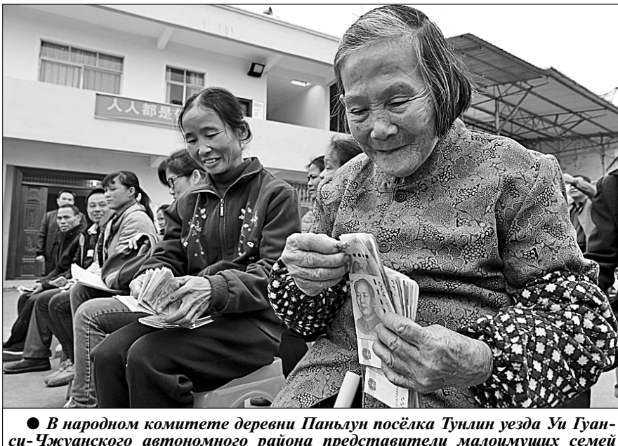
В народном комитете деревни Паньдун посёлка Тулин уезда Уи Гуанси-Чжуанского автономного района представители малоимущих семей считают полученные денежные дивиденды.

СТРАНА принимает следующие меры в предоставлении помощи бедным.