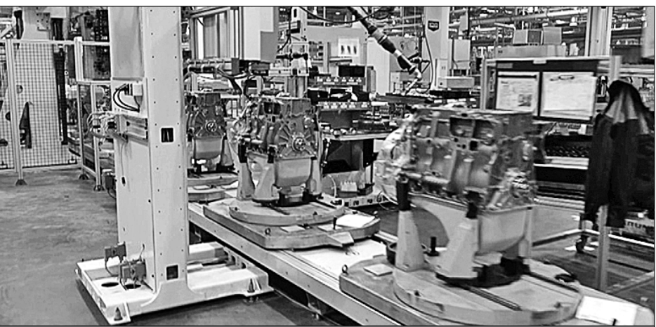
● Продукция Ярославского моторного завода пользуется большим спросом.