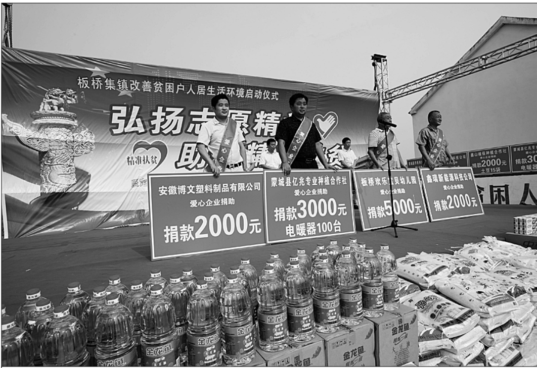
В посёлке Банцзяо уезда Манчэи провинции Аньхой различные предприятия безвозмездно предоставляют нуждающемуся населению продовольственные товары.

Главный экономист Азиатского банка развития Вань Гуанхуа на протяжении долгого времени наблюдал за китайским