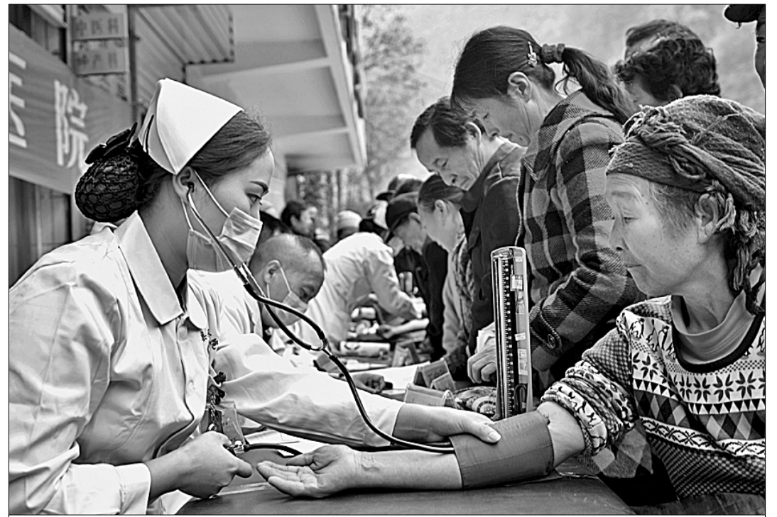
Медработники из Тяньцзиньской больницы бесплатно осматривают жителей деревни Цанцэ посёлка Тайяньли уезда Нинцзи провинции Шэньси.