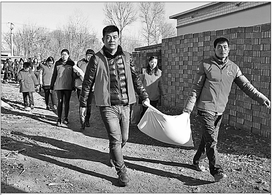
Волонтеры раздают продукты питания для малоимущих семей.