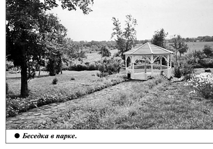
Беседка в парке.

Своим восторгом от радужных дней в Воробьёвке Афанасий Афанасьевич Фет делится и с «дорогим другом графом Львом Николаевичем Толстым»: «Никогда я не чувствовал такого, можно сказать, сибаритского довольства жизнью. Сегодня второй солнечный день, и, право, можно слышать, как трава, лютик, лежат из земли. Пчёлы, когда я шёл под вербами смотреть жеребят на гумне, так и распевали над головой, и ни одна не тронет. Не до того. А дальше поэт спешит порадовать друга писателя только что пришедшими на ум стихотворными строчками: Ещё, ещё! Ах, сердце слышит Давно призыв её родной, И всё, что движется и дышит, Задыхит новою весной. Уж травка светит с кочек талых,