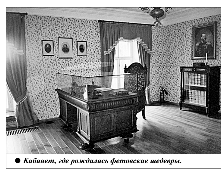
Кабинет, где рождались фетовские шедевры.

Плаксивый чибис прокричал, Цепь снеговую туч отсталых Сегодня первый гром порвал. Но поэт не был бы поэтом, если бы его хотя бы иногда не посетили тоска, мысли о конечности земного существования, бессонница. В такие моменты Фет выходил на балкон воробьёвского дома, глубоко вдыхал пронизанный запахом трав и цветов прохладный ночной воздух, вслушивался в журчащий говор фонтана в тёмном парке и начинал шёпотом проговаривать: Устало всё кругом: устал и цвет небес, И ветер, и река, и месяц, что родился, И ночь, и в зелени потусклой спящий лес, И жёлтый тот листок, что, наконец, свалился. Лепечет лишь фонтан среди дальней темноты, О жизни говоря незримой, но знакомой... О ночь осенняя, как востроумца ты и смертною истомой!