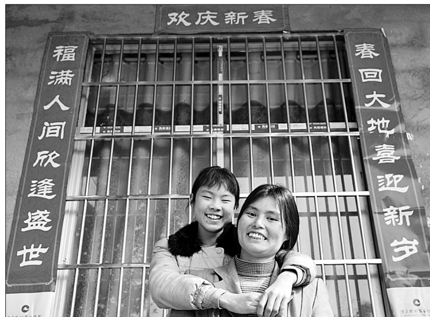
Эта семья глухонемых вышла из нищеты и переехала в новый дом, где отметила Новый год по лунному календарю.

рым требуется скорейшее совершенствование инфраструктуры электронной коммерции, стимулирование развития специфических отраслей, подготовка соответствующих специалистов для бедных районов, поощрение использования электронной коммерции бедными семьями для предпринимательской деятельности.