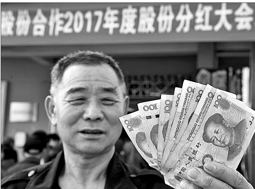
С помощью китайского правительства жители деревни Чэньси посёлка Фаньян уезда Фанчжан провинции Аньхой впервые получили дивиденды после реформирования коллективной системы прав собственности в деревнях.