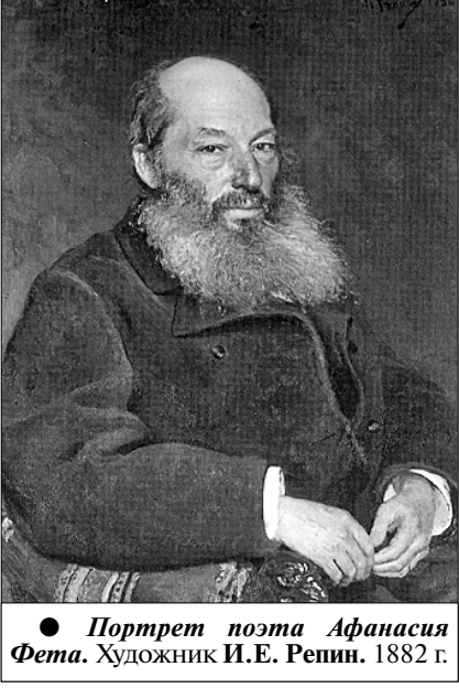
Портрет поэта Афанасия Фета. Художник И.Е. Репин. 1882 г.

Какое счастье, что к славному созвездию «литературных гнёзд» в России прибавилось недавно ещё одно! После реставрационных работ на высоком берегу реки Тускарь в Курской области вновь блистает красой, зовёт под свой кров гостей возрождённый почти из небытия двухэтажный дом, с 1877 года и до последних его дней принадлежавший тончайшему русскому лирику Афанасию Фету. «Я наконец осуществил свой идеал, — рассказывал поэт в одном из писем, — жить в прочной каменной усадьбе, совершенно опрятной, над водой, окружённой значительной растительностью... При этом у меня уединённый кабинет с отличными видами из окон, бильярдом в соседней комнате, а зимой цветущая оранжерея».