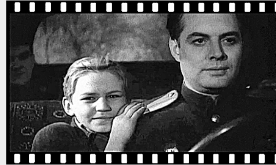
● Кадр из фильма «У них есть Родина».

Пионерские лагеря являлись отдельной частью детской жизни. Летний отдых ребятшек — это целая индустрия в Советской стране. Даже во время Великой Отечественной войны продолжалась работа по организации пионерских лагерей. В 80-е годы прошлого столетия в Советском Союзе было около 40 тысяч загородных лагерей, где ежегодно отдыхали около 10 миллионов детей. И редко кому из ребят удавалось удержаться от слёз, когда после окончания смены приходило время возвращаться домой.