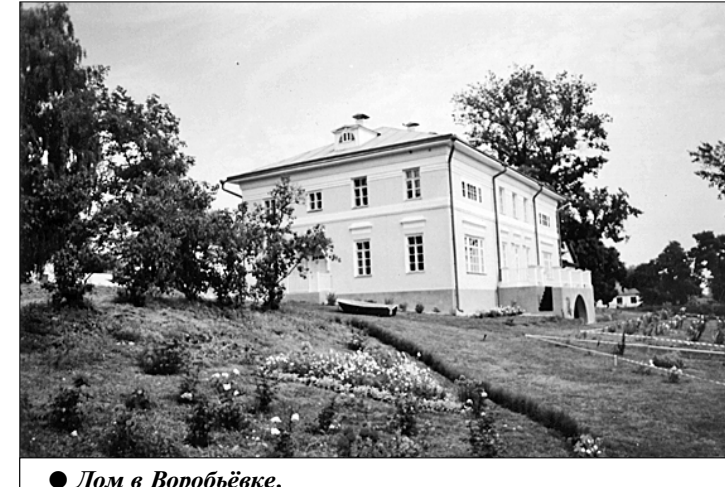
Дом в Воробьёвке.

Какое счастье, что к славному созвездию «литературных гнёзд» в России прибавилось недавно ещё одно! После реставрационных работ на высоком берегу реки Тускарь в Курской области вновь блистает красой, зовёт под свой кров гостей возрождённый почти из небытия двухэтажный дом, с 1877 года и до последних его дней принадлежавший тончайшему русскому лирику Афанасию Фету. «Я наконец осуществил свой идеал, — рассказывал поэт в одном из писем, — жить в прочной каменной усадьбе, совершенно опрятной, над водой, окружённой значительной растительностью... При этом у меня уединённый кабинет с отличными видами из окон, бильярдом в соседней комнате, а зимой цветущая оранжерея».