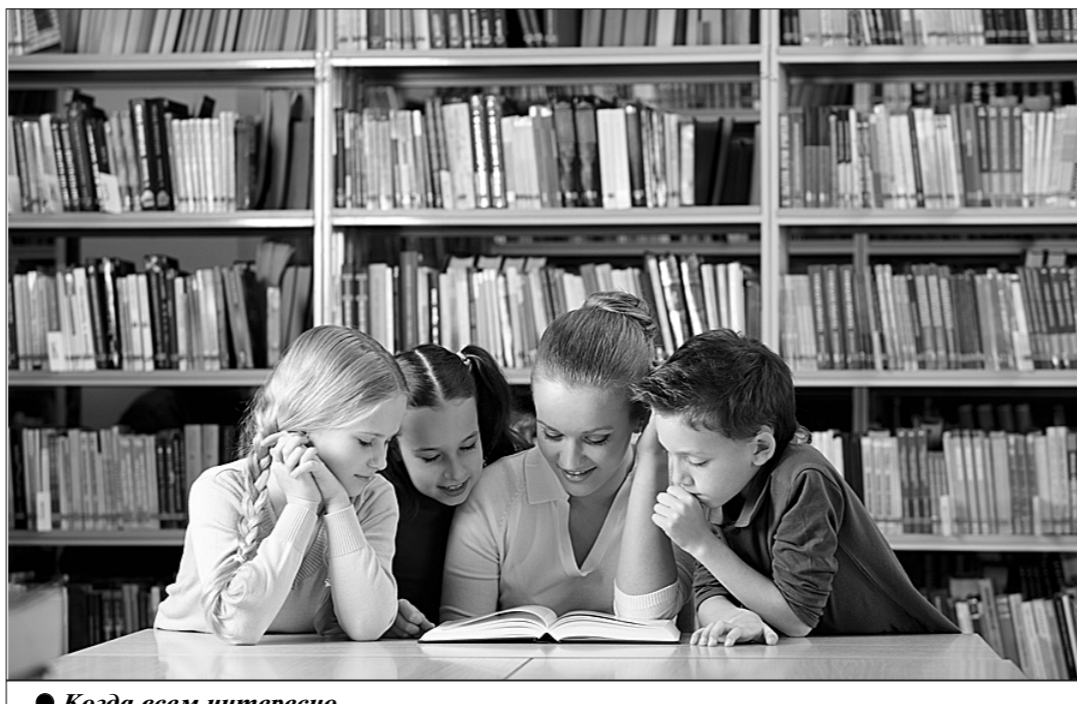
• Когда всем интересно...

А помните книги и «мультики» о приключениях крокодила Гены и Чебурашки, о деревне Простоквашино? Они навсегда пролились автору — Эдуарду Успенскому, ушедшего из жизни недавно.