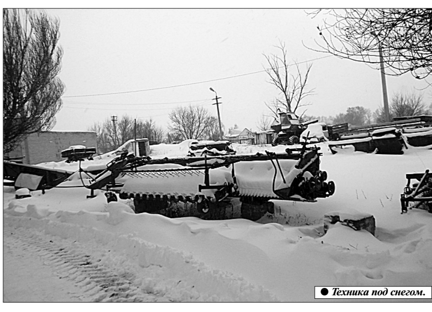
Техника под снегом.

Факты, как говорят, упрямая вещь. Но порой возникают ситуации, когда факты скорее можно назвать убойными. Именно такая обстановка сложилась в Кошкинском районе Самарской области с подготовкой кадров для сельскохозяйственного производства.