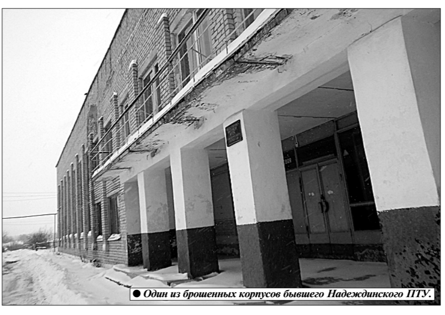
Один из брошенных корпусов бывшего Надеждинского ИТУ.