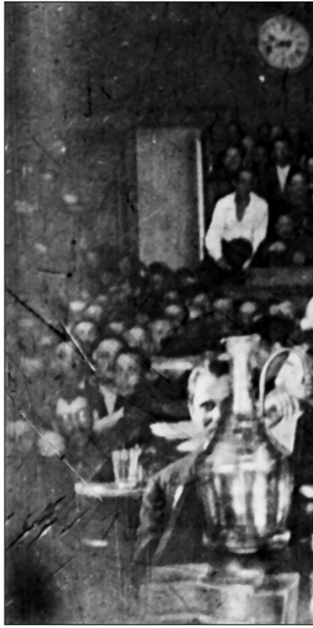
Красной площади. Это был поистине всеобщий голос народа: не позволим! Не допустим, чтобы контрреволюционные силы подняли свои грязные руки на нашу святыню!

— написали нам из г. Кременчуга. — Звучали слова: Россия, Москва, общество «Ленин и Отечество»...»