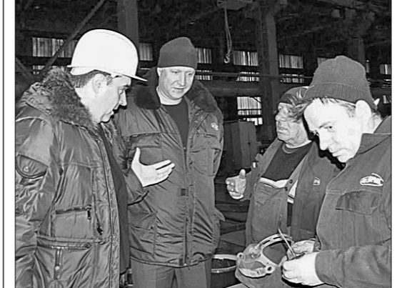
увеличилось большое число молодых перспективных и наиболее грамотных специалистов. Остаётся опасность рейдерского захвата предприятия для его последующей распродажи...»

Молодые активисты КПРФ, комсомольцы и рабочие организовали предупредительный пикет у проходной Саратовского завода резервуарных конструкций...»