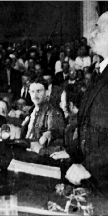
«Вместе с организацией «Ленин и Отечество» мы проводили работу по сохранению памятников В.И. Ленину в Харьковской области...»

дорого имя В.И. Ленина. В районе было немало ленинских памятников, о них забылись, их реставрировали, охраняли...»