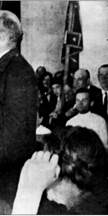
«Вместе с организацией «Ленин и Отечество» мы проводили работу по сохранению памятников В.И. Ленину в Харьковской области...»

организации. Я чувствую, что у нас единая идеология, поэтому большая честь с вами переписываться...»