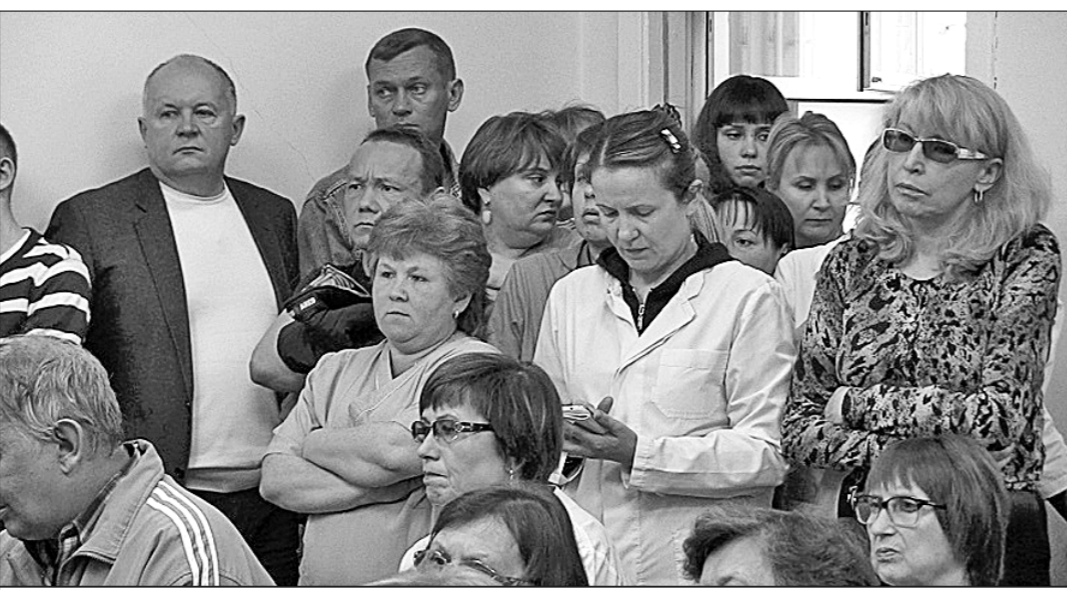
● Пермский Центр диализа: возмущены и врачи, и пациенты.

Жители города Байкальска Иркутской области начали сбор подписей под петицией президенту России Владимиру Путину с просьбой не позволить закрыть местную больницу. Пациенты пермского Центра диализа вышли на пикет, возмущённые ликвидацией отделения нефрологии и реанимации (большинство пациентов — дети). В Беслане взбуряются перепрофилированием отделения пульмонологии детского медцентра. Жители Мамоновского (Калининградской области) митинговали против закрытия единственной в городе больницы. Екатеринбургцы взволнованы прекращением деятельности уникального отделения хирургии кисти, ра-