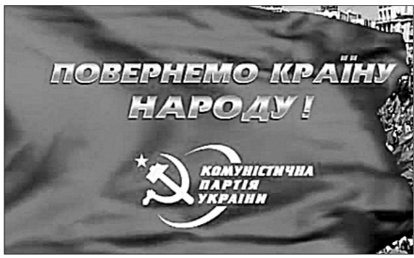
● Вернём Украину народу!

тому подтверждение. Угрозу большой войны представляют и вооружённые конфликты внутри государств. Здесь опять-таки в передовиках оказались реакционные круги Украины. По данным управления Верховного комиссара ООН по правам человека, в Донбассе в результате братоубийственной войны погибли почти 10 тысяч человек (из них более двух тысяч — мирные люди, в том числе дети, женщины, пожилые люди), свыше 22 тысяч получили ранения и увечья. Люди продолжают гибнуть. Разрушена значительная часть экономического потенциала самого крупного региона страны. Минский переговорный процесс зашёл в тупик. Поступает всё больше сигналов, свидетельствующих о реальной угрозе возобновления полномасштабных военных действий.