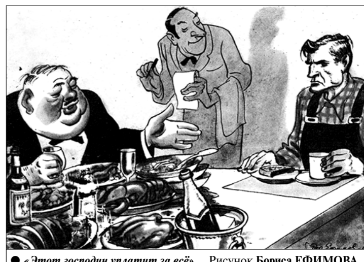
«Этот господин уплатит за всё». Рисунок Бориса ЕФИМОВА.

Не отстает от этого господина и ещё один «стальной» воротила Алексей Мордашов, добавивший за это же время к своему состоянию 1,6 миллиарда долла-