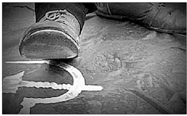
● Не дадим растоптать!