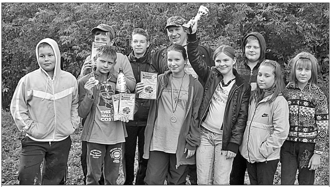
Юные туристы из села Тимашево — победители летних соревнований по технике слалова на байдарках.