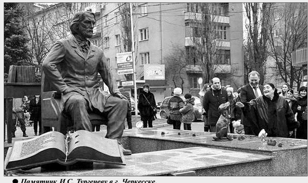
Памятник И.С. Тургеневу в г. Черкесске.

Через два года мы отметим большое событие в исторической и культурной жизни нашего народа. Исполнится 200 лет со дня рождения Ивана Сергеевича Тургенева, светоча русской и мировой литературы.