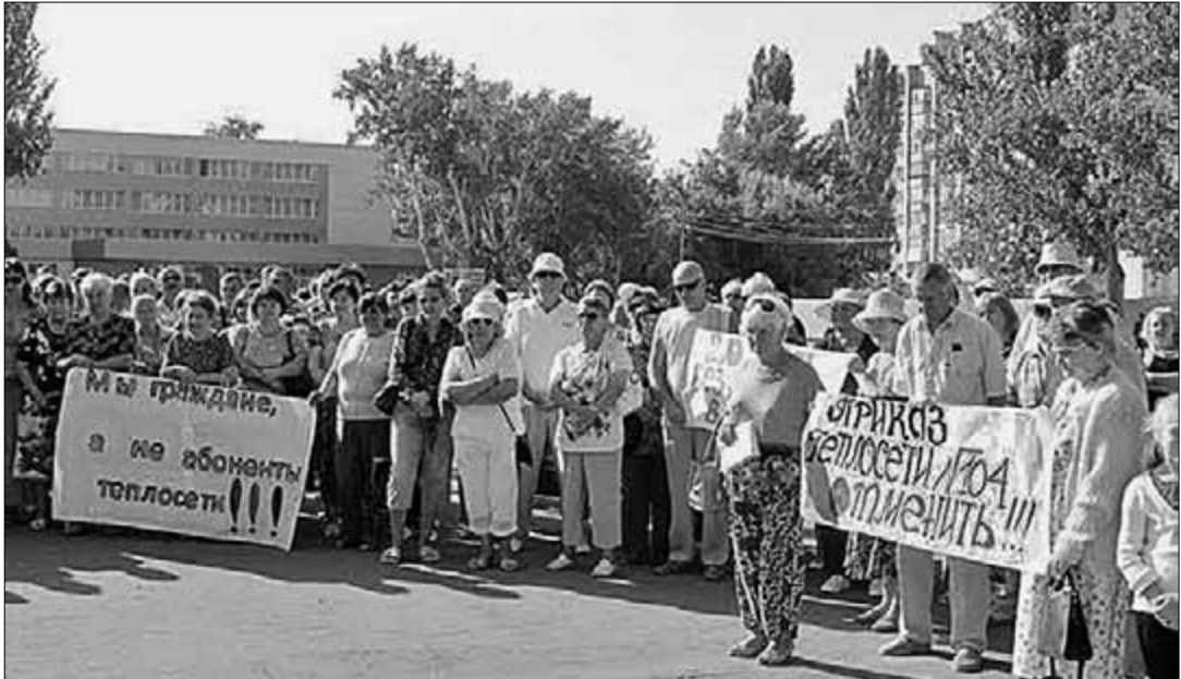
В г. Красноперекопск, что в Республике Крым, при активной поддержке коммунистов состоялся митинг, на котором жители потребовали от местных властей и руководства МУП «Тепловые сети» отменить денежные начисления тем, кто был вынужден отключиться от системы центрального отопления.

роде более 1000 человек. За фактически неказанные услуги им начали выставлять баснословные счета.