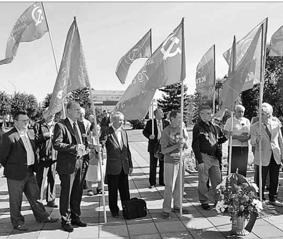
Коммунисты Ивановской области почтили память рабочих, расстрелянных 23 августа 1915 года царским режимом. Они провели митинг рядом с братской могилой на площади Революции областного центра.

В ЭТОТ ДЕНЬ состоялся V (совместный) пленум обкома партии. По завершении форума коммунисты области приняли участие в митинге памяти.