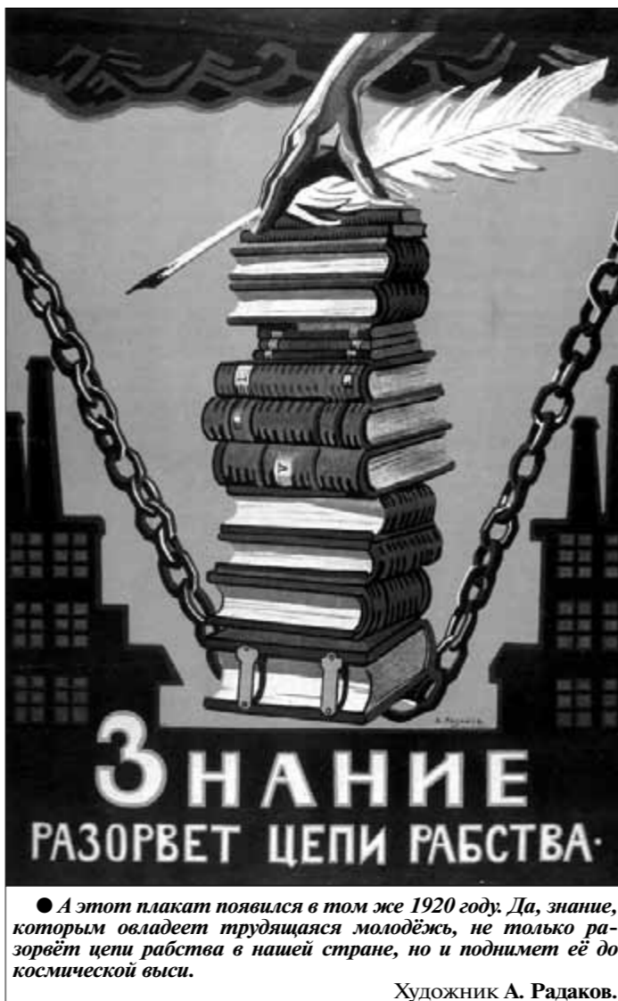
● А этот плакат появился в том же 1920 году. Да, знание, которым овладеет трудящаяся молодёжь, не только разорвёт цепи рабства в нашей стране, но и поднимет её до космической выси. Художник А. Радаков.

которые имели очень прочный фундамент и широкое поле общей культуры — за счёт непрерывного самообразования прежде всего, — отдавали должное марксизму, и не допускали примитивных, упрощённых оценок западной или русской цивилизации. А сегодня, замечу, такие примитивные оценки господствуют.