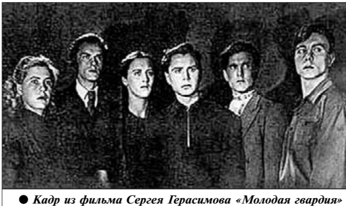
Кадр из фильма Сергея Герасимова «Молодая гвардия» (1948 г.)