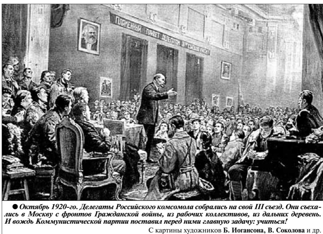
● Октябрь 1920-го. Делегаты Росийского комсомола собрались на свой III съезд. Они съехались в Москву с фронтов Гражданской войны, из рабочих коллективов, из дальних деревень. И вождь Коммунистической партии поставил перед ними главную задачу: учиться! С картины художников Б. Иогансона, В. Соколова и др.

... Это философия, которая ставит перед собой задачу — вывести человека из сферы животного царства. Это философия, которая ставит перед собой задачу — вывести человека из сферы животного царства.