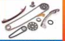
РЕМКМПЛЕКТЫ для ГРМ

г. Алматы, ул. Толе Би, 304, т.: 8-727-232-13-16, 8-777-341-4444