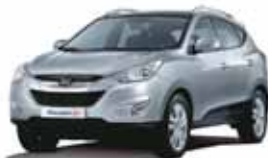
Hyundai Tucson - 17