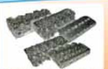
ГОЛОВКИ БЛОКА ЦИЛИНДРОВ