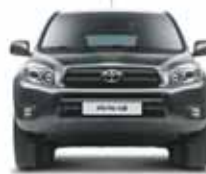
Toyota RAV4 – 26