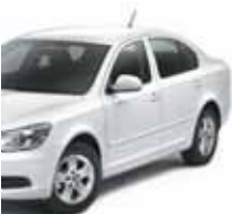
Octavia – 19

Несмотря на то что показатели января 2011 года были намного ниже итогов декабря 2010 года, ситуация в феврале значительно выправилась. Произошло это, в большей степени, благодаря проданным автомобилям брендов ГАЗ, восстановившим свои позиции на рынке, и LADA, подкупающим казахстанцев доступностью и минимальными затратами на обслуживание. Как показывают результаты февраля 2011 года, российский и казахстанский автопром продолжают все активнее завоевывать автомобильный рынок. Отметим, что продажи автомобилей могли бы быть и выше, если бы предложение, в данном случае иностранных брендов, удовлетворяло бы спрос казахстанских потребителей. Именно дефицит автомобилей на складах официальных дилеров сдерживает рост автопродаж.