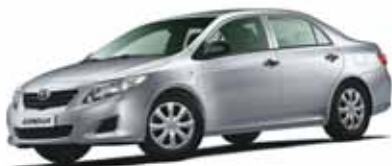
Toyota Corolla – 74

В феврале легкая коммерческая техника была представлена всего шестью