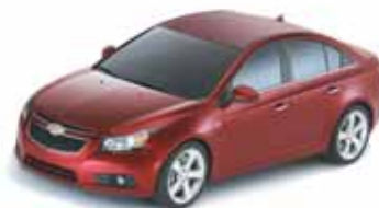
Chevrolet Cruze – 33