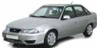
Daewoo Nexia – 71