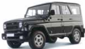
УАЗ 3151 - 31