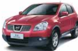
Nissan Qashqai - 26