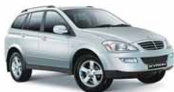
SsangYong Kyron - 10