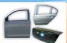
ДВЕРИ, КРЫШКИ БАГАЖНИКА