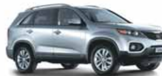
KIA Sorento - 18

Количество автомобилей проданных в Республики Казахстан в феврале 2011 года