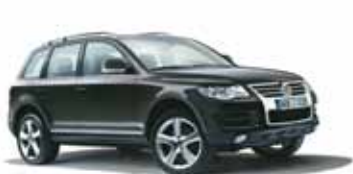
Volkswagen Touareg - 18