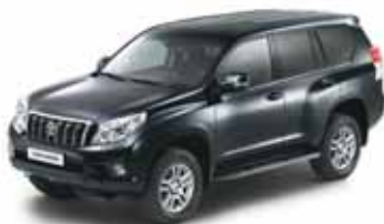
Toyota Prado - 60