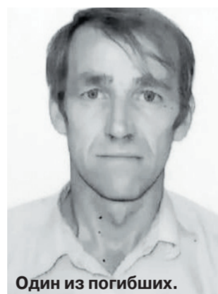
Один из погибших.

ОХОТНИК ЗАСТРЕЛИЛ ДВУХ СОСЕДЕЙ, ПОМЕШАВШИХСЯ РАЗУМОМ?