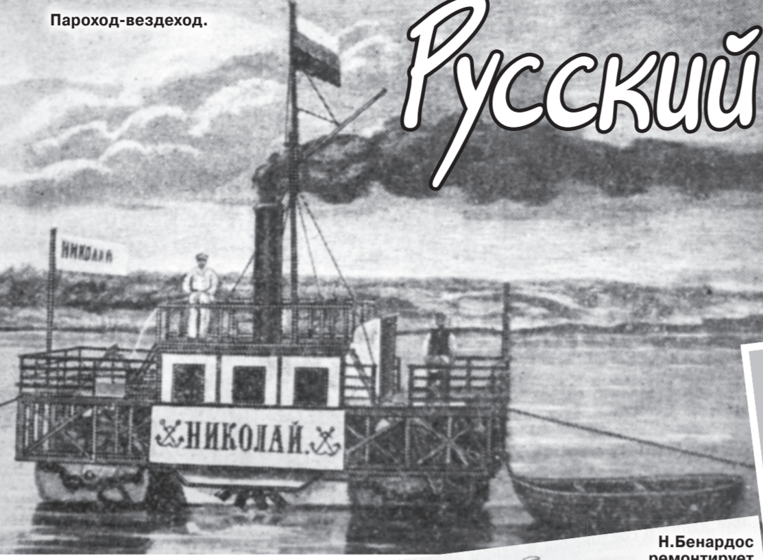
Н. Бенардос ремонтирует «электрогребестом» поврежденный котел.

«Он занимает одно из первых мест среди изобретателей мира»