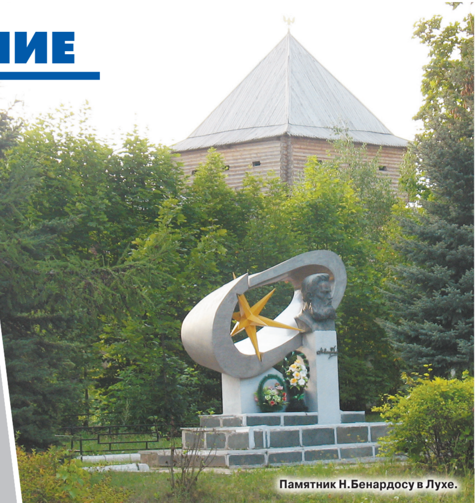
Памятник Н. Бенардосу в Луге.

Сейчас отмечается юбилей — 180 лет со дня рождения Н.Н. Бенардоса. Конечно, с непривычки сразу цепляет слух необычная фамилия. А дело в том, что Николай Николаевич грек по национальности. Но... очень русский грек! Предшествующие два поколения мужчин этой семьи жили в России и самоотверженно служили ей на военном поприще.