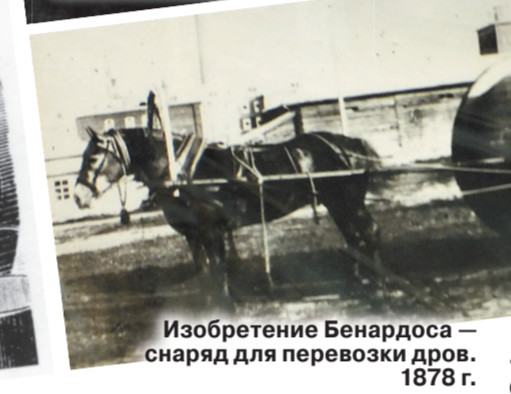
Изобретение Бенардоса — снаряд для перевозки дров. 1878 г.