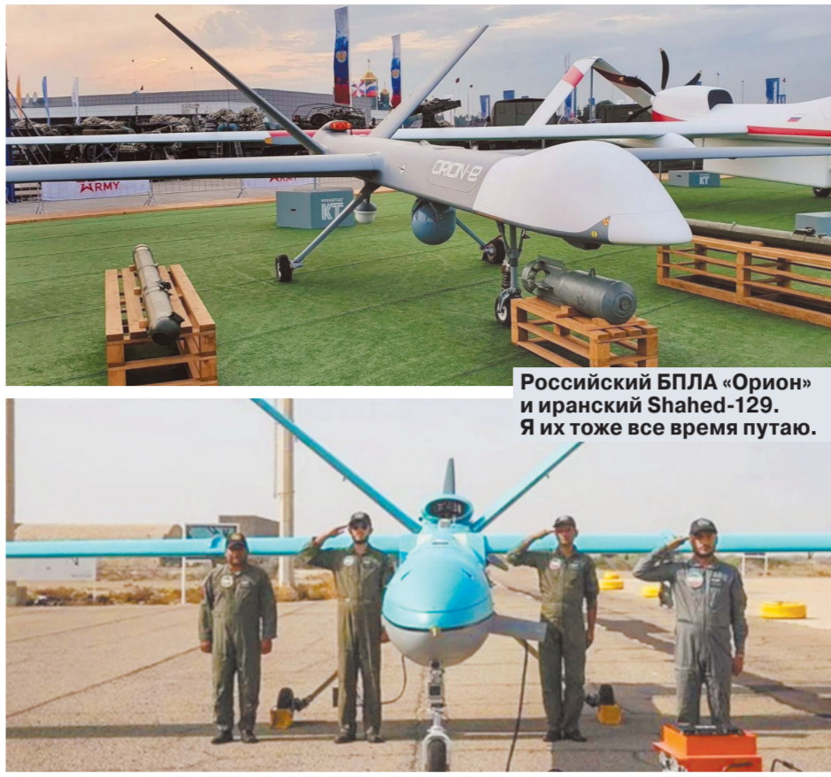
Российский БПЛА «Орион» и иранский Shahed-129. Я их тоже все время путаю.

«Европа объясняет это тем, — говорит эксперт, — что якобы выполняет обязательства перед Международной организацией гражданской авиации (ИКАО). Дескать, снимаем запрет на поставку авиационной номенклатуры в тех рамках, которые необходимы для обеспечения безопасности полетов. А какая номенклатура у нас обеспечивает безопасность полета? Да практически вся! Это и запчасти, и сертификаты, и инструменты, и расходные материалы, буквально всё. Наличие любой запчасти критично для безопасности полетов. Это следует из