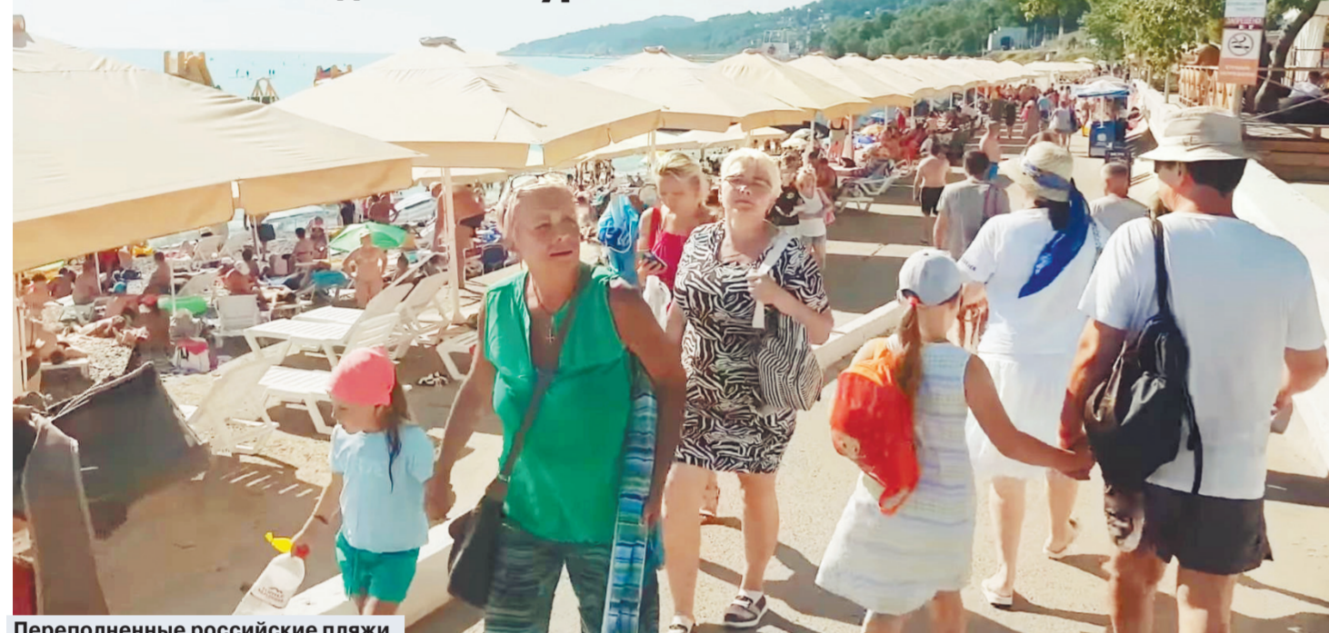
Переполненные российские пляжи.

Эксперты туротрасли выявили падение самых востребованных этим летом в россиянах направлений. Посмотрим, где же проводят отпуск сограждане и какие тратят на это суммы? И главное — что за них получают? По данным АТОР, 95% всех проданных в России туров на август приходится всего на 5 стран. При этом только в двух направлениях турпродукт на сегодня «бюджетный» (таким образом считается предложение на 10 ночей с включенным перелетом из Москвы стоимостью до 100 тыс. руб. на двоих взрослых). При этом аналитики отрасли уточняют: — Если на июль десятидневные туры в пределах 100 тыс. руб. на двоих с перелетом и питанием еще можно было купить в четыре страны — Турцию, Египет, Россию и Абхазию, то на август в этих ценовых пределах остались лишь последние две. Читайте 4-ю стр.