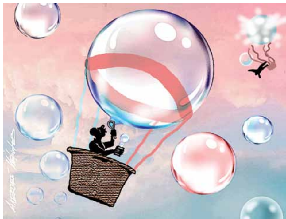
Авандил ЦУЛАДЗЕ, политолог