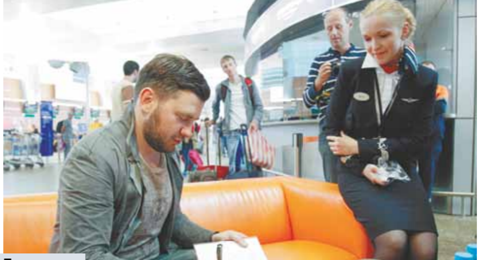
Писатель Дмитрий Глуховский.

Итак, посмотрим, что же сделано в этом направлении? На сегодняшний день российские авиакомпании запрашивали допуски на рейсы на египетские курорты из 158 российских