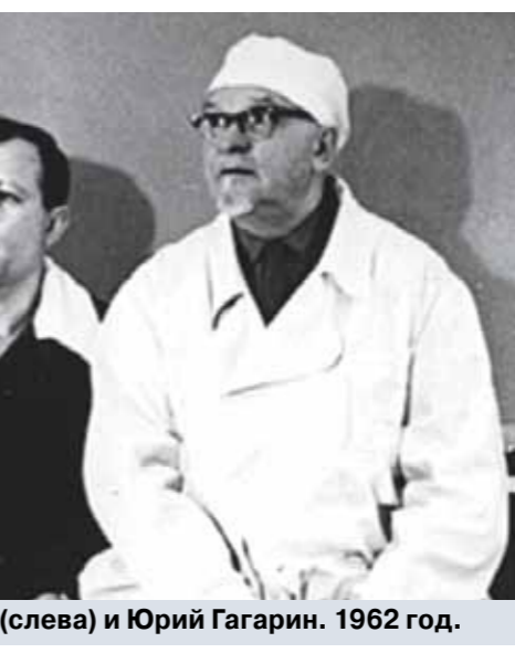
Анна Тимофеевна Гагарина (кадр из фильма «Юрий Гагарин».)

Более подробно об этой до поры до времени неафишировавшейся ситуации