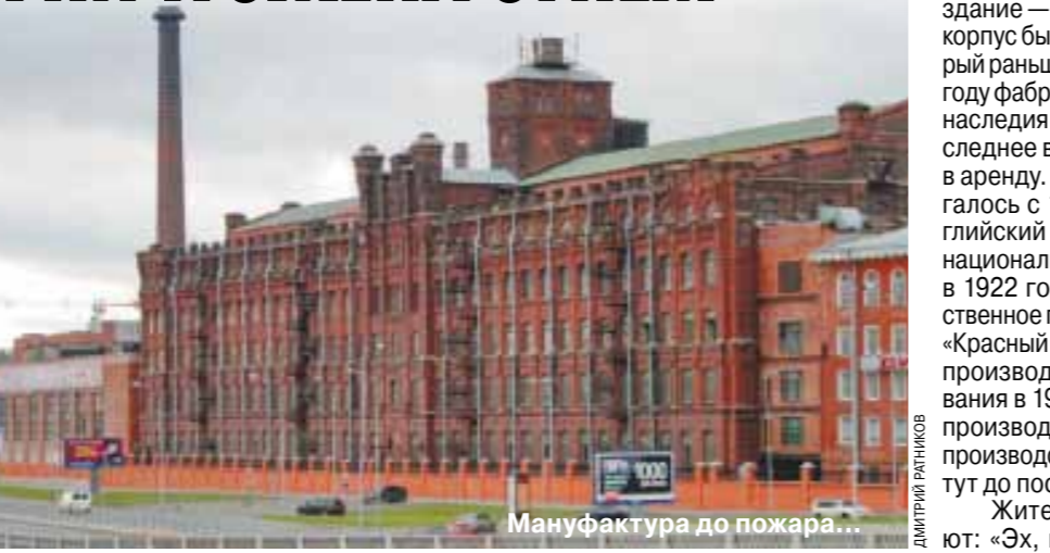
Мануфактура до пожара... Жители Невского района вздыхают: «Эх, красивое было здание» — и

Петербуржцы говорят, что весь восток города заволокло тяжелым дымом, а вертолеты МЧС видели даже за пределами города. Чуть позже они прибыли на место ЧП. Воду для тушения берут из Невы.