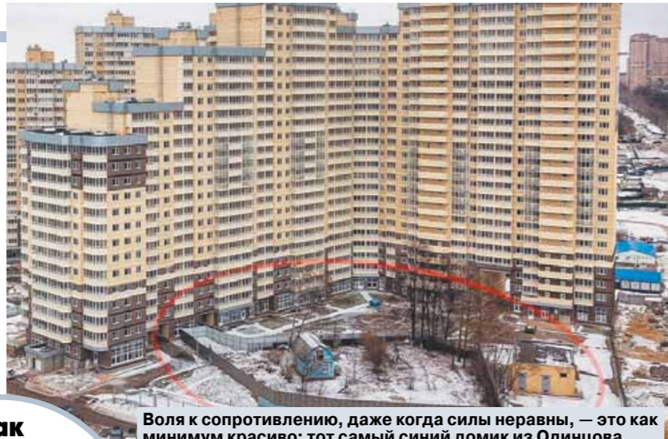
Воля к сопротивлению, даже когда силы неравны, — это как минимум красиво: тот самый синий домик из Одинцова.

в градостроительстве не бывает компромиссов — только победы или поражения.