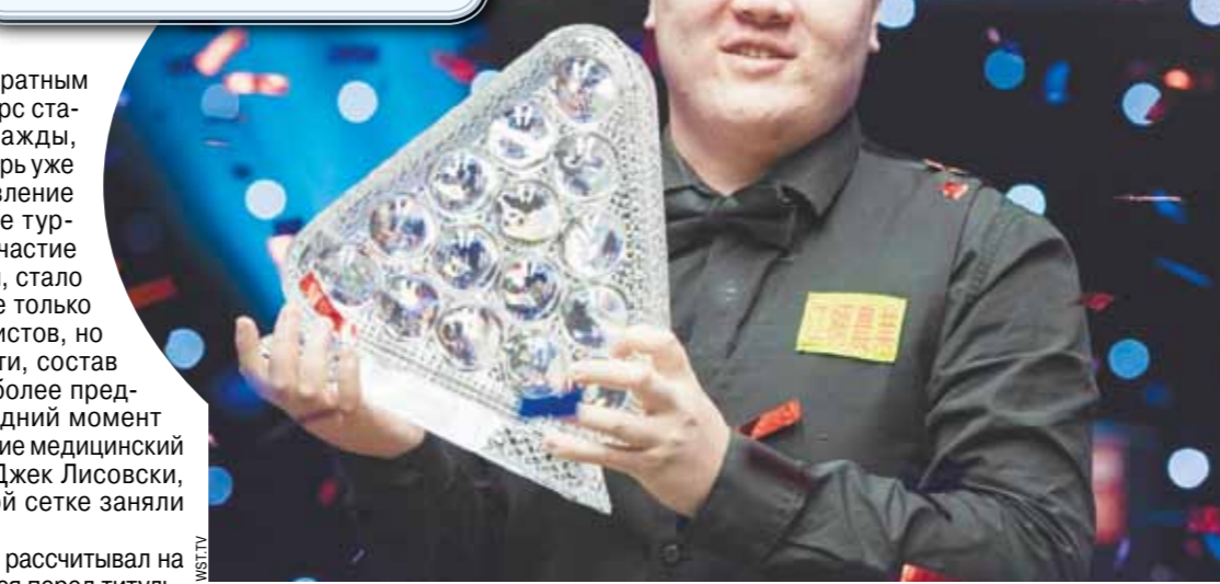
Янь Бинтао стал победителем Мастерс

Мастерс-2021 Финал: Янь Бинтао (Китай) — Джон Хиггинс (Шотландия) — 10:8 Полуфиналы: Бинтао — Бинхэм — 6:5, Хиггинс — Гилберт — 6:4 Четвертьфиналы: Бинхэм — Мерфи — 6:3, Бинтао — Магуайр — 6:5, Гилберт — К.Уилсон — 6:5, Хиггинс — О'Салливан — 6:3 1/8 финала: Стюарт Бинхэм — Теп-чайя Ун-Ну — 6:4, Шон Мерфи — Марк Уильямс — 6:4, Стивен Магуайр — Марк Сенби — 6:3, Янь Бинтао — Нил Робертсон — 6:5, Дэвид Гилберт — Джо Перри — 6:2, Кайрен Уилсон — Гари Уилсон — 6:2, Джон Хиггинс — Марк Аллен — 6:5, Ронни О'Салливан — Цзюньху Дин — 6:5