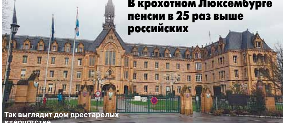
Так выглядит дом престарелых в герцогстве.

Его минимальная зарплата в начале карьеры — 5 тыс. евро. В зависимости от стажа она очень хорошо индексируется. Самозанятые на выходе тоже имеют неплохую пенсию, если они достаточно много зарабатывали.