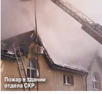
Пожар в здании отдела СКР.

Тяжелобольной следователь подпалил свой офис, чтобы избежать увольнения