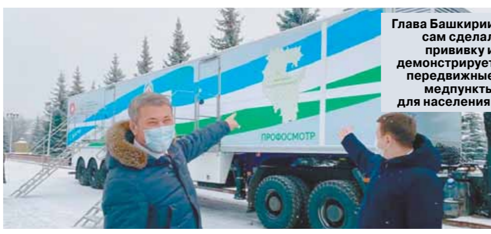
Глава Башкирии сам сделал прививку и демонстрирует передвизные медпункты для населения.

Правительство Башкирии первое в России выдает жителям региона, имеющим антитела к коронавирусу, «антиковидные паспорта».