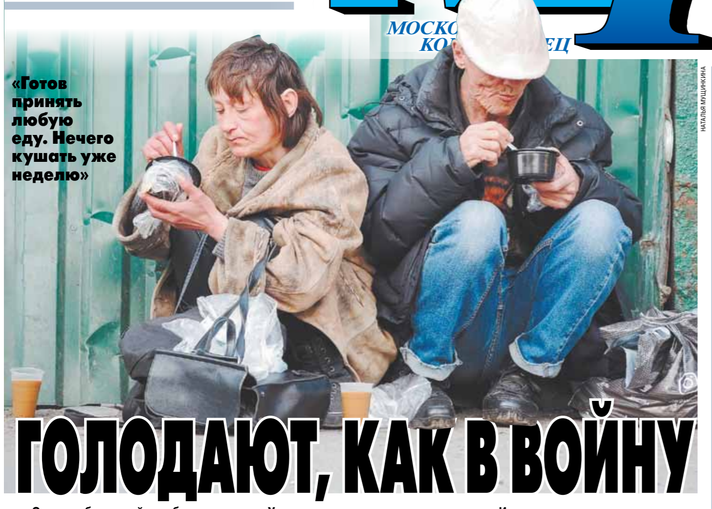
«Готов принять любую еду. Нечего кушать уже неделю»