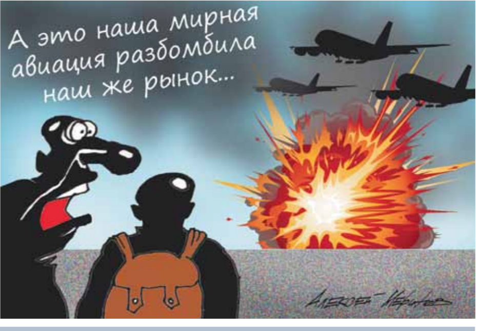
А это наша мирная авиация раздробила наш же рынок...

Возобновление авиaperезвозok не спасет отрасль: людям нечем оплатить перелет Режим самоизоляции, падение деловой и туристической активности обрушили объемы авиaperезвозok: минус 91,8% за апрель, по данным Росавиации. На сегодняшний день практически все полеты остановлены, а компании фактически находятся в режиме заморозки. Но так как обязательные платежи никто не отменял, перевозчики компенсируют издержки за счет потребителей: в мае средняя стоимость перелета по России выросла на 13%. А так как ежедневные убытки перевозчиков в среднем составляют 500 млн рублей, очевидно, это еще не предел роста цен. Читайте 3-ю стр.