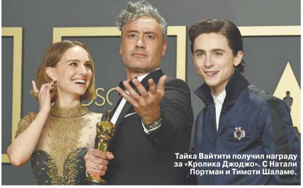
Тайка Вайтити получил награду за «Кролика Джоджо». С Натали Портман и Тимоти Шаламе.