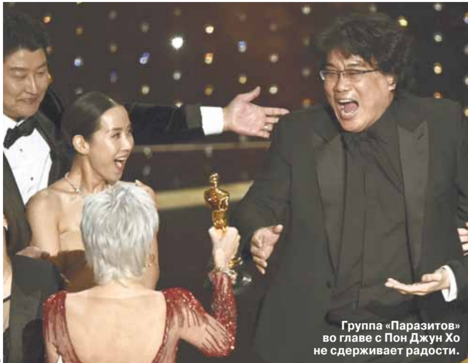
Группа «Паразиты» во главе с Пон Джун Хо не сдерживает радости.

За несколько дней до вручения «Оскаров» Пон Джун Хо лишний раз доказал, что он — настоящий кинематографист, способный ради искусства на многое. На Роттердамском кинофестивале он представил черно-белую версию «Паразитов», которая, с его точки зрения, открывает новые возможности для восприятия фильма. Получая награду, Пон Джун Хо признавался в любви к Мартину Скорсезе, на картину которого учился. Теперь он со своим кумиром вступил в поединки — и выиграл. «Ирландец» Скорсезе, ставший самым высокобюджетным фильмом из всех представленных в главной номинации (по-скольку прорыв денег съели технологии по омоложению актеров старшего поколения во главе с Робертом Де Ниро), остался без наград. А «1917» отмечен за звук, визуальные эффекты и операторскую работу 70-летнего Роджера Дикинса, который, как говорят, снимал чуть ли не одним кадром, в чем многие кинематографисты сомневаются.