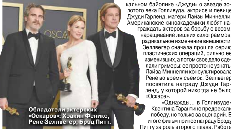
Обладатели актерских «Оскаров»: Хоакин Феникс, Рене Зеллвегер, Брэд Питт.

Ради роли стендап-комика и психопата Артура Флека, воплотившего все зло мира