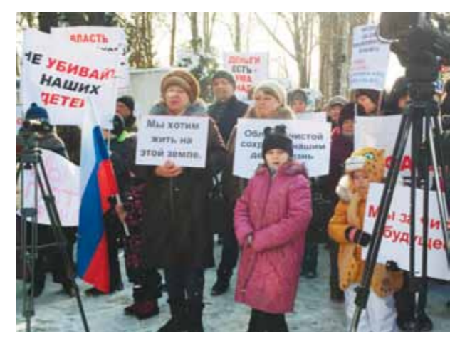
Читайте 6-ю стр.

Эта история о том, как один мужик двух олигархов победил. То есть, конечно, не один, мужиков было много, равно как и женщин, но все они — самые простые люди. А вот олигархи, о которых идет речь, не простые, а из верхних строчек «Форбс», и за них горой стояла толпа коррупционных чиновников. Под силу ли простым людям сломить такой альянс? Как