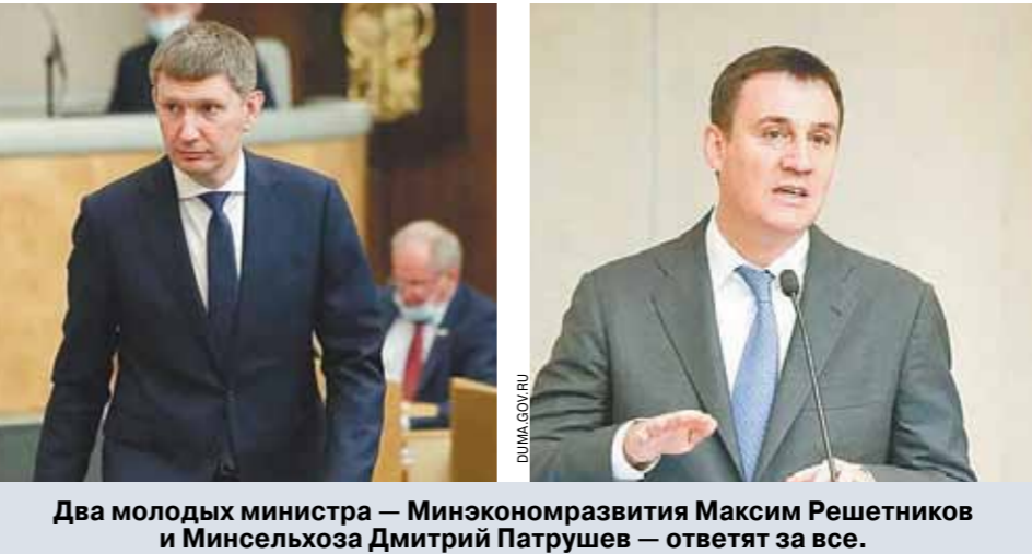
Два молодых министра — Минэкономразвития Максим Решетников и Минсельхоза Дмитрий Патрушев — отвечают за все.

Кабинет нашел способ воздержаться от применения рыночных механизмов, выполняя требование Владимира Путина: цены на подсолнечное масло и сахар будут заморожены на решениями чиновников.