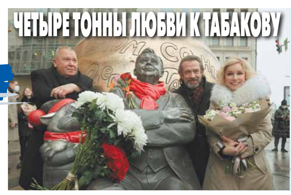
ЧЕТЫРЕ ТОННЫ ЛЮБВИ К ТАБАКОВУ

Народный артист стал и атомом, и Солнцем 14 декабря в торжественной обстановке, в компании именитых ученых и семьи Олега Табакова Владимир Машков открыл «веселенький» памятник мастеру. Этот эпитет, который не раз повторял сам Табаков в адрес актерского ремесла, точно отражает концепцию новой работы скульптора Александра Рукавишника. Его «Атом Солнца» — не величественная конструкция на постаменте, на которую страшно дышать, а интерактивная скульптурная композиция, которую можно потрогать руками или пройти насквозь. С церемонии открытия — корреспондент «МК». Читайте 3-ю стр.