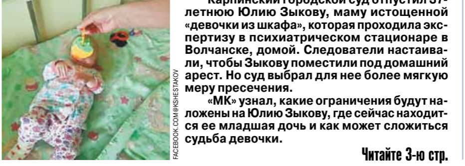
Читайте 3-ю стр.

Как и ее мать, которую суд пока отпустил домой с «запретами на определенные действия»