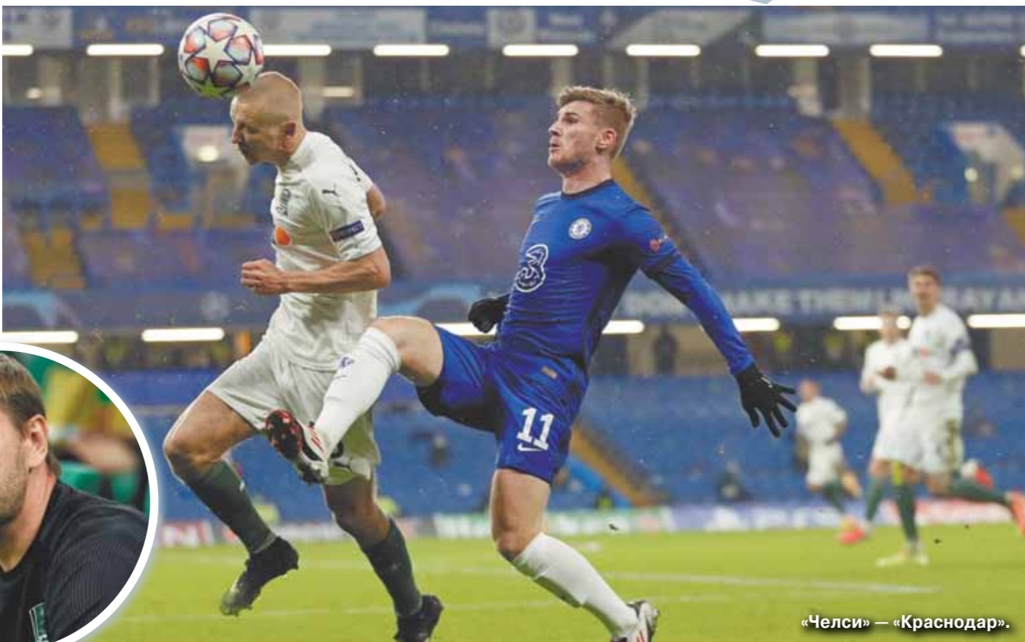
«Челси» — «Краснодар».