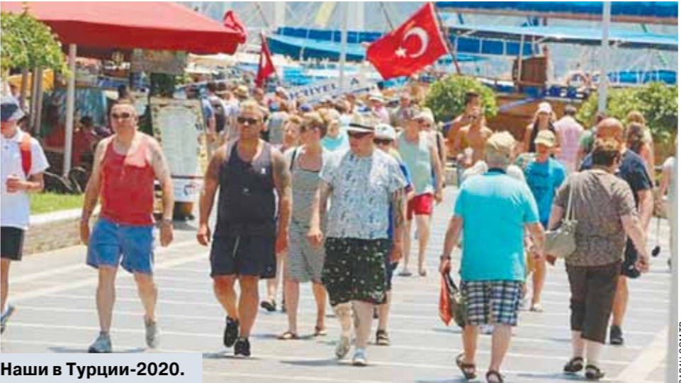
Наши в Турции-2020.