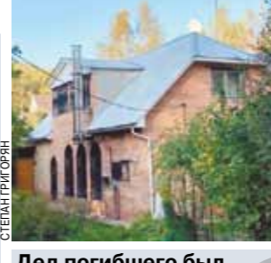
Дед погибшего был ректором института нефти и газа.