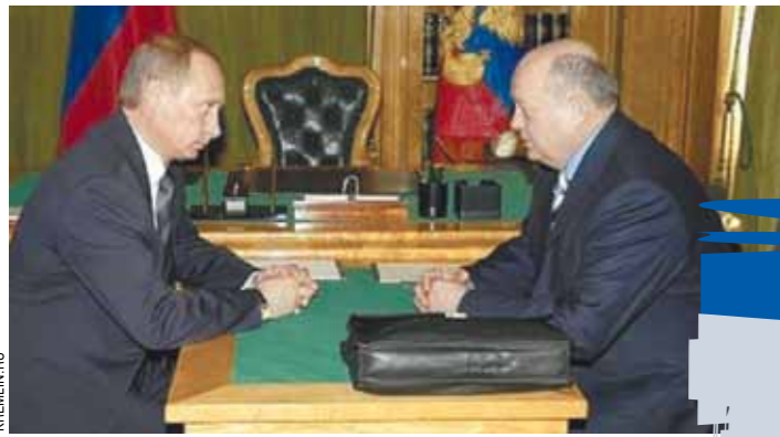
Президент и премьеры: Фрадков...