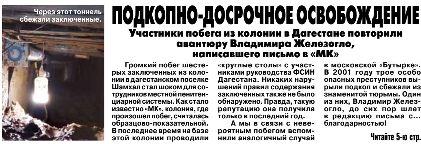
Через этот тоннель сбежали заключенные.