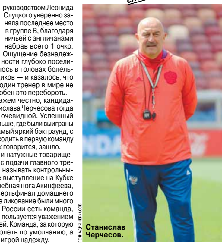
Станислав Черчесов.