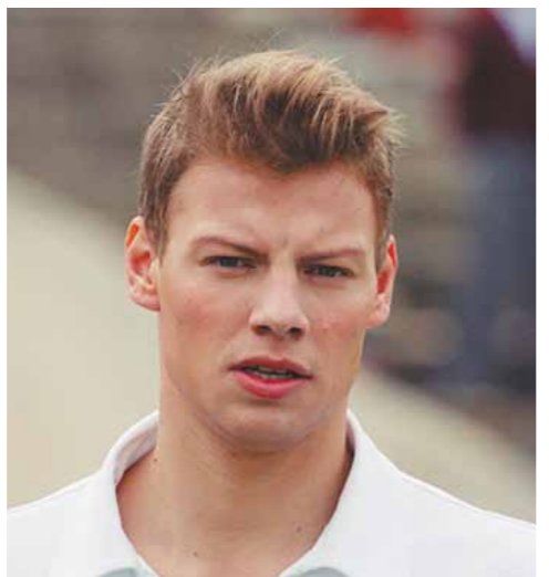
Кадр из сериала «Созвездие Стрельца».

Вот вам фильмы о спорте — они просты как правда. В них идет как бы жизнь или ее имитация. Все как у всех: бурная юность-молодость, любовь-морковь, ошибки-сомнения. Это все не главное, проходное. Народждет финал-апофеоз. Как в «Легенде №17» — первый матч с канадцами в суперсерии от 1972 года, где мы проигрывали 0:2, а выиграли 7:3. Как блистательный финал Олимпиады в Мюнхене, те самые заветные три секунды («Движение вверх»), которые потрясли мир. Как в фильме «Тренер» с Даниилом Козловским, как в фильме «Матч» — про тот самый матч смерти киевского «Динамо» с нацистами. Да, снимать игру мы научились как никто другой.