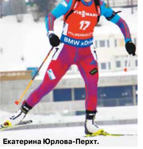
Екатерина Юрлова-Перхт.

Идут спортсмены к состоянию, которое можно оценивать, разными путями: кто-то в составе команды, кто-то индивидуально.