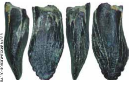
Зубы самых северных гигантских динозавров-завропод найдены в Якутии группой палеонтологов из России и Германии.

Как сообщили «МК» в Палеонтологическом институте РАН, зубы длинношейных динозавров-завропод из группы макропозии были обнаружены в местечке Тээтэ на юго-западе Якутии, близ