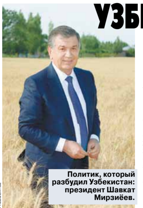
Политик, который разбудил Узбекистан: президент Шавкат Мирзиёев.