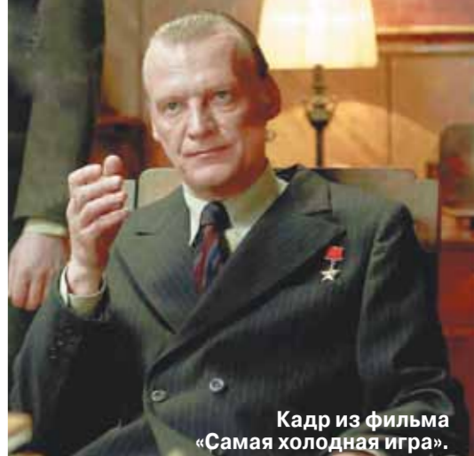
Кадр из фильма «Самая холодная игра».