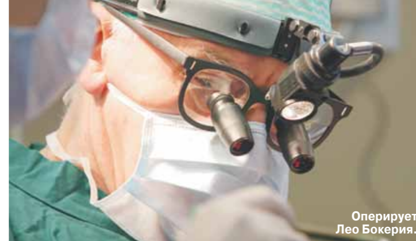
Оперирует Лео Бокерия.