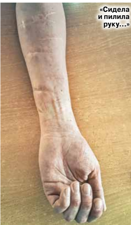
«Сидела и пилила руку...»

— Год я не видела своего сына. Человек, с которым я употребляла, жил напротив детского сада. Однажды утром я проснулась и услышала детский смех, который отозвался во мне нестерпимой болью. Я поняла: ничего ценного в моей жизни не осталось, держаться больше не за кого.