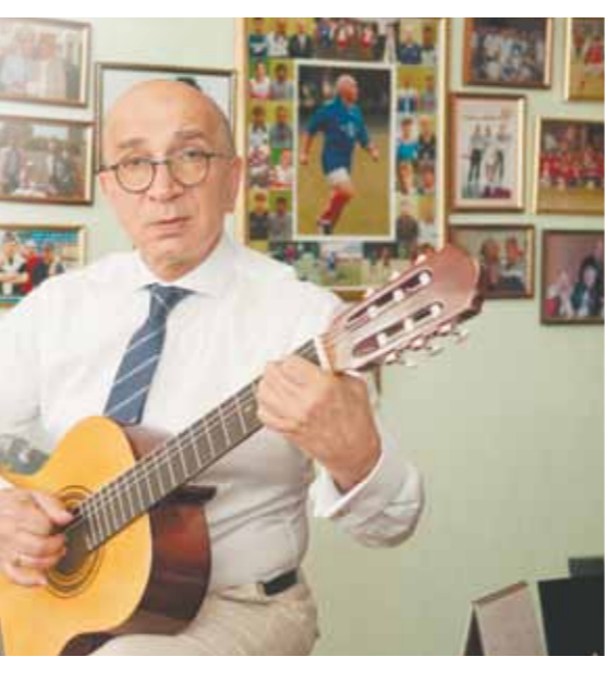
КЛИП СПОРТИВНОЙ МЕДИЦИНЫ