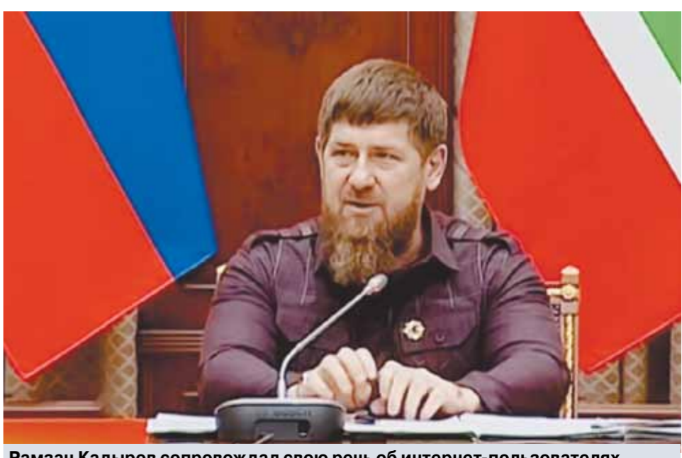
Рамазан Кадыров сопровождал свою речь об интернет-пользователях красноречивыми жестами.

Речь идет о начисленной, но не выплаченной заработной плате. Законопроект расширяет полномочия Роструда и вводит упрощенный механизм взыскания денег со счетов должника-работодателя в пользу его работников. Порядок такой: сначала госинспектор примет решение о принудительном исполнении; затем он направит документы судебным приставам, а те в свою очередь попытаются разыскать средства должника. Это позволит оперативно погасить задолженности, избежать многомесячной судебной волокиты и потери истцами средств, уходящих на оплату услуг юристов, уверен