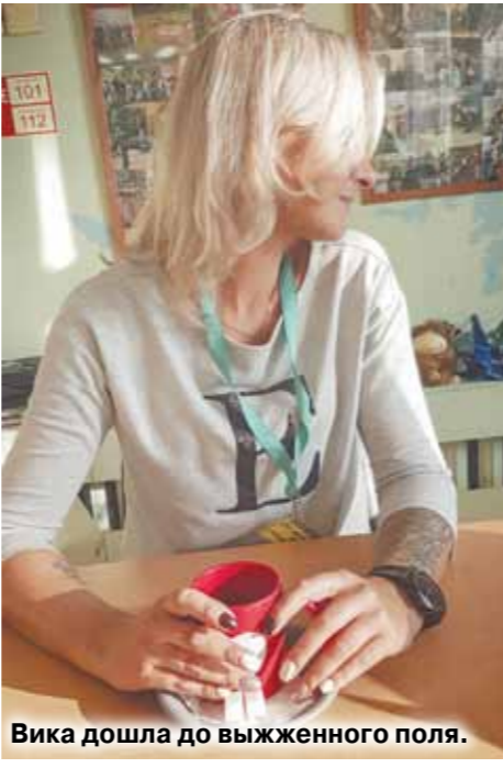
Вика дошла до выжженного поля.