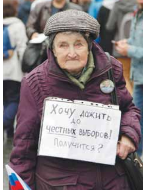
Москва. Проспект Сахарова. 10 августа 2019 г.

Это, что ли, депутат? Разве они отстаивают ваши интересы? Это, что ли, полиция? Разве она вас защищает? Бы, что ли, оппозиция? Или сознательно врёт себе и своим детям? В школе им говорят о добре, справедливости, светлых идеалах, а потом они видят в интернете, как их учителя пихают в урны липу.