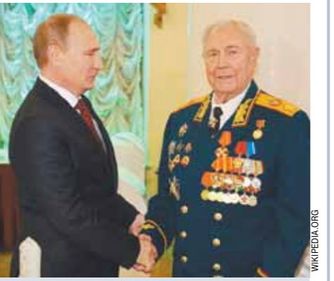
Президент Путин поздравляет маршала Язова с 90-летием.

В стране начались процессы, с которыми Дмитрий Язов был согласен. В своих мемуарах он писал: «...17 марта 1991 года народ дружно проголосовал за сохранение