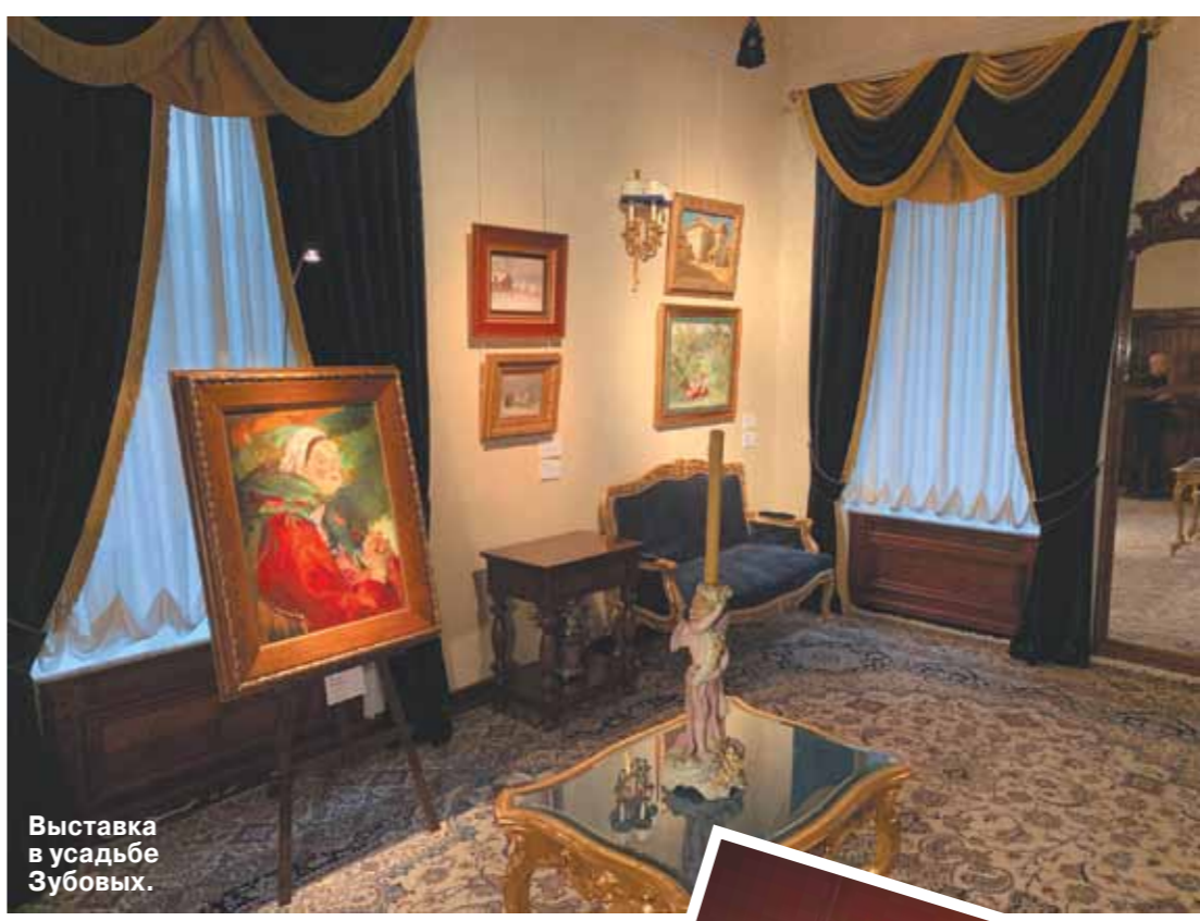
Выставка в усадьбе Зубовых.