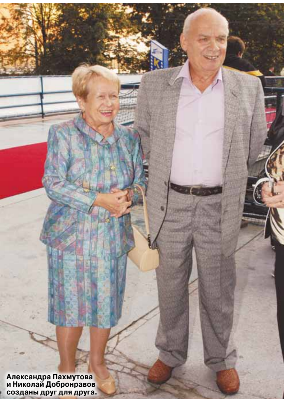
Александра Пахмутова и Николай Добронравов созданы друг для друга.

А та самая «И вновь продолжается бой» недавно вдруг зазвучала на улицах Нью-Йорка — под нее уличные танцоры полюбили танцевать брейк.