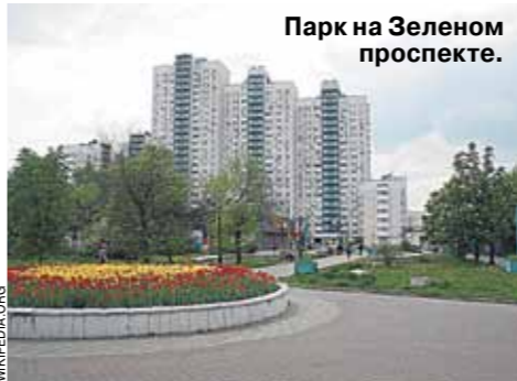
Парк на Зеленом проспекте.

Конфликты, спровоцированные идеей построить храм посреди парка, уже стали для москвичей привычными — с тех пор, как на северо-востоке города разгорелась настоящая битва за Торфянку. В пятницу, 11 октября, депутаты Мосгордумы вместе с неравнодушными жителями и представителями РПЦ собрались на круглом столе, где обсудили очередную «горячую точку» — парк на Зеленом проспекте в Восточном округе.