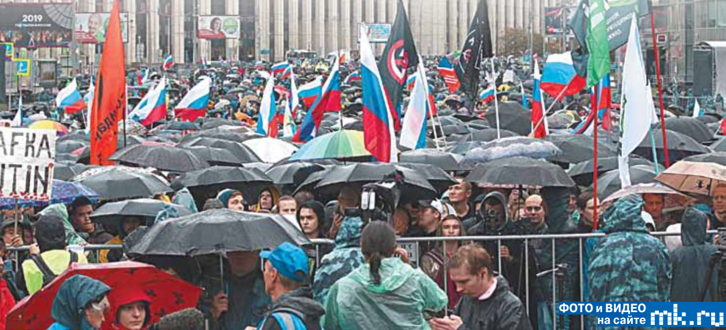
ФОТО И ВИДЕО на сайте mk.ru