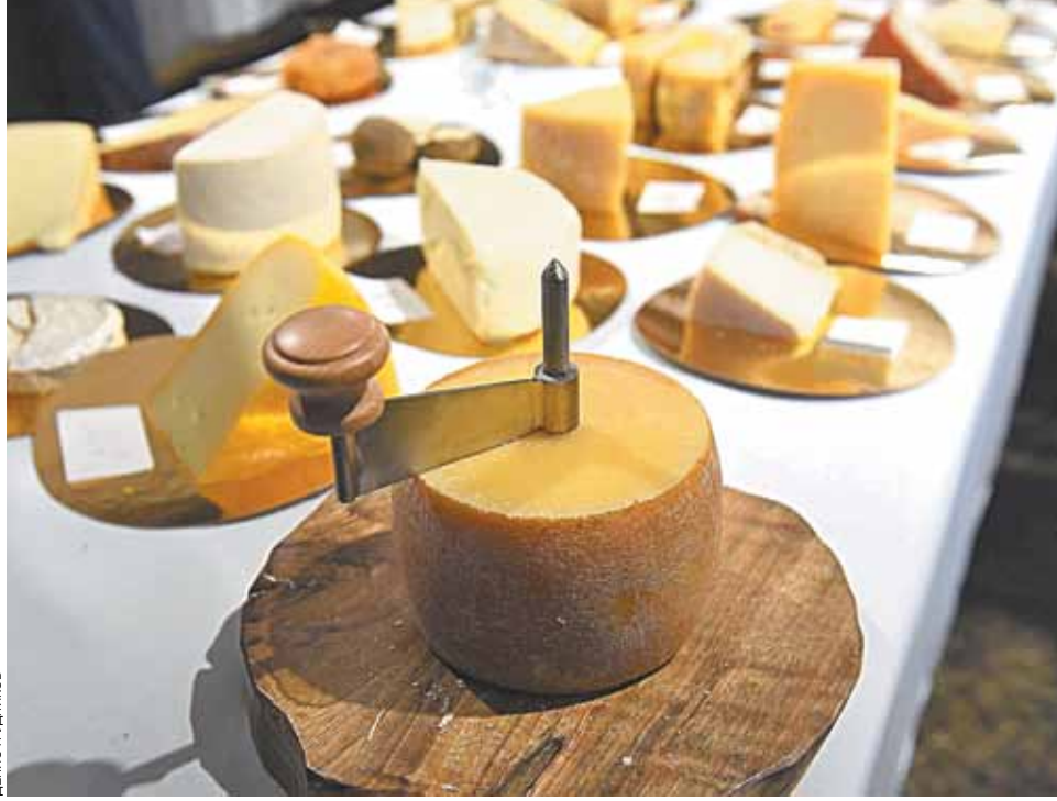
Более 100 тысяч гостей фестиваля «Сыр. Пир. Мир» в одночасье стали гурманами и поклонниками этого продукта