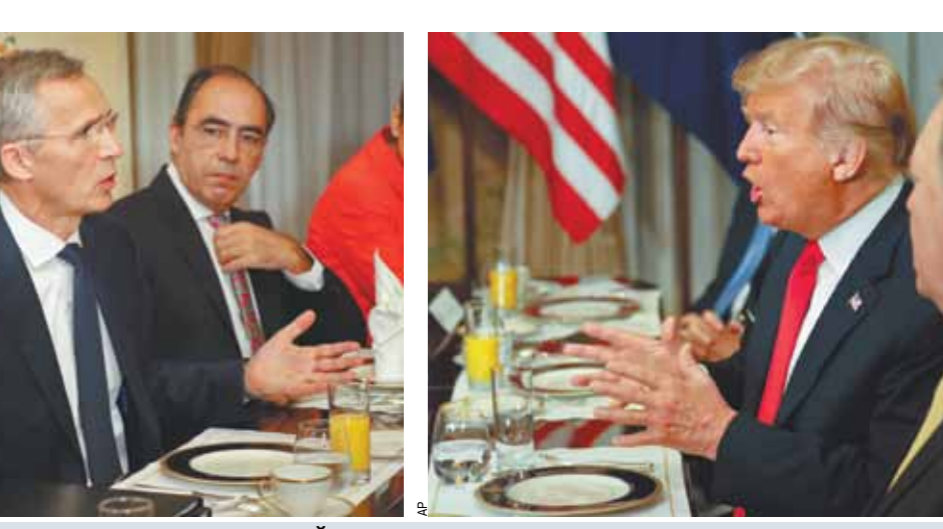
За завтраком в среду генсеку НАТО Йенсу Столтенбергу пришлось услышать от президента США немало упреков в адрес европейских членов альянса, особенно досталось Германии.